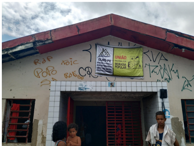
6.1. Fachada com famílias ocupando antiga unidade.