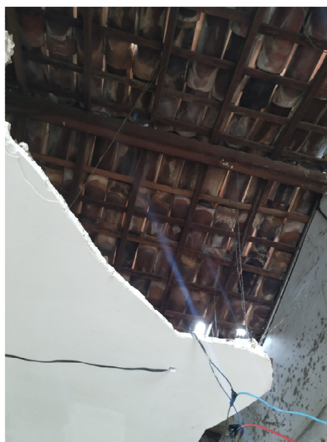
6.2. Teto 01: forro de gesso percário.