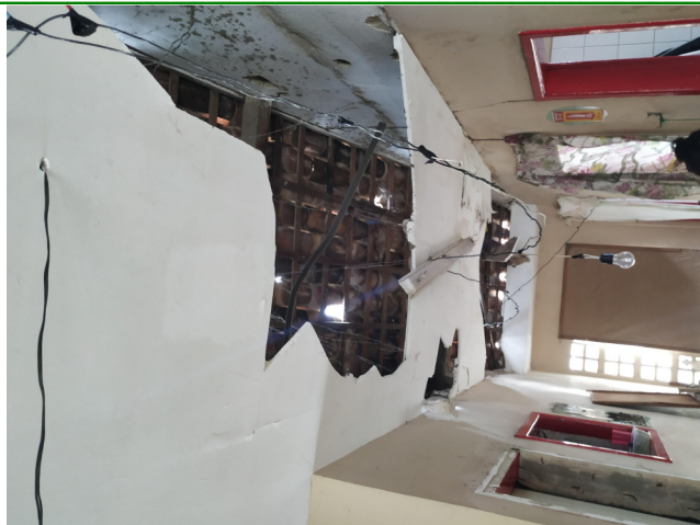
6.3. Teto 02: forro de gesso percário.