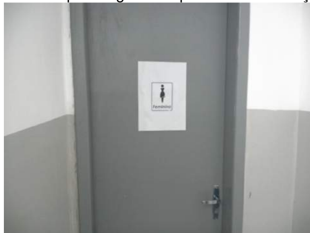
25.3. Sanitários para pacientes