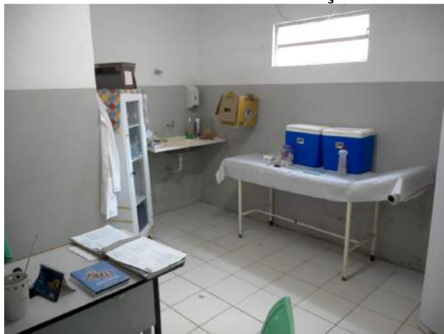
25.11. Sala de imunização / vacinação 01