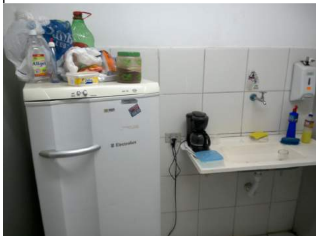
25.6. Copa 01