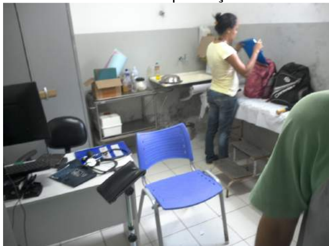
25.5. Sala de procedimentos ou sala de curativos com mofo e infiltrações