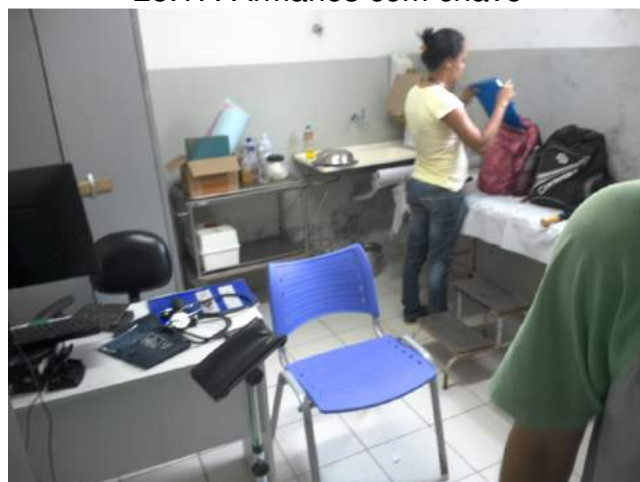
25.18. Sala de Procedimentos / Curativos