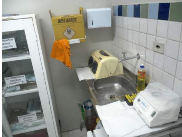
25.13. Consultório Odontológico 02