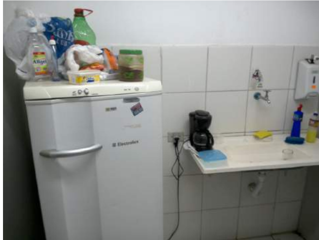
25.19. Mesa para refeições