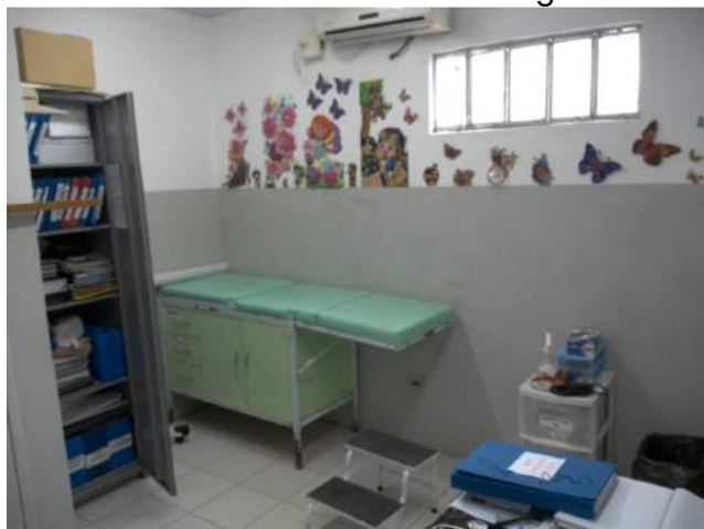
25.15. Sala de atendimento de enfermagem