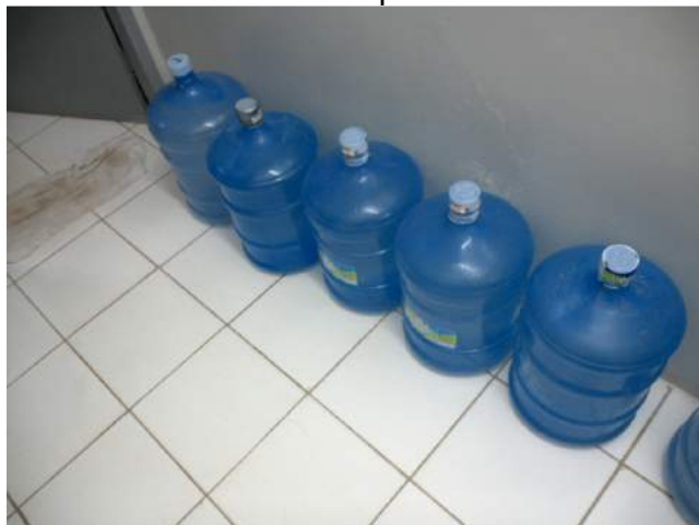
25.8. Copa 03