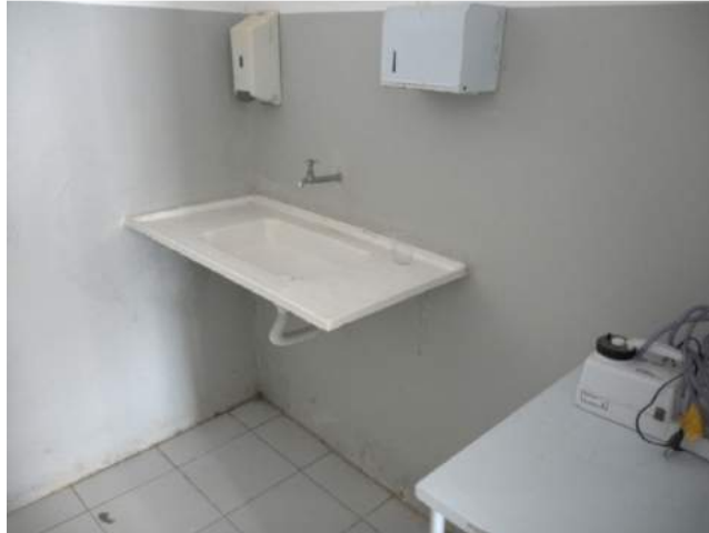
25.10. Sala de nebulização