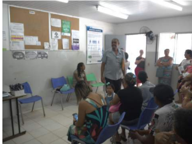
25.1. Sala de espera com bancos ou cadeiras