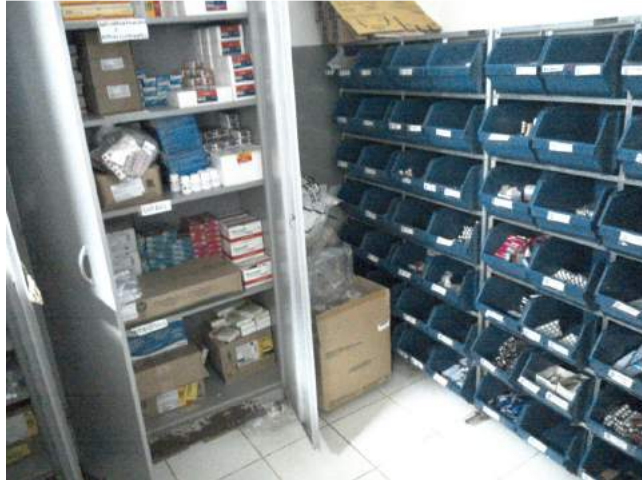
25.4. Farmácia ou sala de dispensação de medicamentos