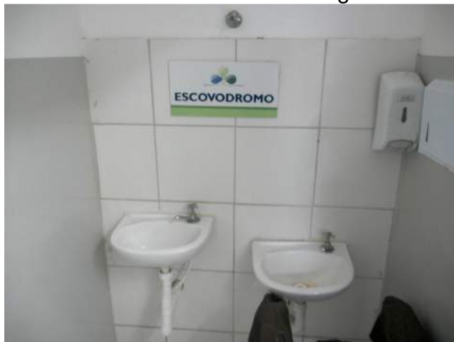
25.14. Escovário Odontológico