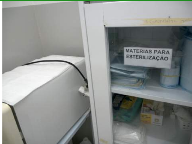
25.16. Sala de expurgo / esterilização