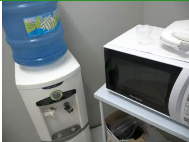
25.7. Copa 02