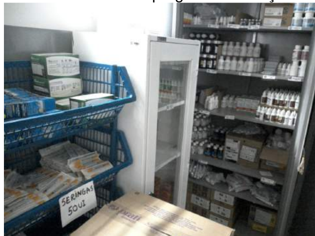
25.17. Armários com chave