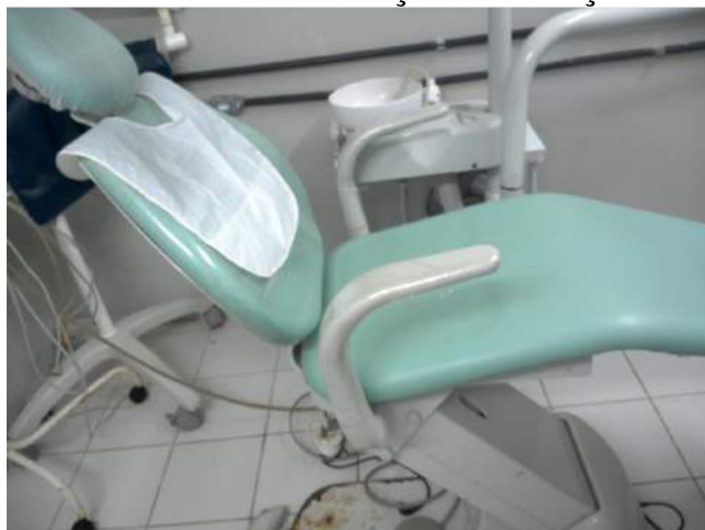
25.12. Consultório Odontológico 01