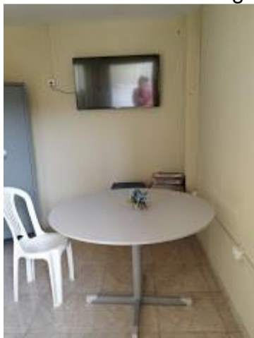
23.5. Estrutura de apoio