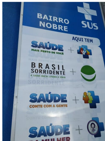
23.2. Publicidade externa / Fachada 02