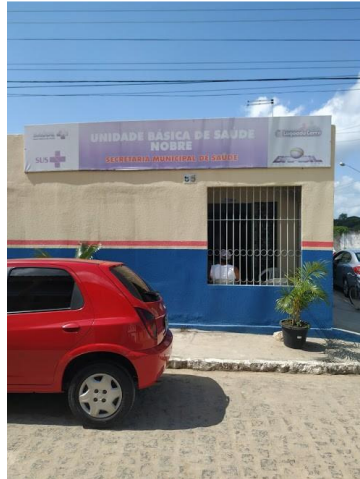
23.1. Publicidade externa / Fachada 01