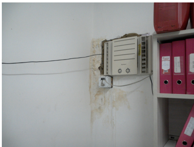
29.1. Instalações prediais apresenta mofos e/ou infiltrações