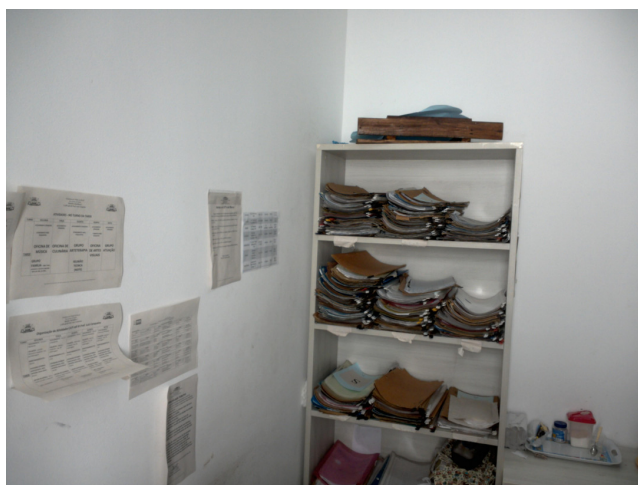
29.2. Local de guarda dos prontuários em uso (sala dos técnicos)