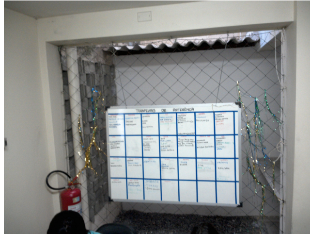
32.13. Quadro terapêutas de referência