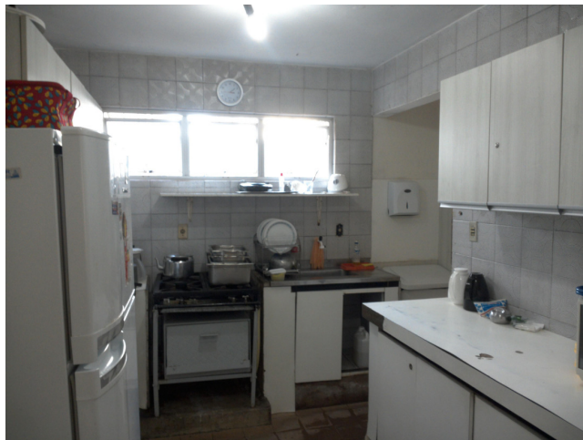
32.9. Cozinha própria