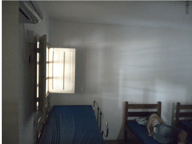
32.8. Dispõe de sala de observação dividida por sexo