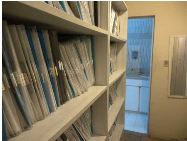
32.1. SAME co banheiro de funcionários ao fundo.