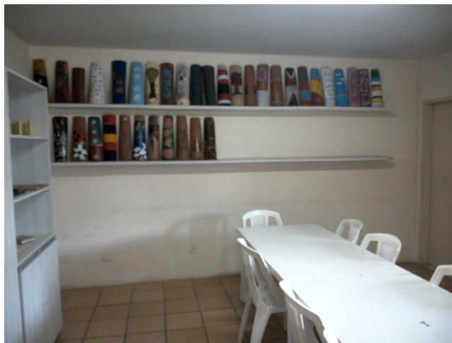
32.2. Dispõe de sala de reunião de equipe divide espaço com a sala de terapia ocupacional