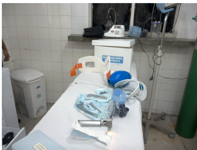
26.4. Material para intubação e ambu