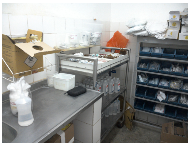
26.9. Sala de medicação.