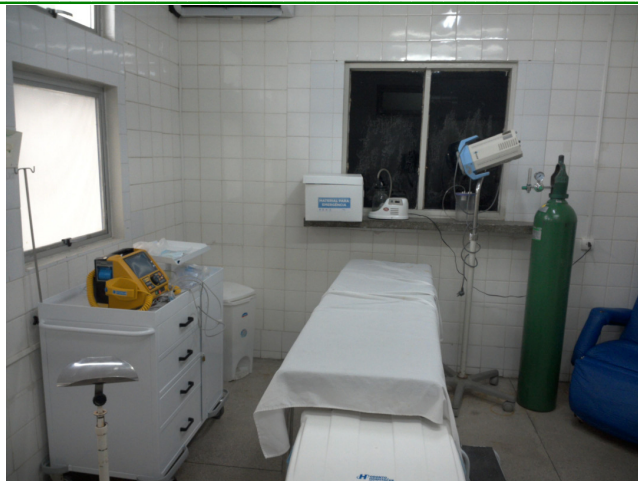
26.3. Sala vermelha com apenas uma maca estreita.