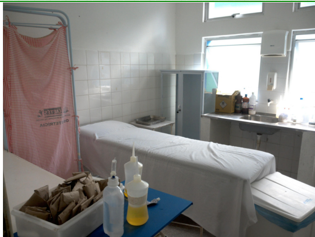
26.8. Possui sala de procedimentos / curativos