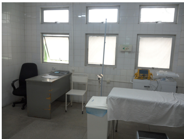
26.1. Ambiente único onde compartilha espaço a sala vermelha, a triagem e a sala de medicação.