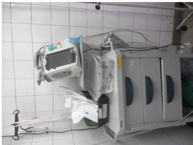
24.2. Dispõe de carrinho, maleta ou kit contendo medicamentos e materiais para atendimento às emergências