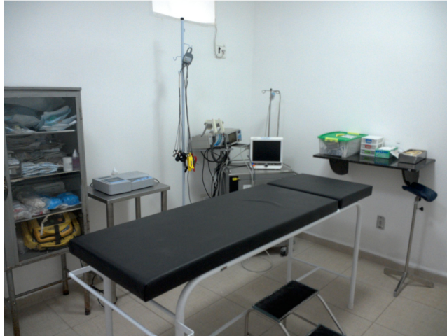
24.3. Dispõe de sala de reanimação (sala vermelha) com apenas leitos