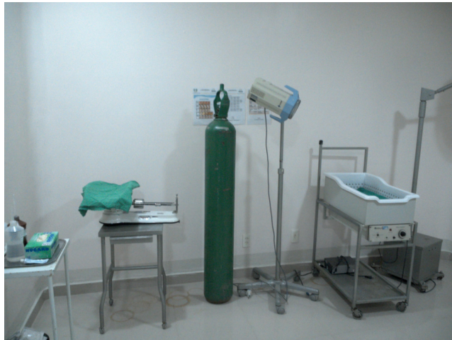
24.16. Sala de parto (foto 2)