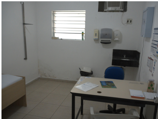
24.4. Dispõe de consultório médico