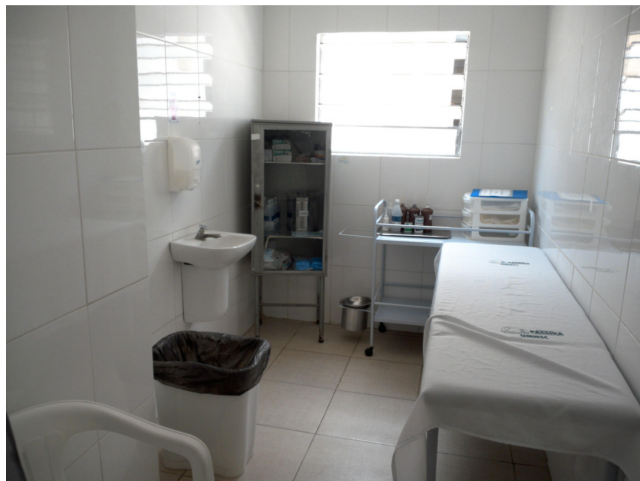
24.9. Possui sala de procedimentos / curativos