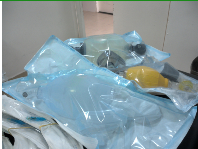
24.8. Ressuscitador manual do tipo balão auto inflável com reservatório e máscara