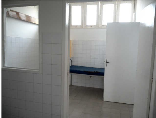
24.13. Dispõe de sala de isolamento com anticâmara