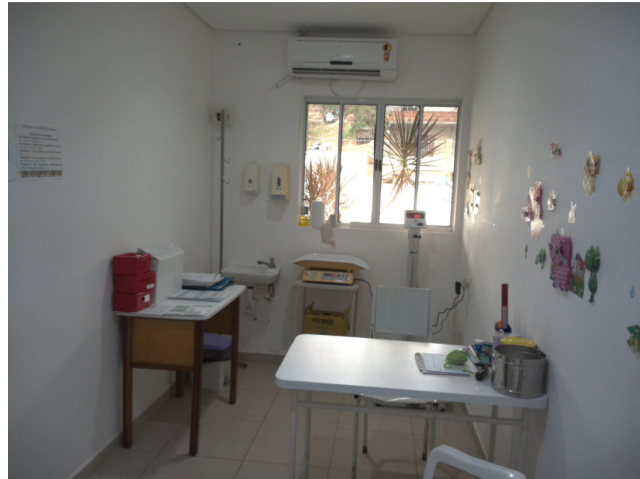
24.1. Sala de classificação de risco