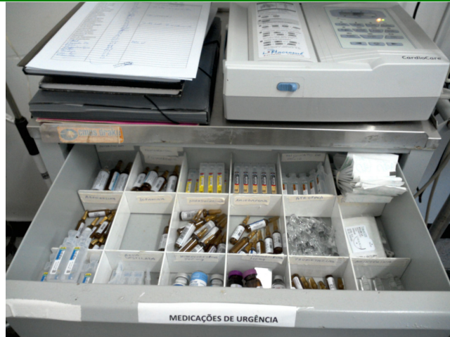
36.8. Medicação do carrinho de parada