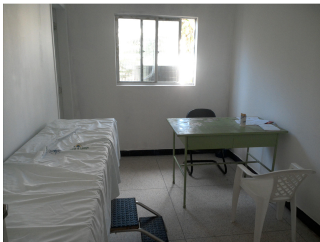
36.4. Consultório de pediatria com banheiro anexo