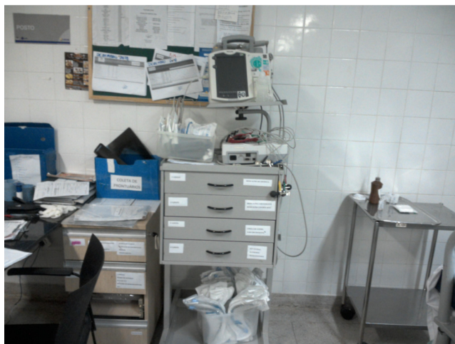
36.14. Carrinho de parada da emergência