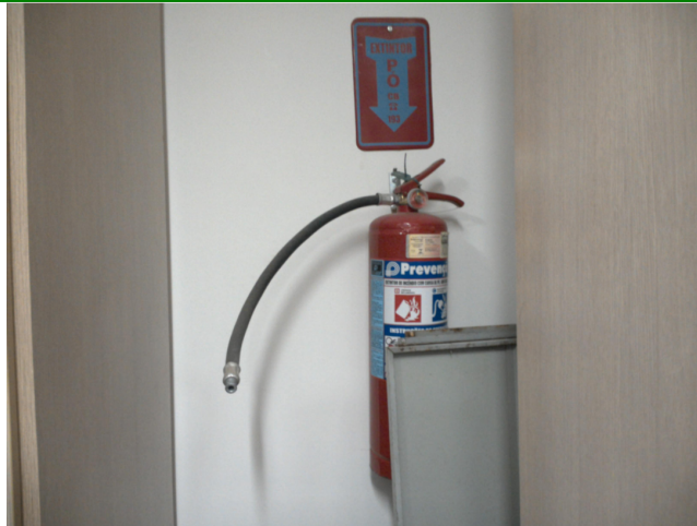
36.3. Dispõe de extintor