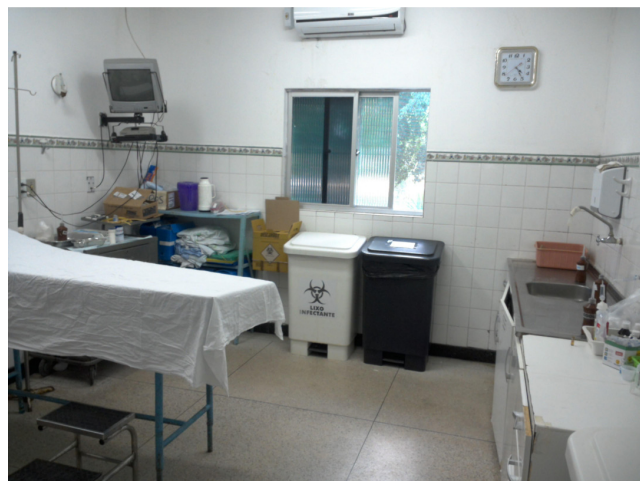
36.9. Sala de medicação da pediatria