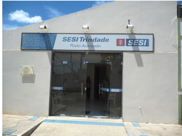
23.1. Posto Sesi Trindade