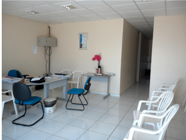
23.8. Recepção / Sala de espera