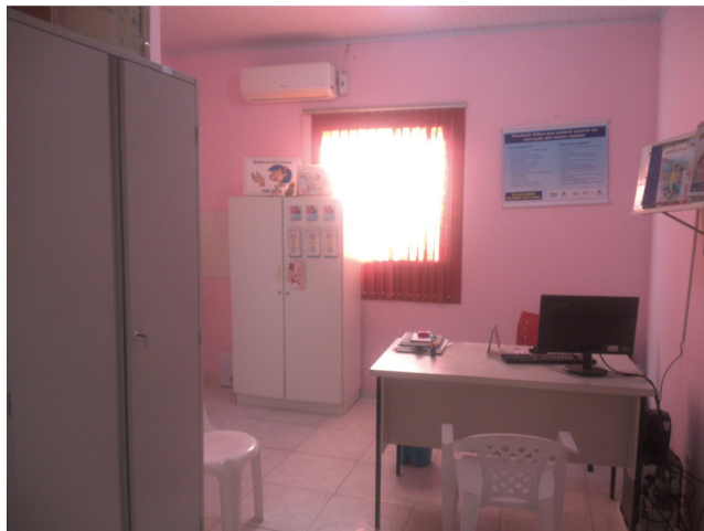
26.4. Sala de atendimento de enfermagem