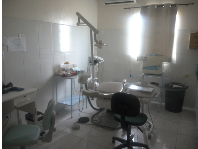
26.3. Consultório Odontológico