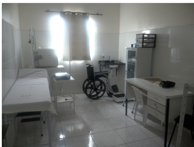
26.2. Sala de curativo, também utilizada para realização da pré-consulta