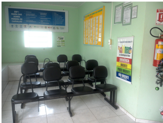
26.1. Recepção e sala de espera