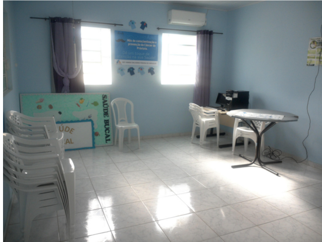
26.8. Sala de reunião de equipe