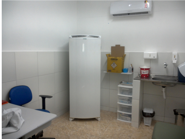
28.8. Sala de vacina