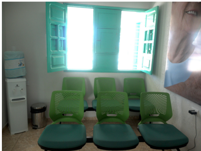
28.4. Sala de espera