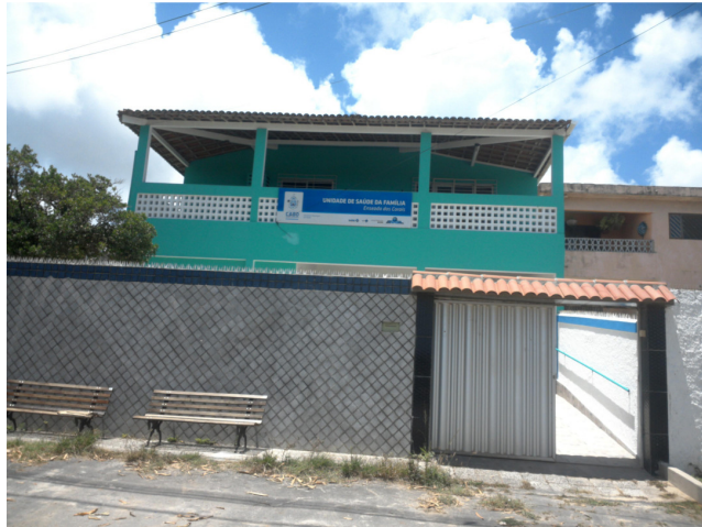
28.1. Fachada da nova unidade