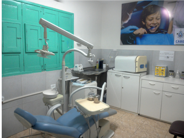
28.3. Consultório odontológico