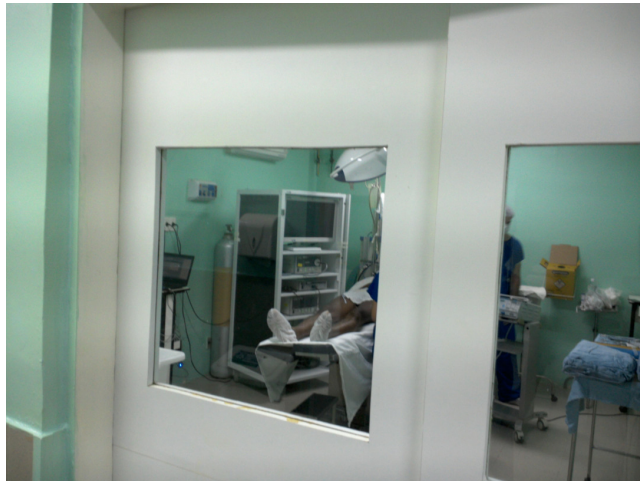
12.16. Centro Cirúrgico