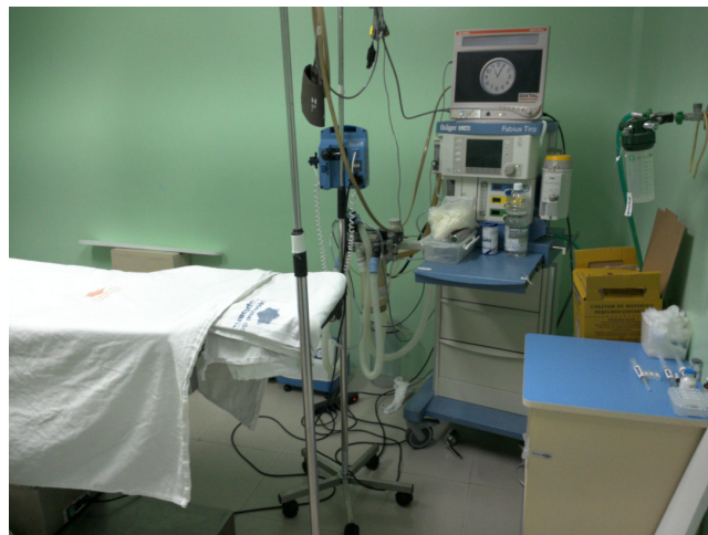
12.12. Centro Cirúrgico