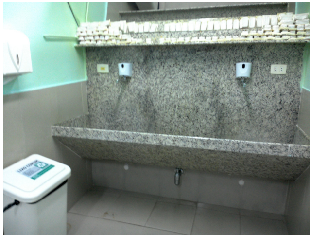
12.14. Lavabo do centro cirúrgico