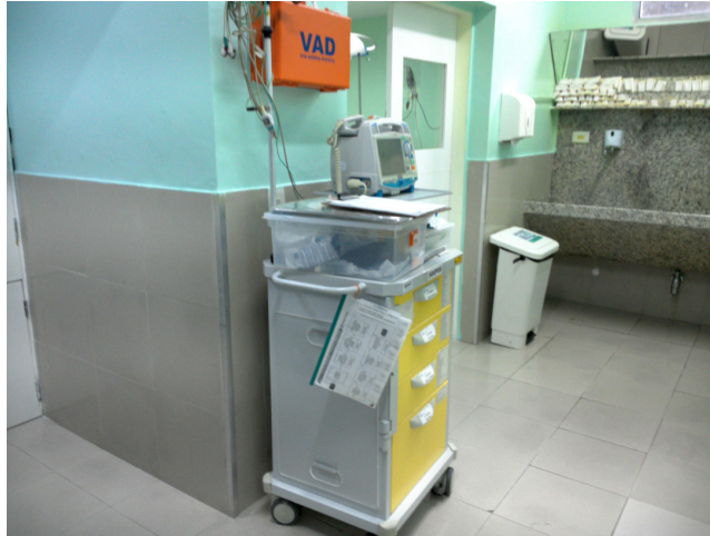
12.13. Carrinho de Parada do Centro Cirúrgico