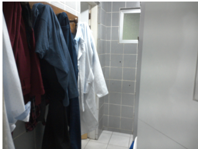
12.9. Vestiário do Centro Cirúrgico