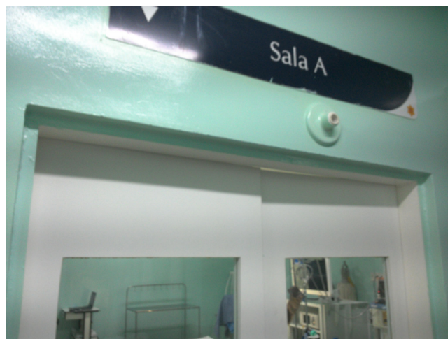
12.17. Centro Cirúrgico