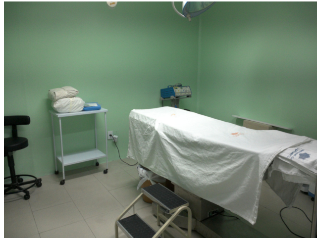
12.11. Centro Cirúrgico