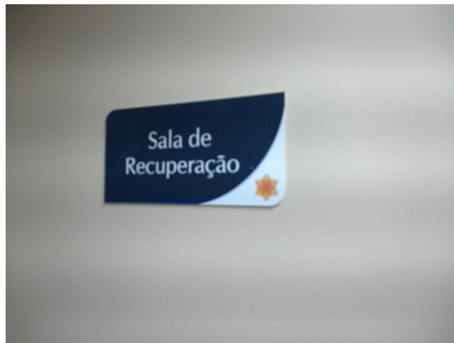
12.2. Sala de Recuperação Pós Anestésica