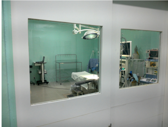
12.18. Centro Cirúrgico