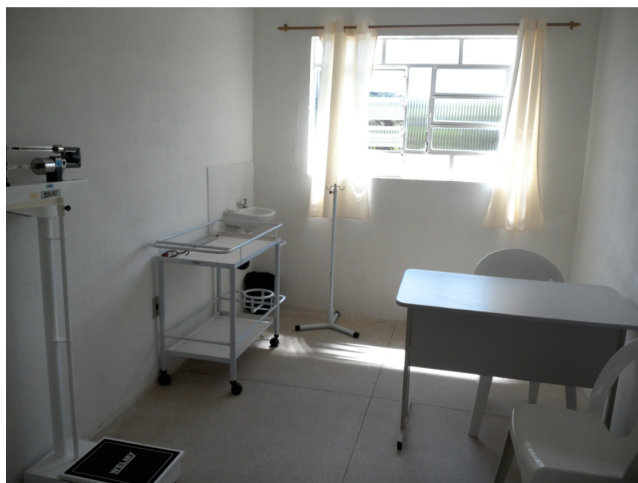
18.4. Sala de pré-consulta que serve também para realização dos curativos