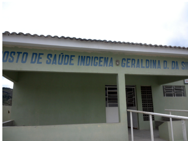
18.1. Posto de Saúde Indígena Geraldina Dias da Silva