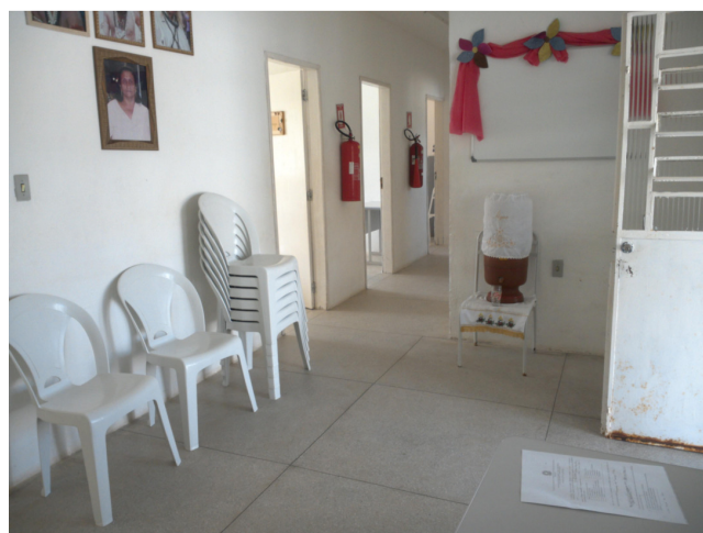
18.2. Recepção / Sala de espera