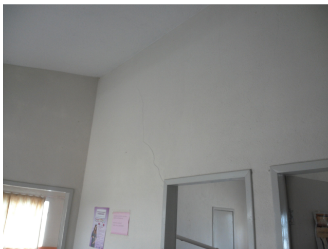
14.2. Observar rachaduras