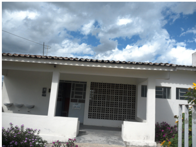
14.1. Posto de Saúde Indígena de Sucupira