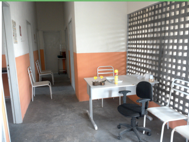
14.3. Dispõe de recepção/ sala de espera