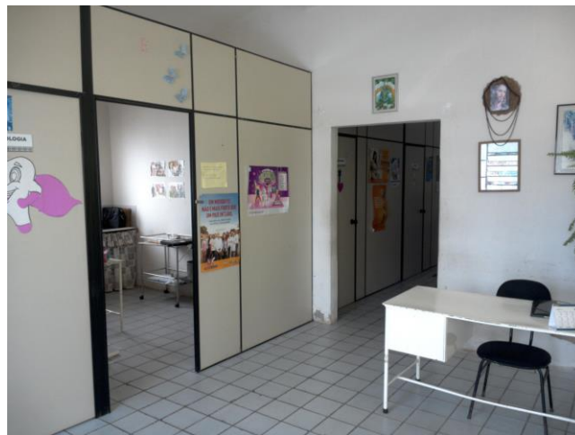
9.2. A área física é adequada para o que se propõe