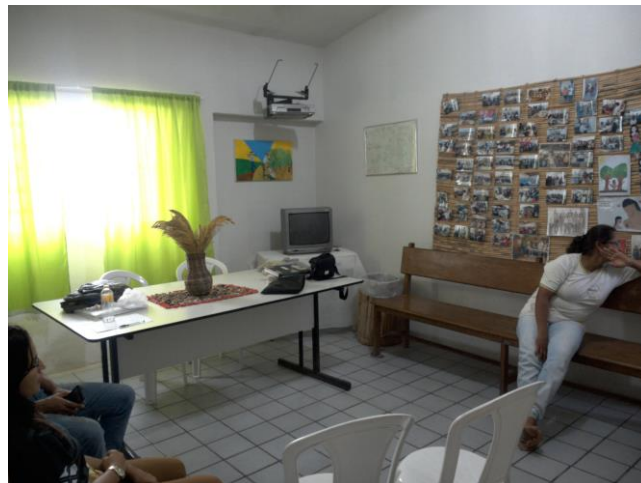
9.4. sala reunião