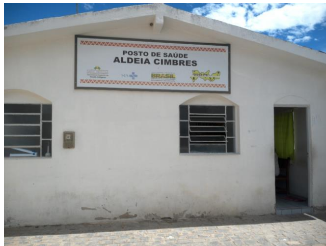
9.1. O imóvel é próprio