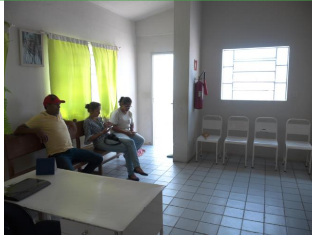
9.3. Recepção / Sala de espera