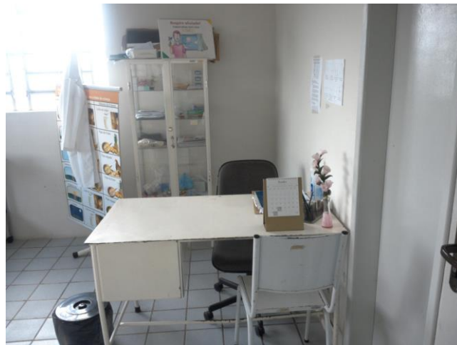
9.9. sala de coleta