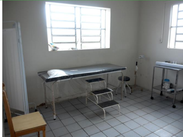
9.8. Sala de coleta citológica