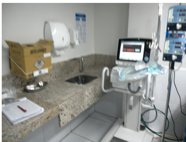
14.11. Sala vermelha