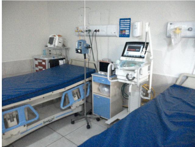
14.15. Sala de observação