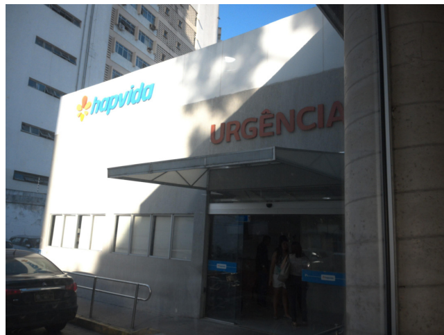
14.1. Fachada/Entrada da unidade