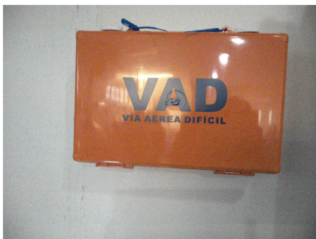
14.18. Material para via aérea difícil