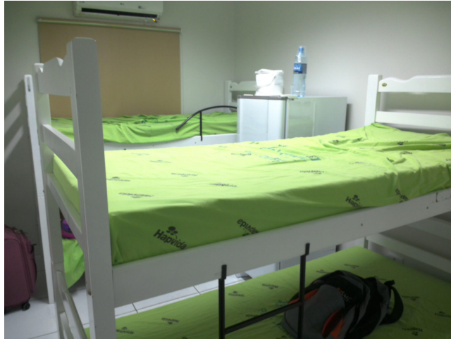
14.20. Quarto de plantão