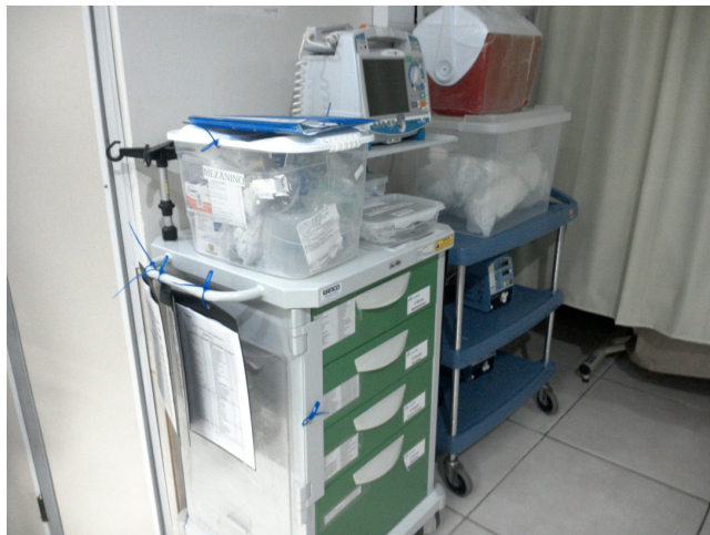
14.16. Sala de observação