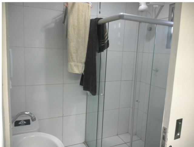
14.21. Banheiro do quarto de plantão