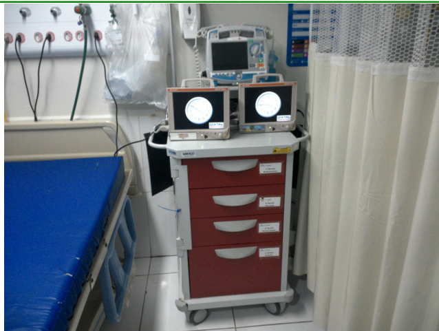
14.10. Sala Vermelha