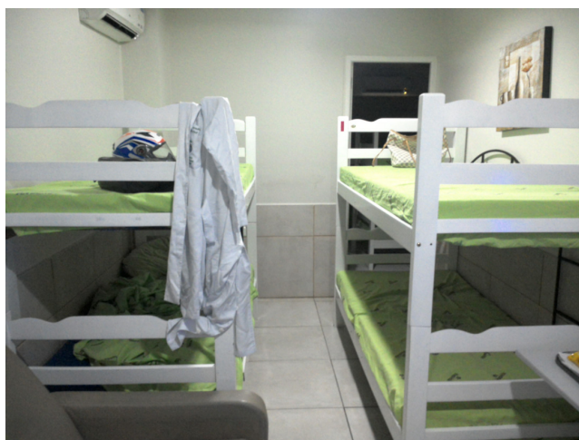
14.19. Quarto de plantão