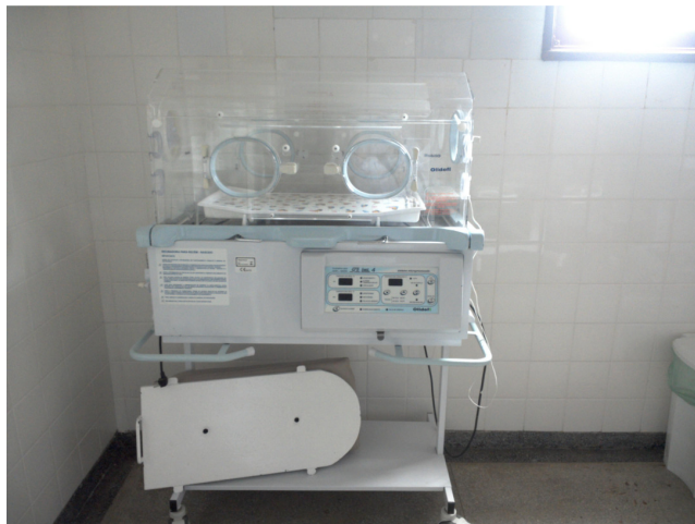
26.14. Incubadora de transporte