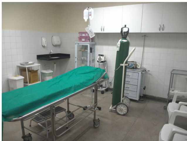
26.2. Sala vermelha