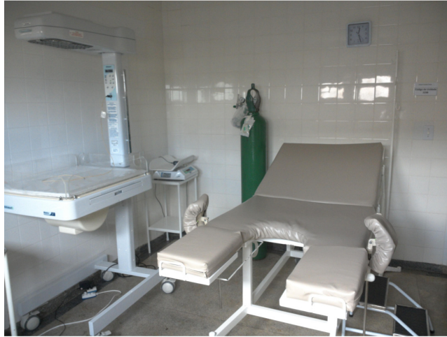
26.13. Sala de parto