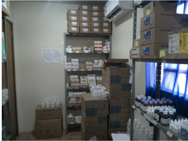
26.16. Dispensário de medicamentos (foto 2)