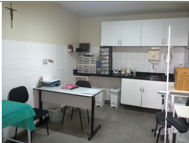
26.3. Sala de medicação