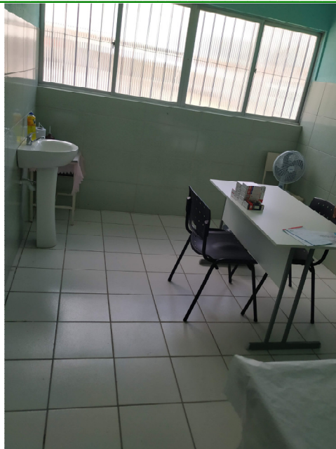
20.3. Consultório médico