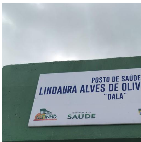
20.1. Fachada 01