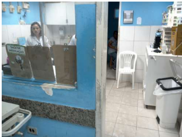
13.23. Posto enfermagem da emergência