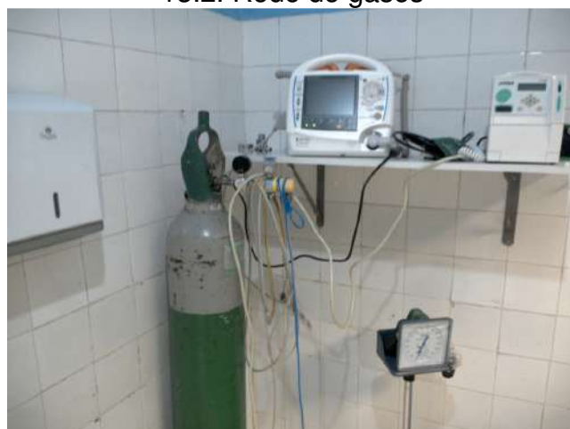
13.3. Sala de estabilização 01