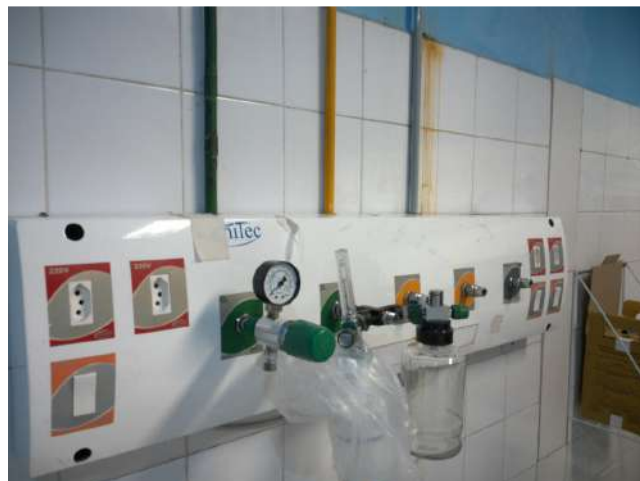
13.2. Rede de gases