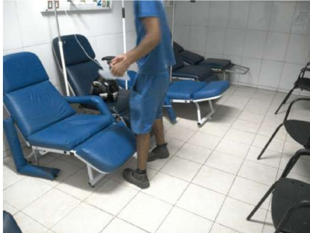
13.16. Sala de nebulização 01