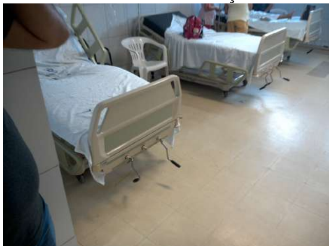
13.6. Macas de observação