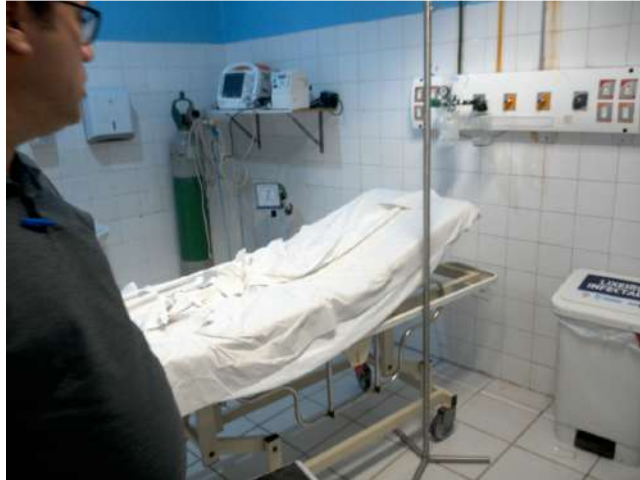
13.4. Sala de estabilização 02