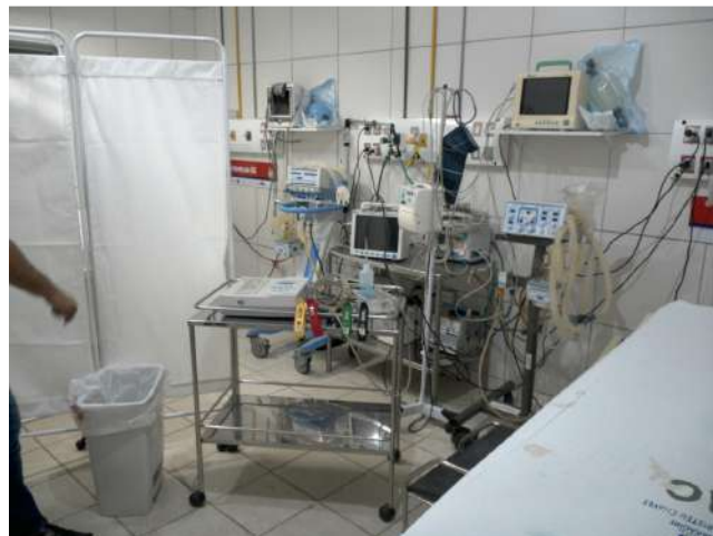
13.20. Sala vermelha 02