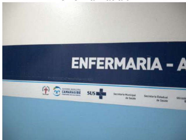
13.14. Área de internação 01