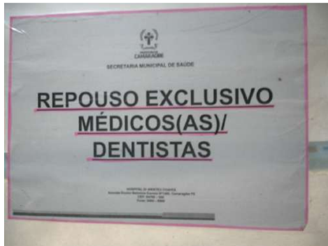
13.8. Quarto dos médicos 01