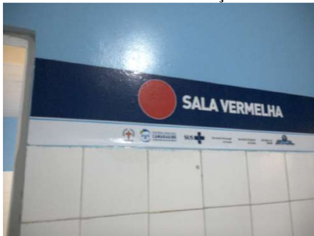
13.5. Sala de estabilização 03