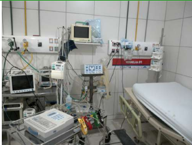
13.22. Sala vermelha 04