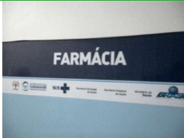
13.10. Farmácia 01