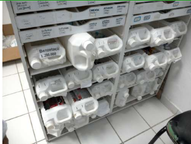
13.13. Farmácia 04