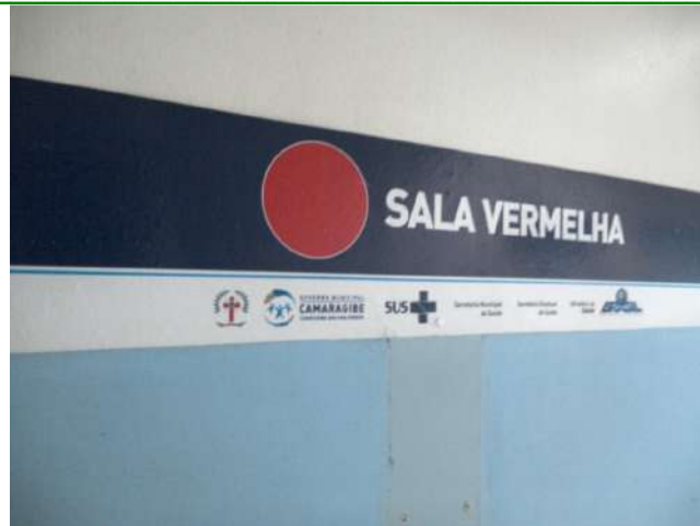
13.19. Sala vermelha 01