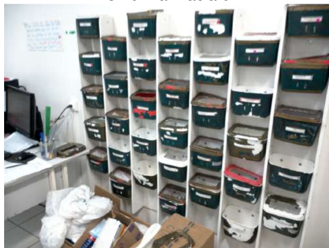
13.11. Farmácia 02