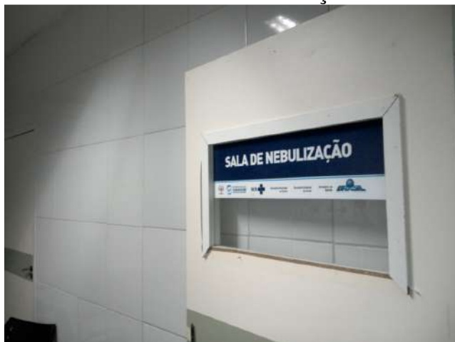
13.18. Sala de nebulização 03