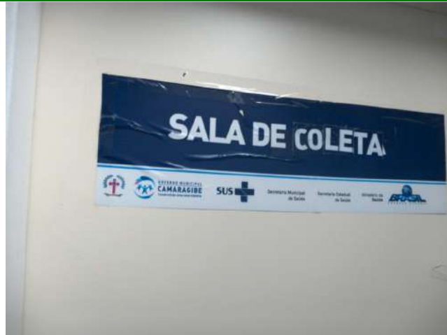
13.7. Sala de coleta de exames e de vacina 01