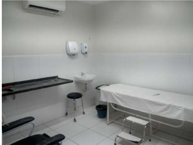
42.13. Sala de gesso