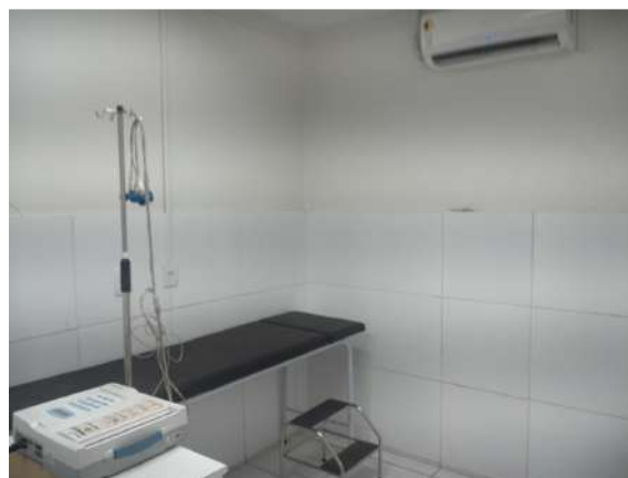
42.10. Sala de eletrocardiograma