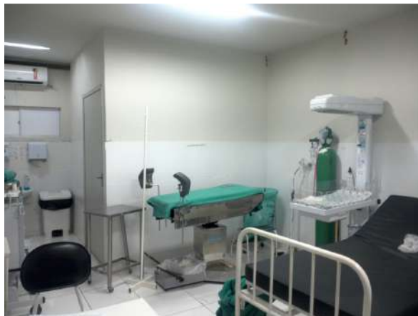
42.14. Sala de parto