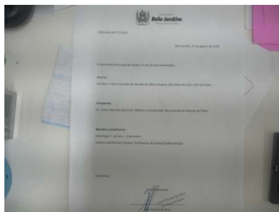
42.5. Portaria de nomeação da comissão de óbito