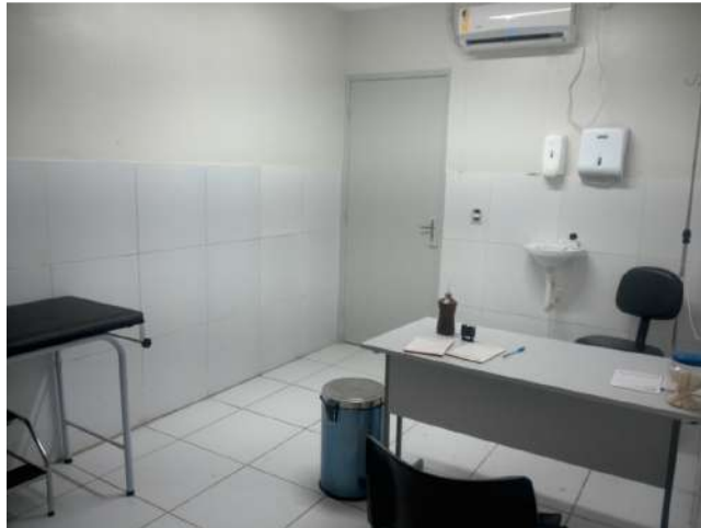
42.11. Consultório médico