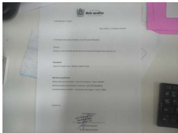
42.4. Portaria de nomeação da comissão de revisão de prontuário