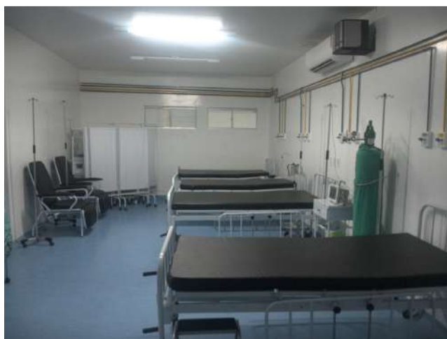
42.17. Sala de recuperação anestésica com 04 leitos e apenas 02 monitores