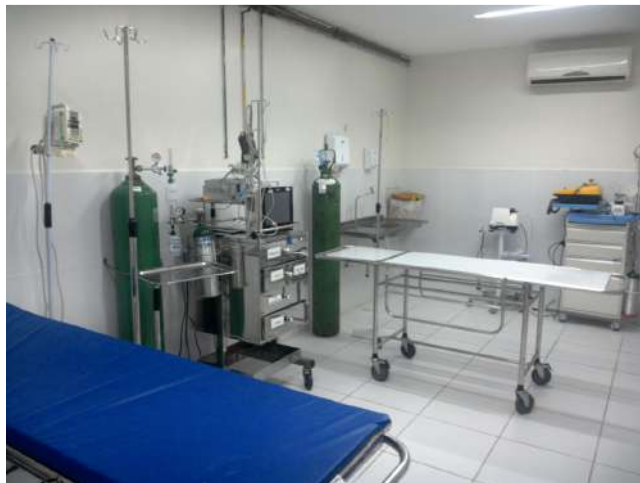
42.12. Sala vermelha