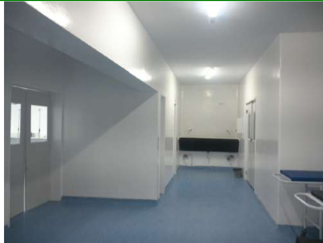
42.18. Bloco cirúrgico com 03 salas.