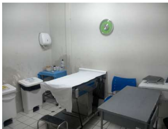
42.15. Triagem obstétrica