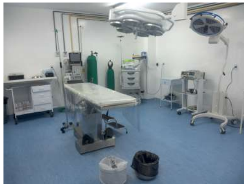
42.19. Sala cirúrgica