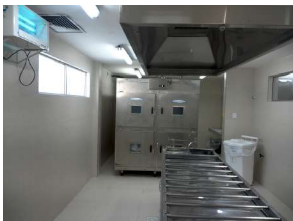
25.11. Sala de necrópsia de corpos putrefeitos