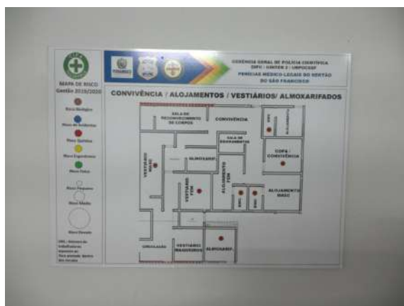
25.8. Mapa de risco