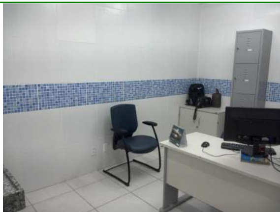
25.7. Sala de identificação de papiloscopia