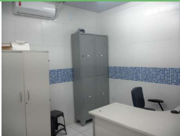
25.16. Sala de laudos