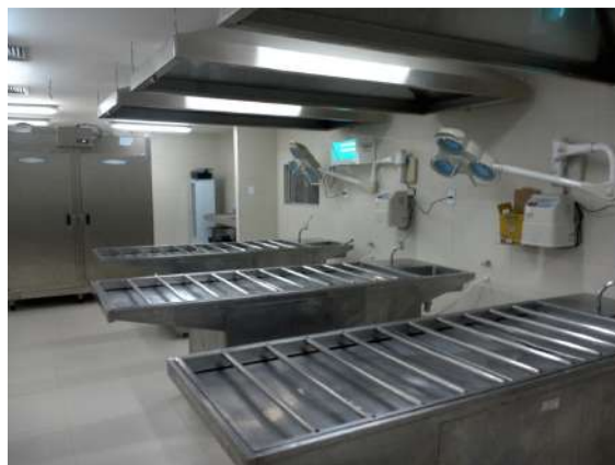
25.12. Sala de necrópsia de mortes recentes