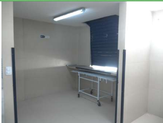
25.10. Entrada e saída de corpos