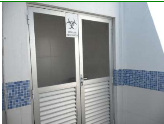
25.13. Local de armazenamento de resíduo infectante