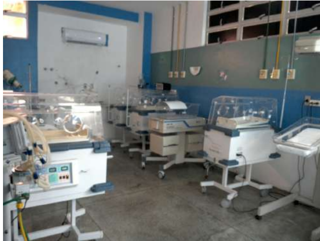
16.13. Unidade neonatal