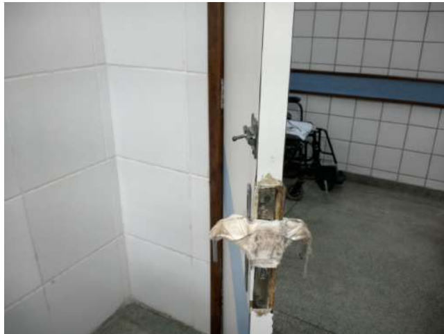
16.21. Porta com maçaneta quebrada. Há várias portas com maçanetas quebradas.