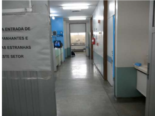
16.18. Centro cirúrgico - lavabos com torneiras manuais