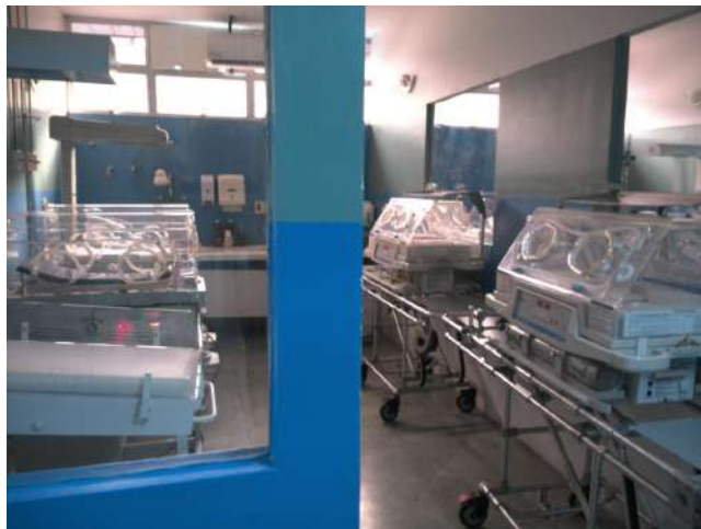
16.14. Unidade neonatal