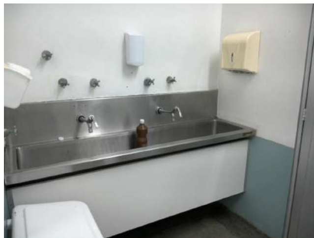
16.19. Lavabos com torneiras manuais