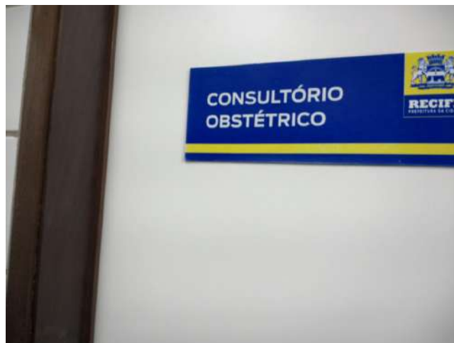
16.24. Consultório obstétrico - Emergência