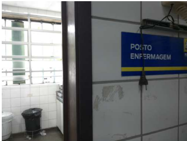
16.7. Posto de enfermagem - 1º andar