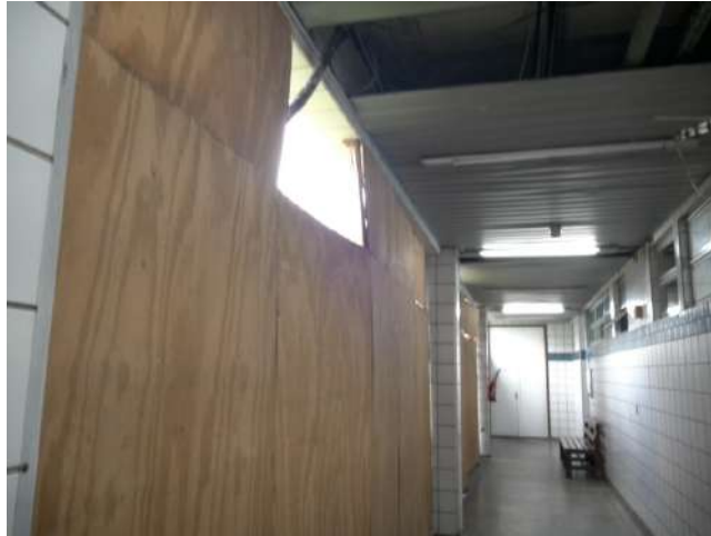
16.23. Estrutura física precária.