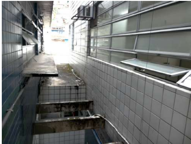
16.6. Vista do 1º andar - junto a gerência