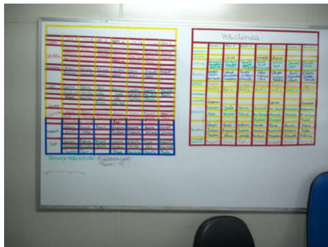
16.4. Quadro com escala de plantão na gerência