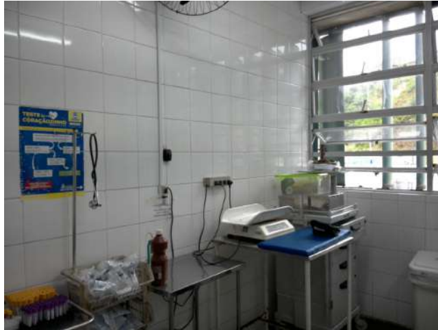
16.8. Posto de enfermagem - 1º andar