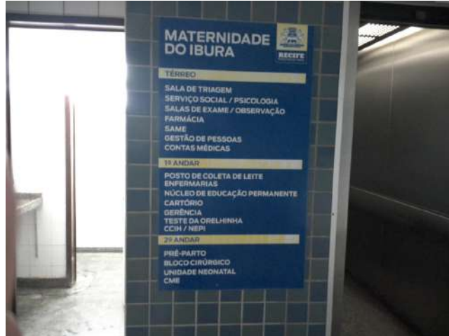
16.3. Placa de sinalização