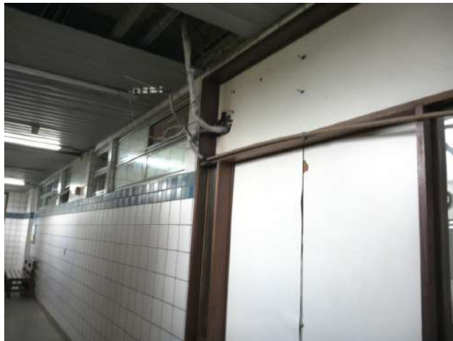
16.22. Estrutura física precária.