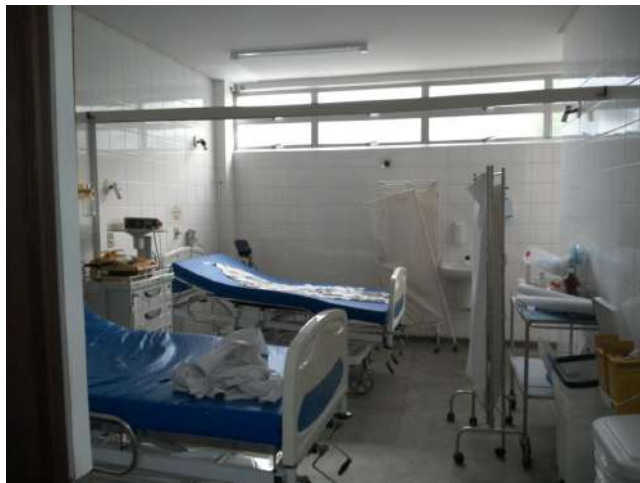
16.29. Sala vermelha