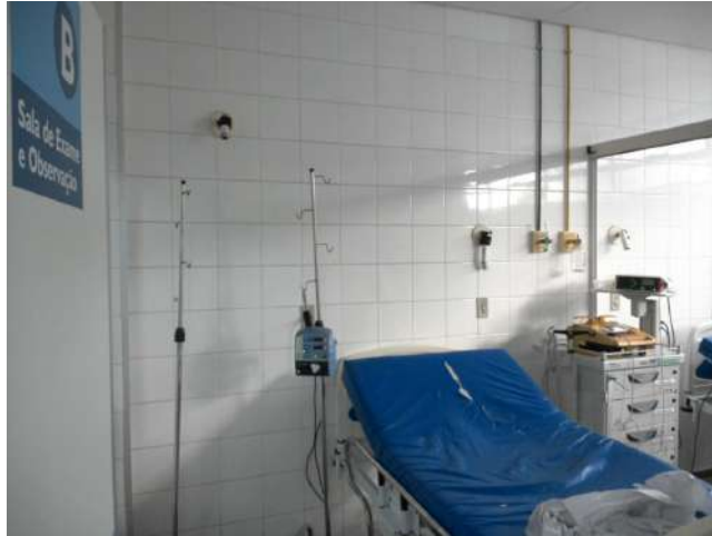
16.28. Sala vermelha