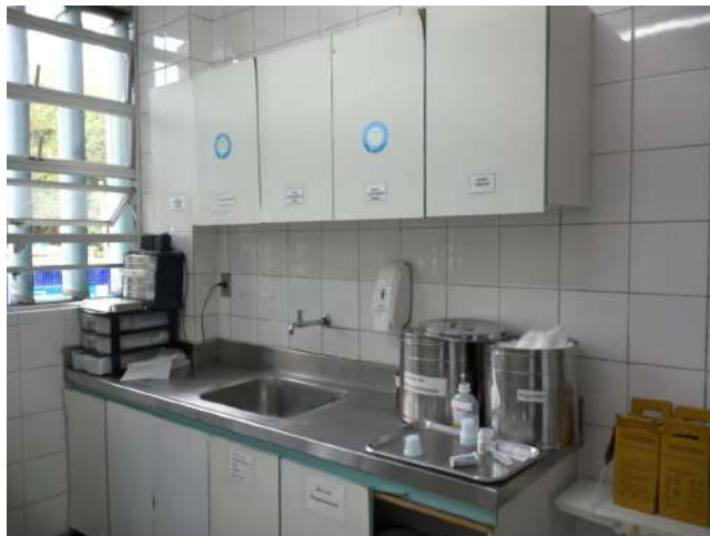
16.9. Posto de enfermagem - 1º andar