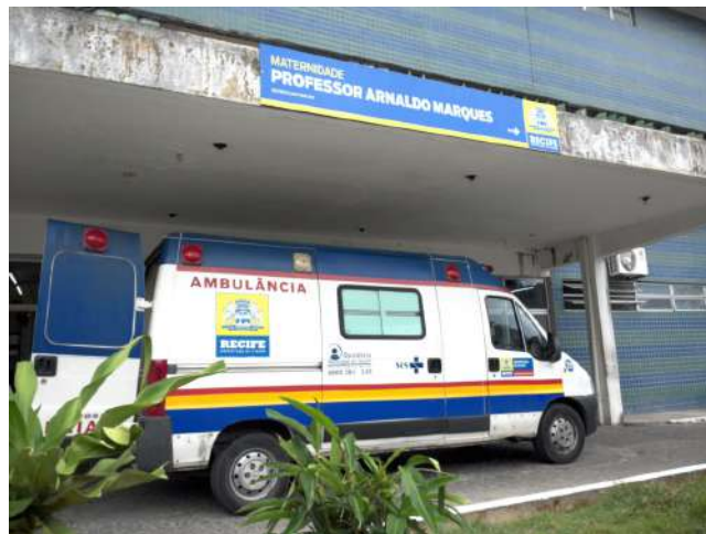
16.1. Entrada da Maternidade