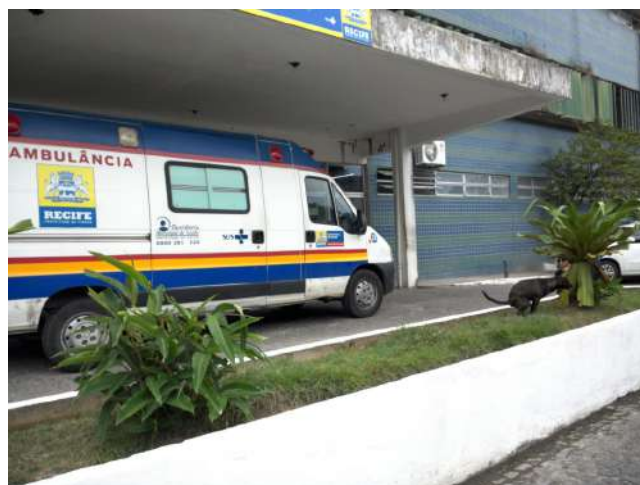
16.2. Presença de animais