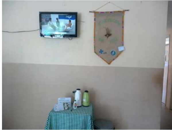
28.15. Cantinho do chá