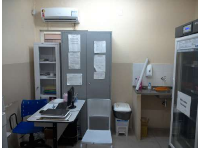
28.6. Sala de vacina