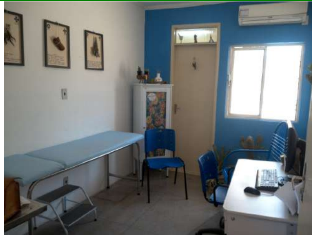
28.3. Consultório médico