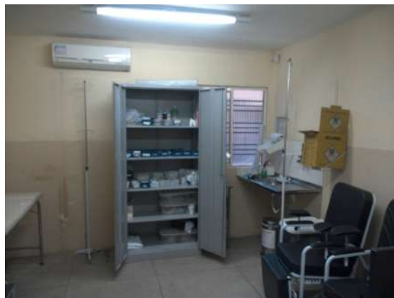
28.13. Sala de observação e medicação