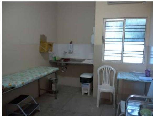
28.7. Sala de curativo