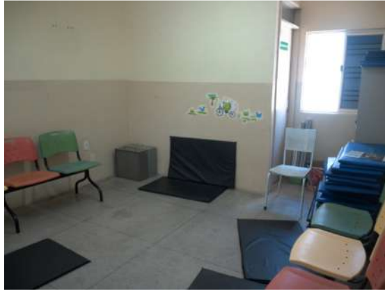
28.12. Sala de reunião