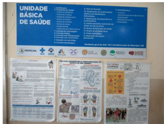
28.4. Serviços oferecidos