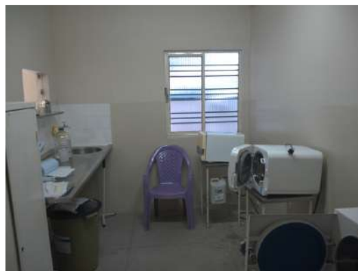
28.10. Sala de esterilização