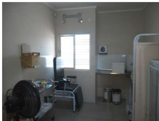
28.8. Sala de coleta de exames (sem climatização)