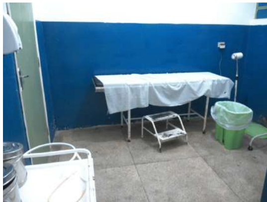
24.12. Sala de curativo