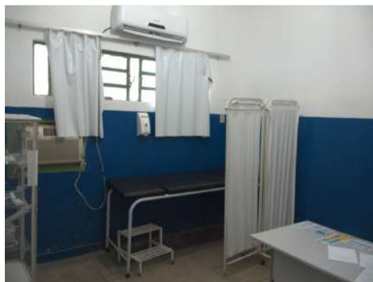
24.13. Consultório médico