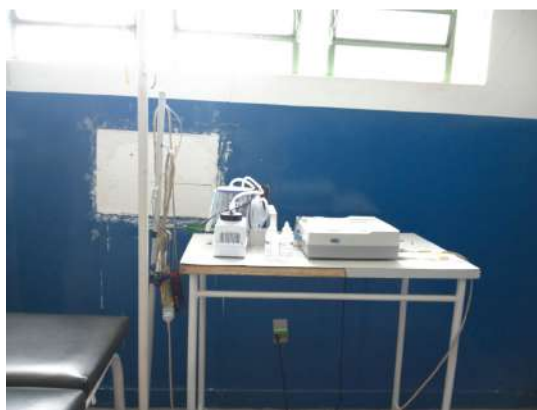
24.10. Únicos equipamentos da sala vermelha