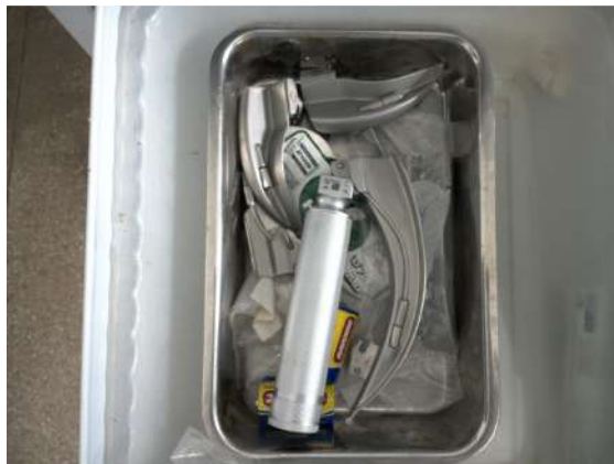
24.9. Único laringoscópio disponível (observar que as pilhas estavam fora)