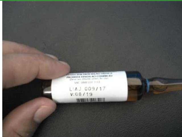
24.11. Dopamina vencida (agosto/2019) que se encontrava no carrinho de parada