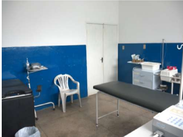
24.8. Ambiente comum para sala vermelha e realização do exame obstétrico