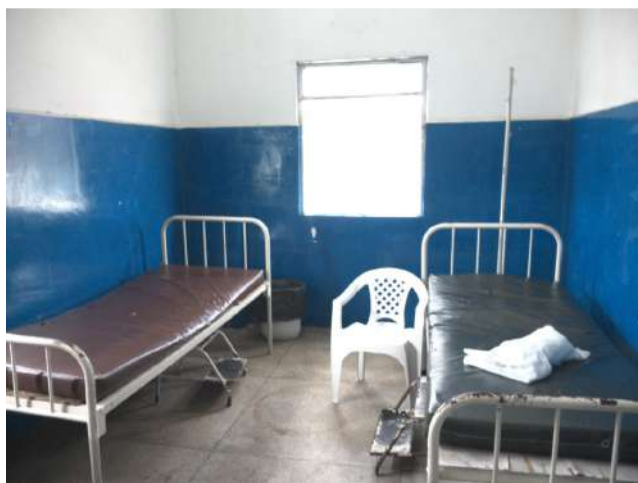
24.6. Sala de observação masculina