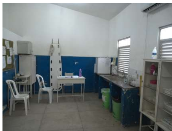
24.5. Ambiente comum onde funcionam: triagem da enfermagem, sala de medicação