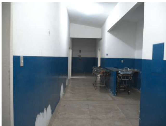
24.7. Enfermaria desativada há pelo menos sete anos