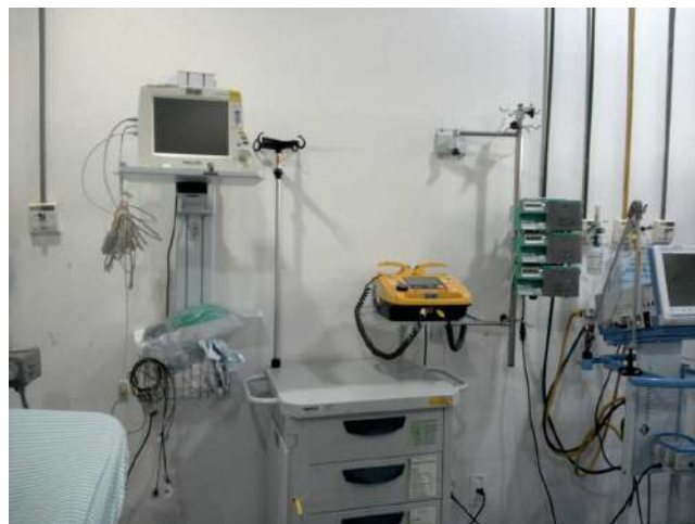
11.9. Sala vermelha - desfibrilador