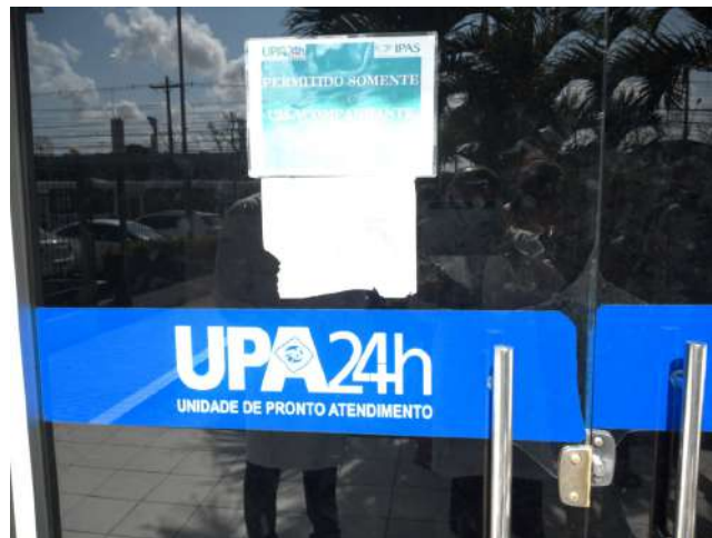
11.1. Porta de entrada da Unidade