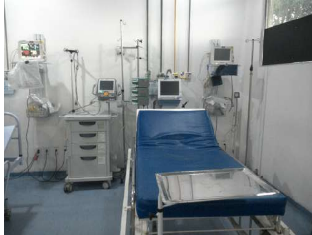
11.8. Sala vermelha