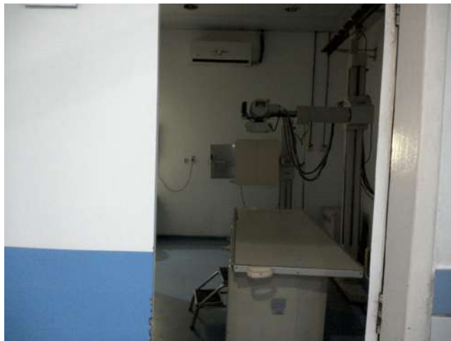
11.14. Sala de raios X