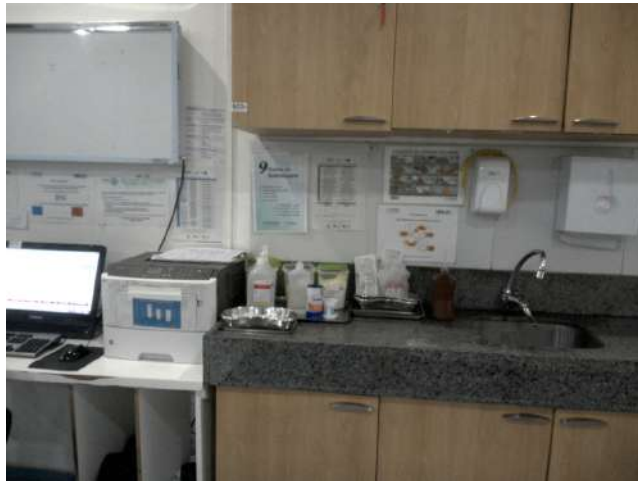
11.6. Posto de enfermagem da sala vermelha