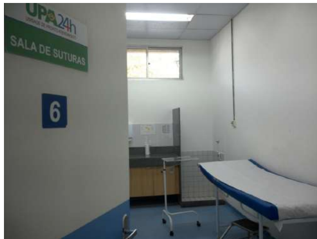
11.16. Sala de suturas