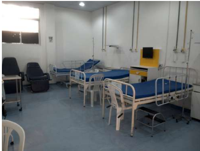
11.11. Sala de observação