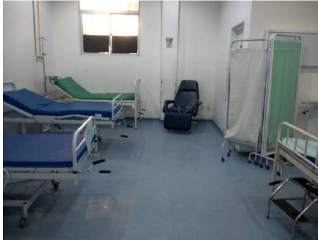
11.13. Sala de observação