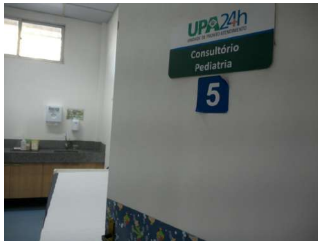
11.21. Consultório de pediatria