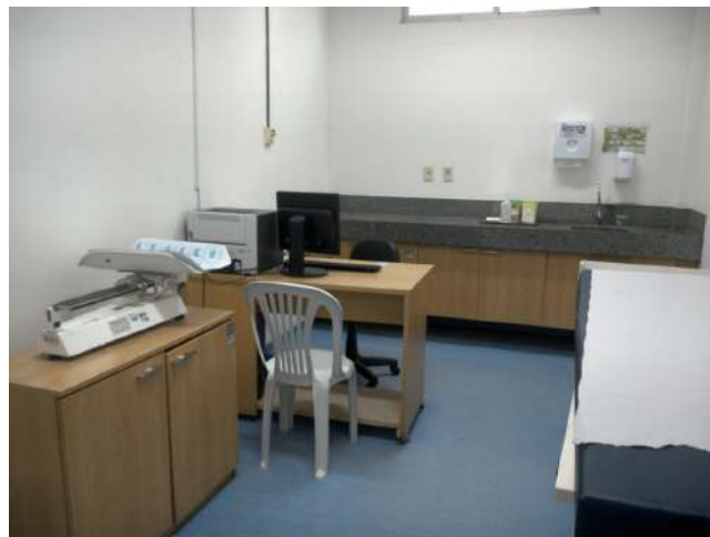
11.22. Consultório de pediatria