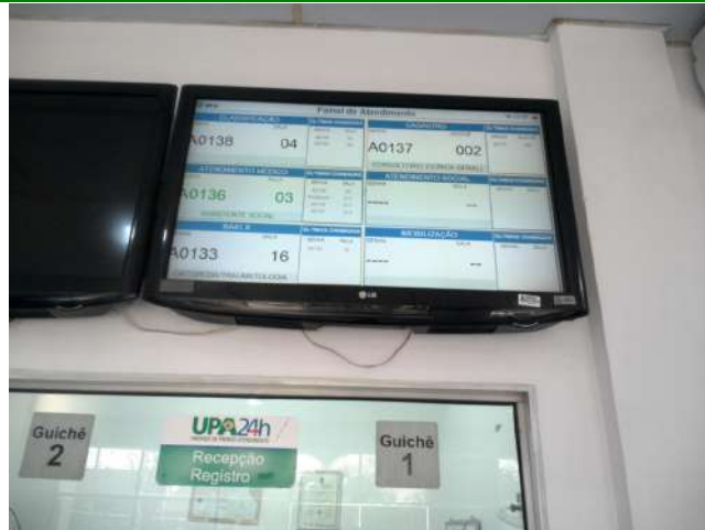
11.3. Painel de atendimentos