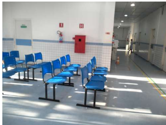
11.2. Recepção e corredor - praticamente sem pacientes