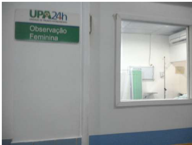
11.12. Sala de observação