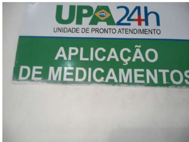
11.19. Aplicação de medicamentos