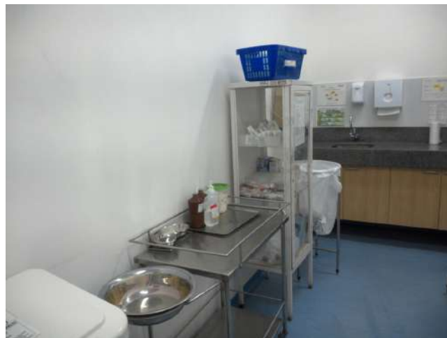
11.17. Sala de suturas