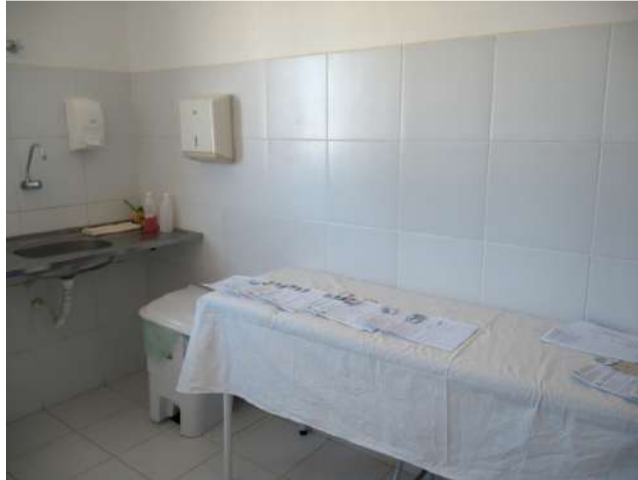
29.3. Sala de curativos