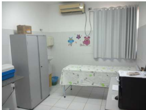
29.4. Sala de vacinas