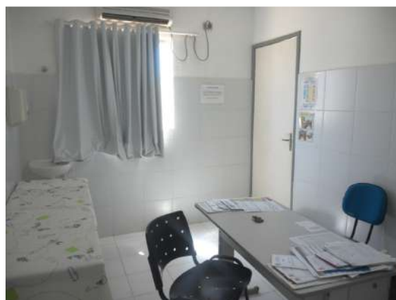
29.5. Consultório médico