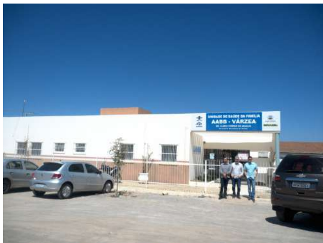
29.1. USF Várzea AABB