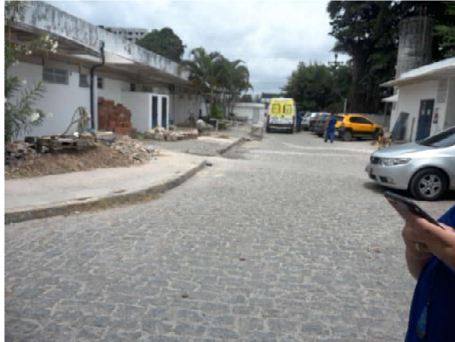
20.3. Reforma em pátio externo da unidade