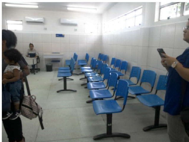
20.4. Sala de espera pediatria