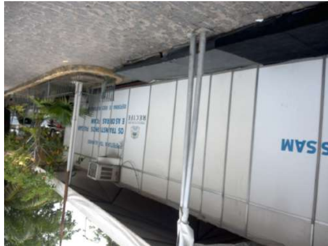
20.1. Ambulatório em estrutura provisória