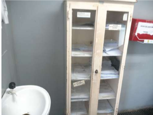
20.26. Consultório Traumatologia 03