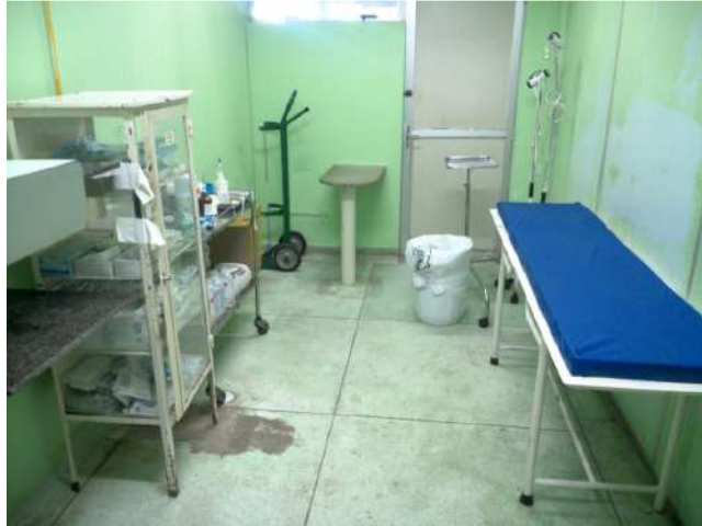
20.21. Sala de sutura 02