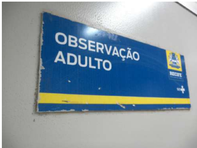
20.22. Observação adulto 01