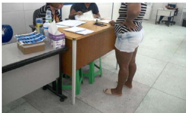
20.5. Recepção pediatria