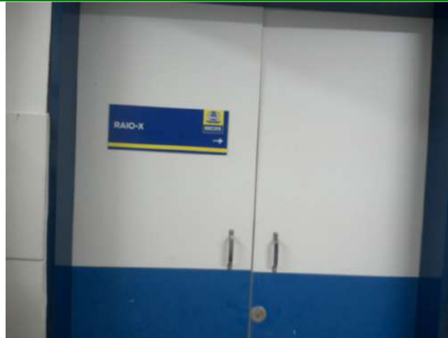
20.11. Sala de Raios-X