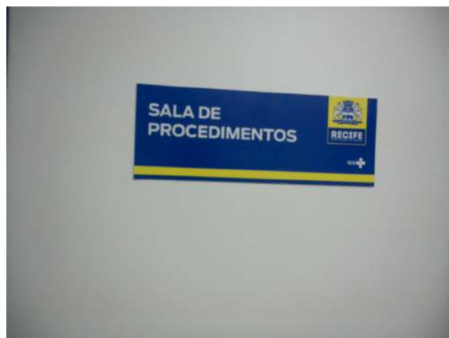
20.7. Sala de procedimentos da emergência