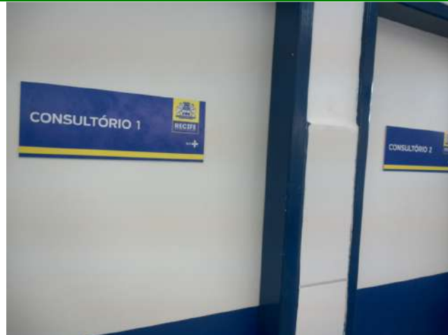
20.6. Consultórios emergência