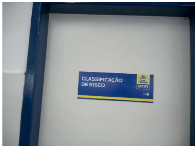
20.2. Sala de classificação da risco da emergência