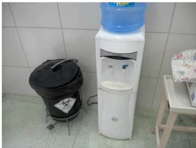
20.17. Gelágua da pediatria (observação)