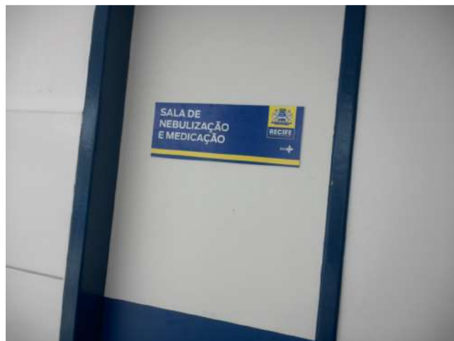
20.12. Sala de Nebulização