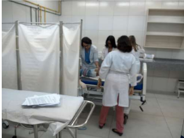
20.16. Sala vermelha da pediatria