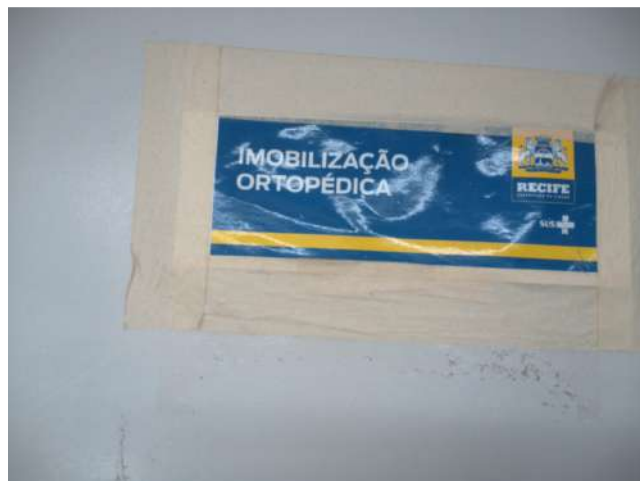
20.27. Sala de gesso adultos 01