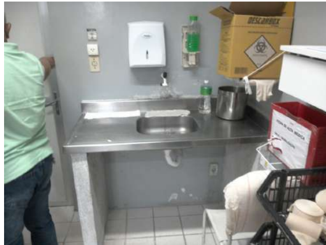
20.29. Sala de gesso adultos 03