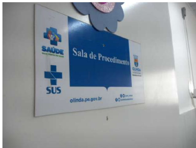
19.14. Sala de técnico de enfermagem no ambiente da sala de procedimentos