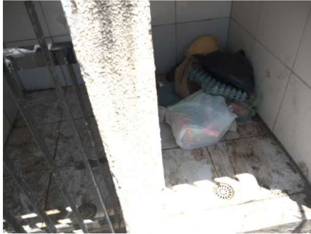
19.8. Lixo mal acondicionado