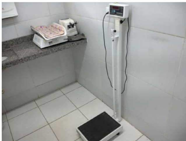
19.4. Sala de procedimentos ou sala de curativos com balança quebrada