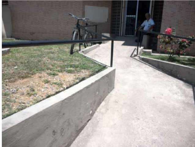
19.13. Rampa de acesso à unidade no sol, sem proteção para a população