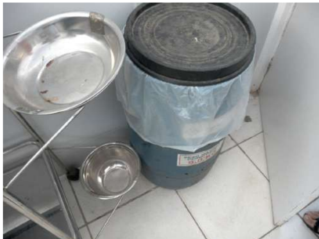
19.9. Tabor de lixo