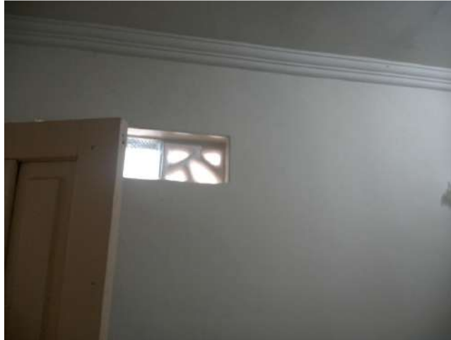
16.15. Farmácia 04 - combogó