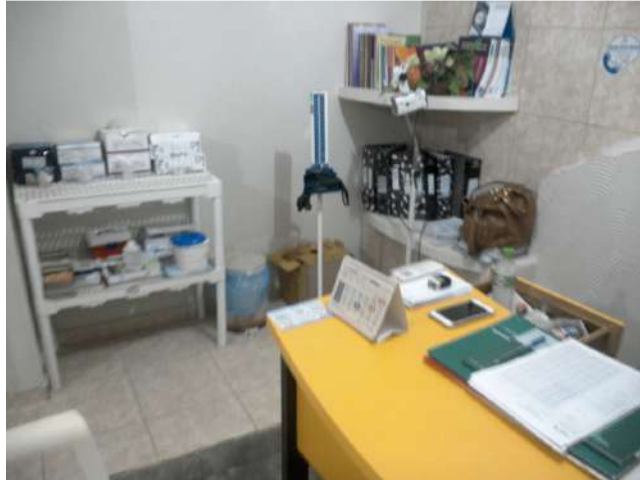
16.25. Sala de Enfermagem 03