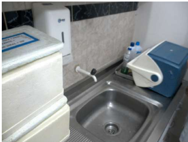
16.16. Sala de vacina 03