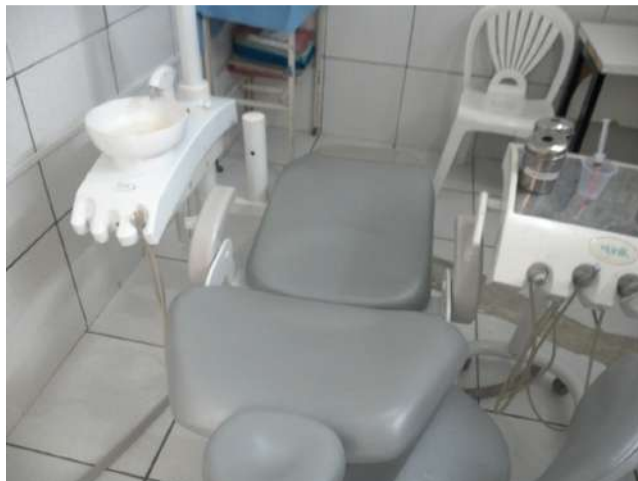
16.21. Consultório odontológico