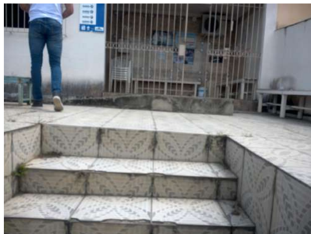
16.6. Escada de acesso à unidade