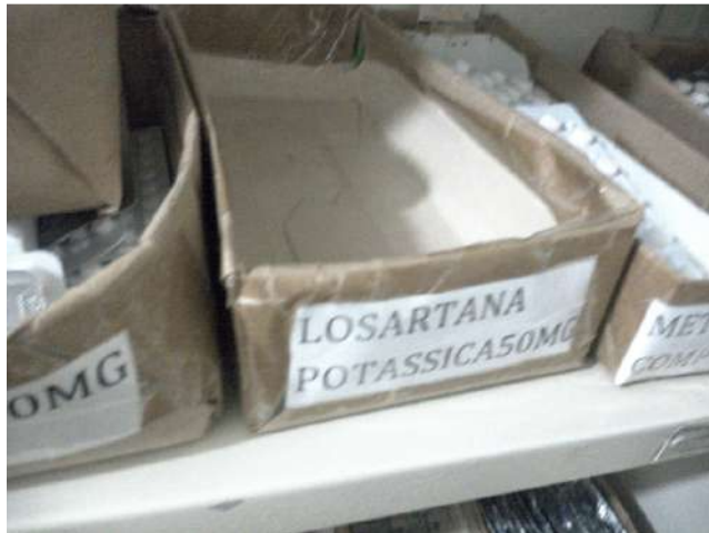
16.19. Farmácia 05 - Falta losartana