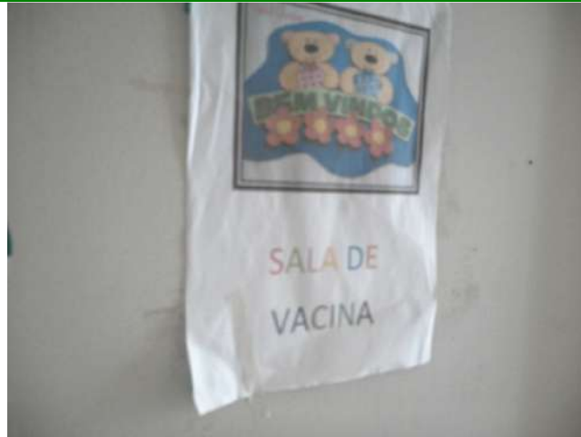
16.10. Sala de vacina 01 fechada