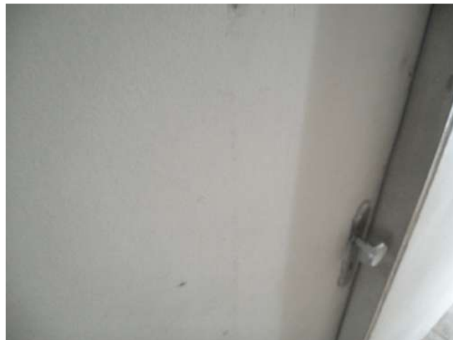
16.11. Sala de vacina 02