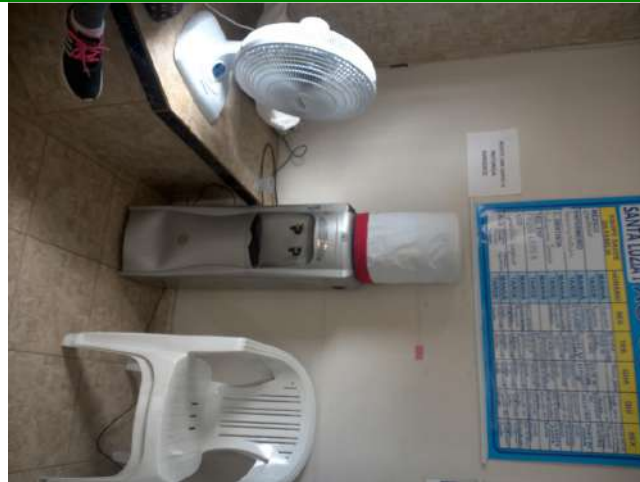
16.5. Sala de espera 02 com gelágua