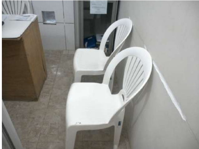
16.18. Sala de vacina 06