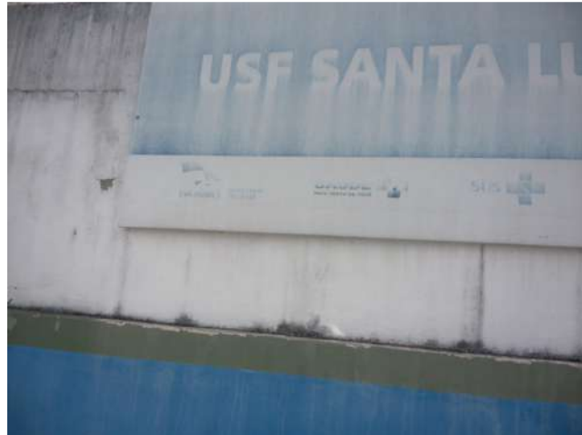
16.1. Fachada 01