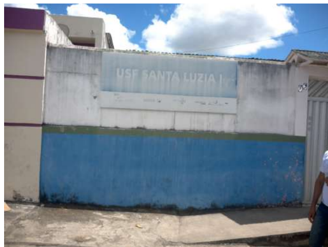
16.2. Fachada 02