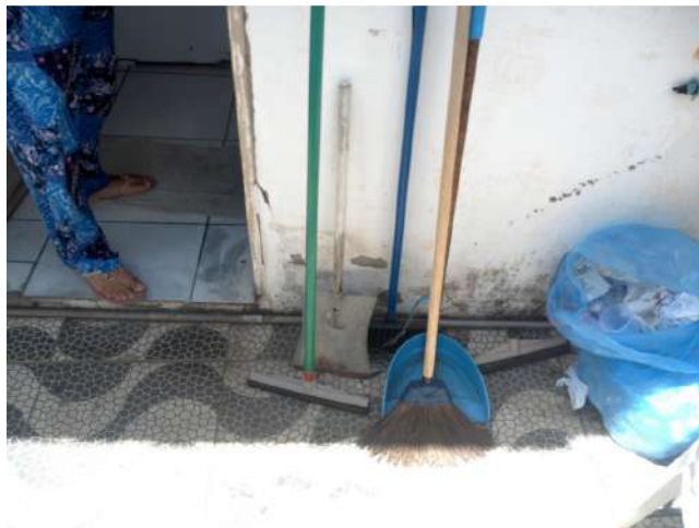
16.26. Vassouras, panos de chão, baldes plásticos