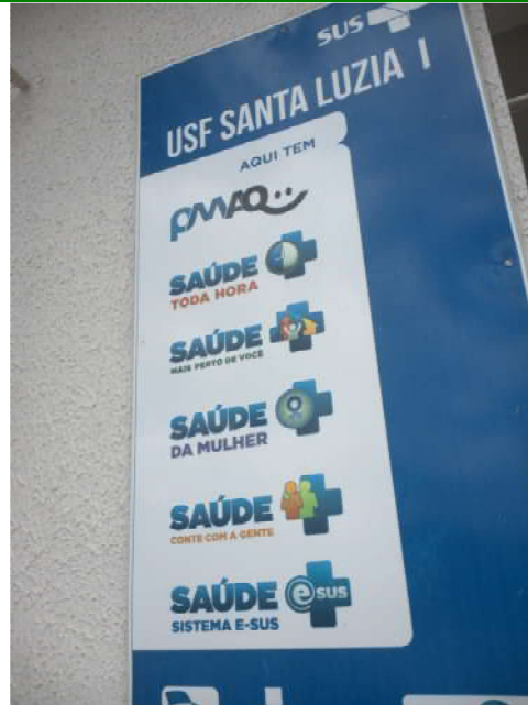
16.3. Fachada 03