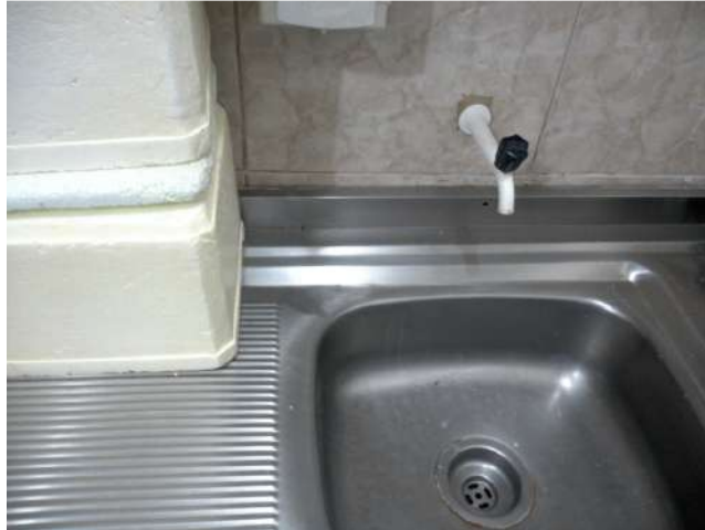
16.20. Sala de vacina 04