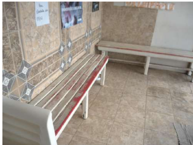
16.4. Sala de espera 01 na varanda do imóvel