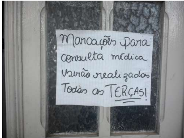
19.1. Recepção / sala de espera