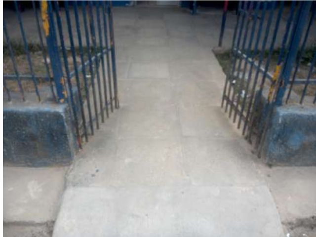
19.3. Fachada 02