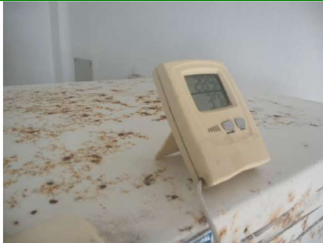
19.13. Refrigerador para vacinas, munido de termômetro externo específico