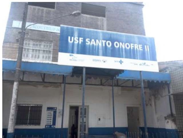
19.2. Fachada 01