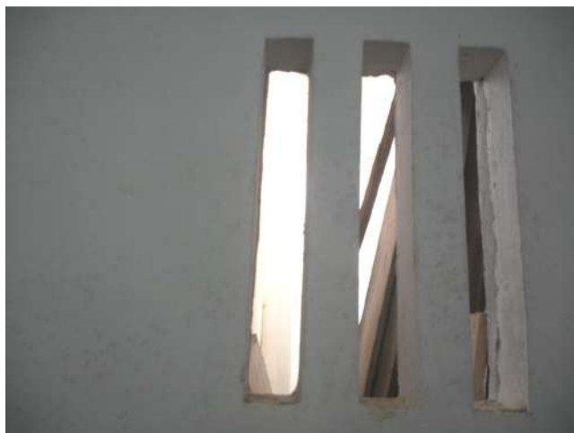
19.14. Ambiente climatizado