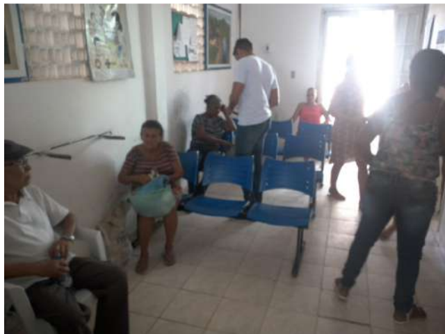
19.4. Recepção / sala de espera