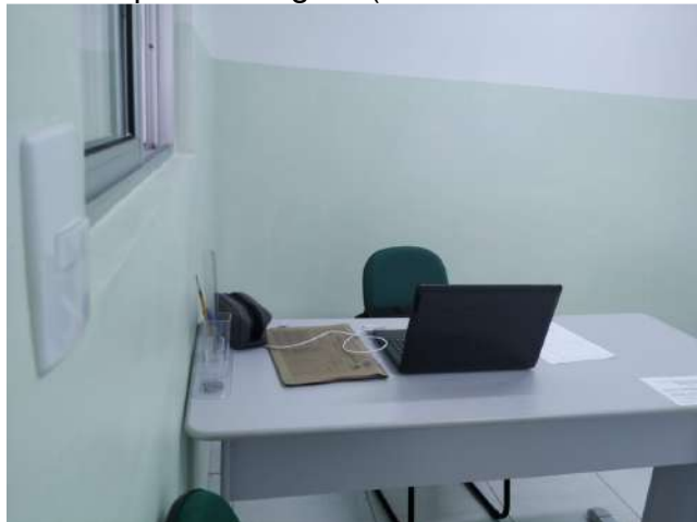
27.5. Ponto de Apoio - Triagem (Pré-consulta enfermagem) 03