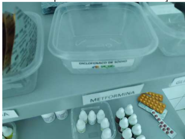
27.36. Ponto de Apoio - Farmácia 03 - Falta diclofenaco