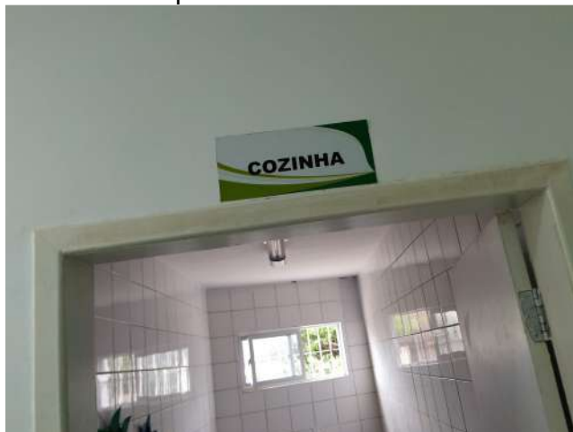
27.38. Ponto de Apoio - Cozinha 01