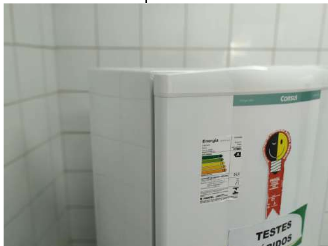
27.15. Ponto de Apoio - Sala de Vacina 03 - testes rápidos