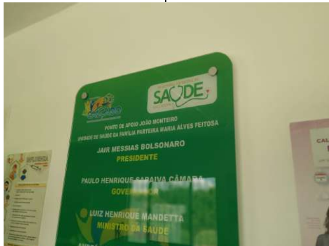
27.2. Ponto de Apoio - Fachada 02