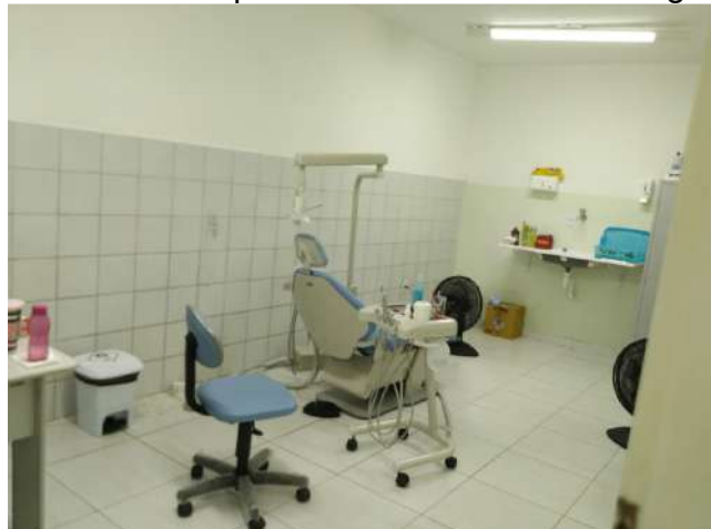
27.33. Ponto de Apoio - Consultório Odontológico 02