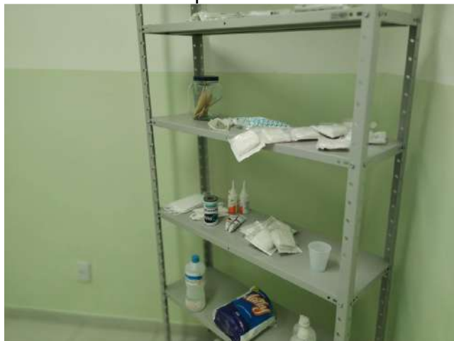
27.11. Ponto de Apoio - Sala de curativo 05