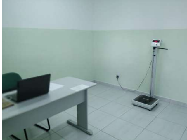
27.4. Ponto de Apoio - Triagem (Pré-consulta enfermagem) 02