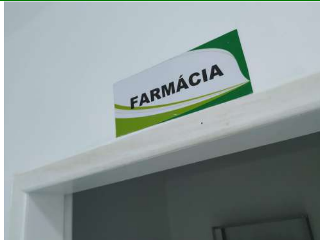
27.34. Ponto de Apoio - Farmácia 01