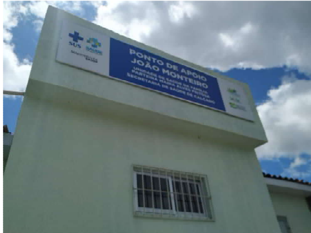
27.1. Ponto de Apoio - Fachada 01