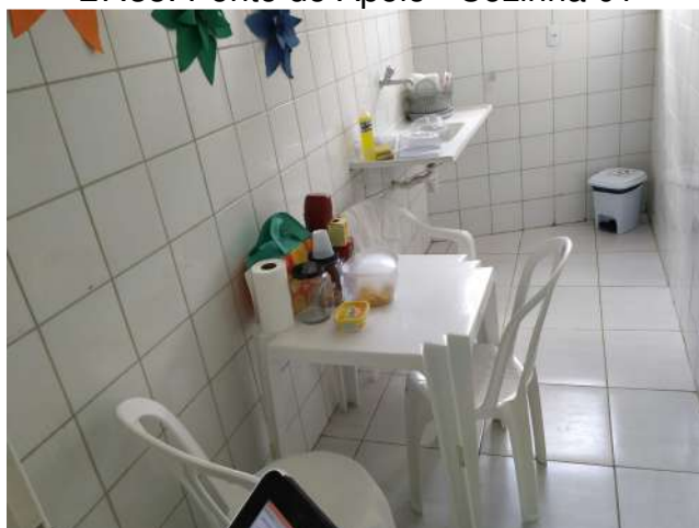
27.39. Ponto de Apoio - Cozinha 02