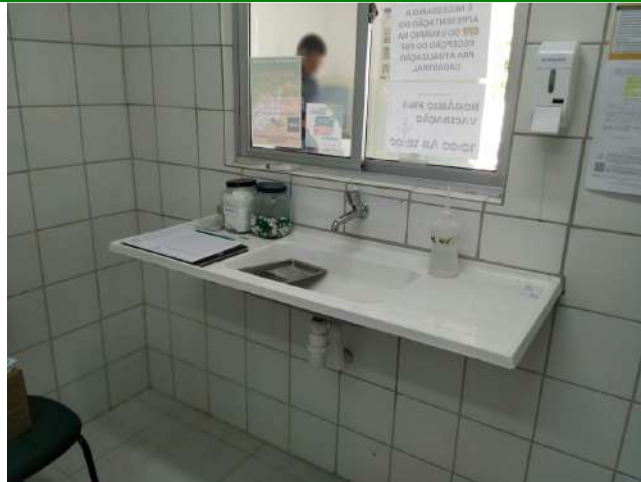
27.16. Ponto de Apoio - Sala de Vacina 05 - bancada