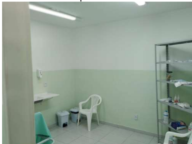
27.8. Ponto de Apoio - Sala de curativo 02