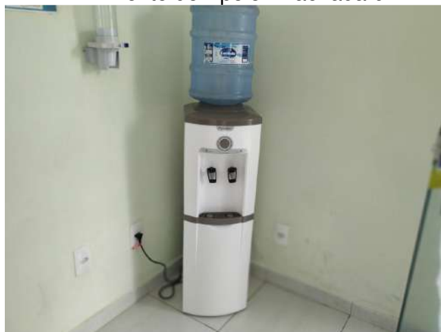
27.3. Ponto de Apoio - Recepção com Água