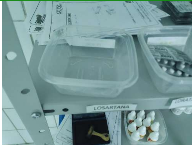
27.37. Ponto de Apoio - Farmácia 04 - Falta Losartana