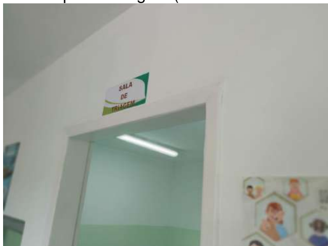
27.6. Ponto de Apoio - Triagem (Pré-consulta enfermagem) 01