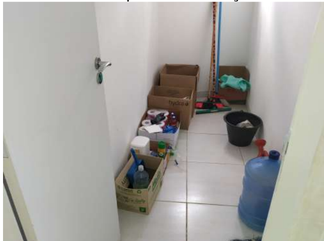
27.41. Ponto de Apoio - DML sem armário ou estante