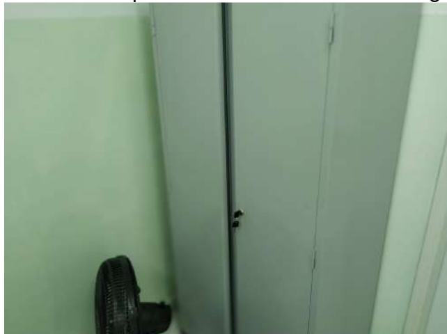
27.24. Ponto de Apoio - Consultório de Enfermagem 05 - armário com chave