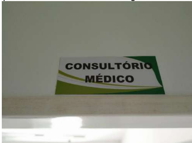
27.26. Ponto de Apoio - Consultório Médico 01