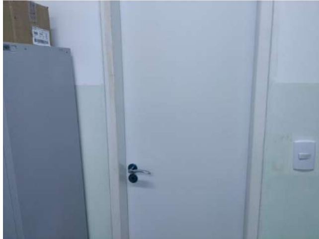
27.25. Ponto de Apoio - Consultório de Enfermagem 06 - Banheiro para usuárias