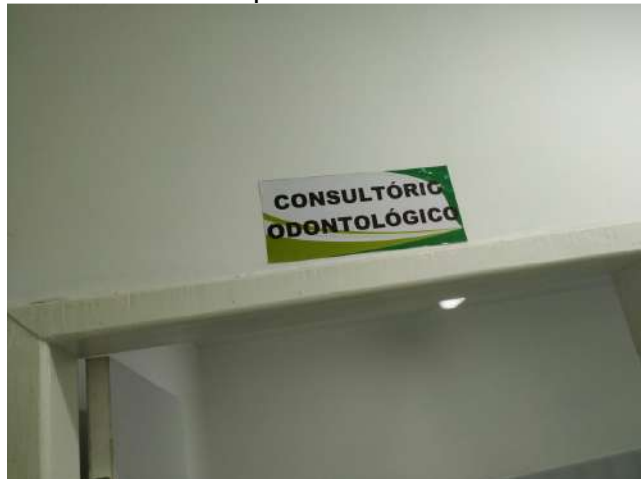
27.32. Ponto de Apoio - Consultório Odontológico 01