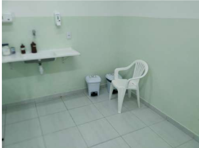
27.10. Ponto de Apoio - Sala de curativo 04