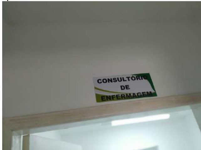
27.20. Ponto de Apoio - Consultório de Enfermagem 01