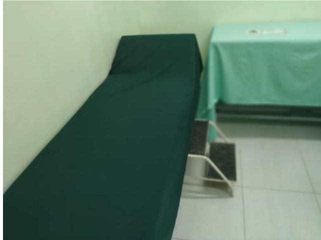
27.22. Ponto de Apoio - Consultório de Enfermagem 03