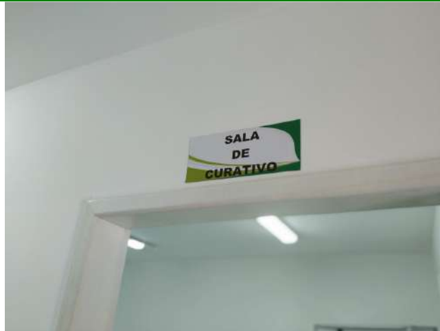
27.7. Ponto de Apoio - Sala de curativo 01