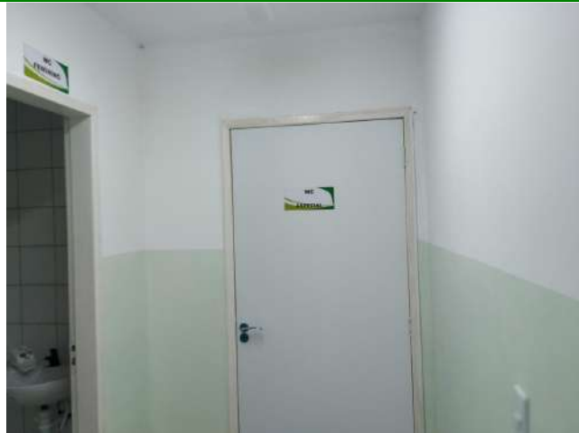
27.19. Ponto de Apoio - banheiros Para Portadores de Necessidades Especiais