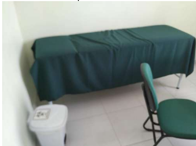
27.29. Ponto de Apoio - Consultório Médico 04