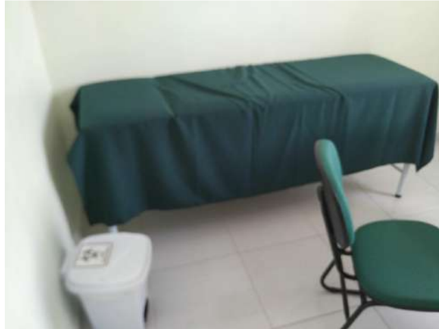
27.28. Ponto de Apoio - Consultório Médico 03