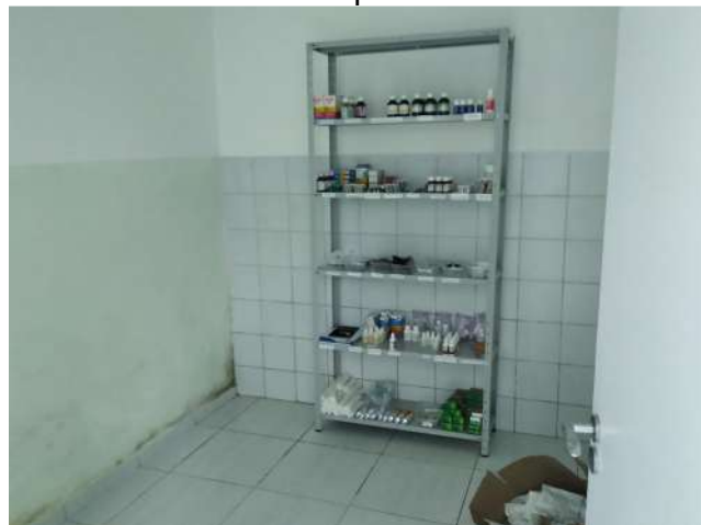
27.35. Ponto de Apoio - Farmácia 02 - infiltração e mofo