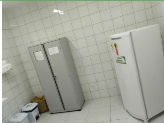
27.13. Ponto de Apoio - Sala de Vacina 02