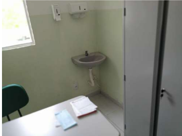
27.31. Ponto de Apoio - Consultório Médico 06