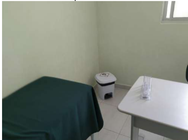
27.30. Ponto de Apoio - Consultório Médico 05