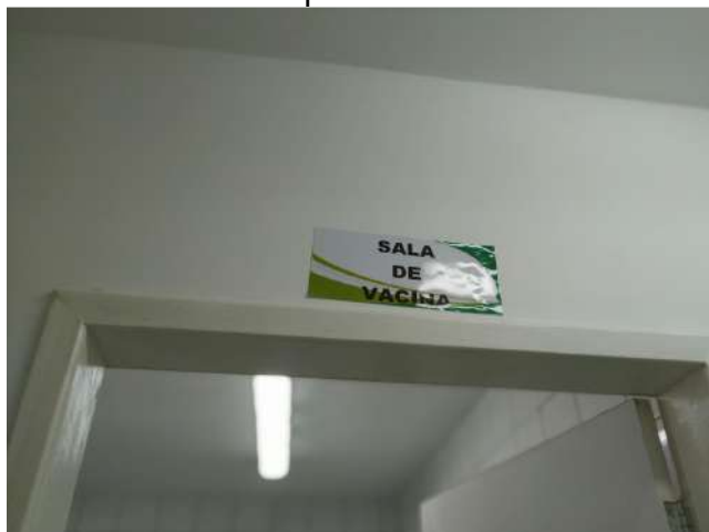
27.12. Ponto de Apoio - Sala de Vacina 01