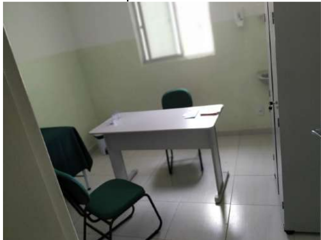
27.27. Ponto de Apoio - Consultório Médico 02