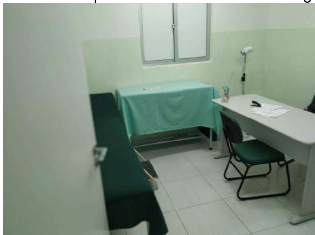
27.21. Ponto de Apoio - Consultório de Enfermagem 02