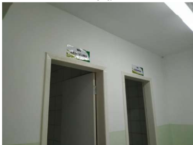
27.18. Ponto de Apoio - banheiros usuários