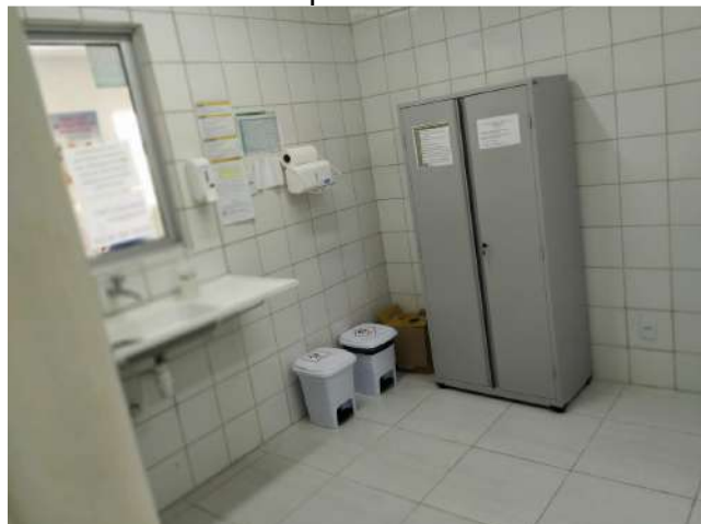
27.14. Ponto de Apoio - Sala de Vacina 03