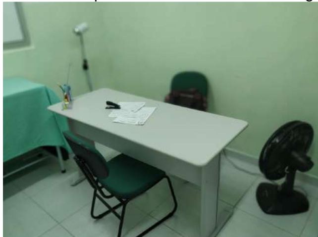
27.23. Ponto de Apoio - Consultório de Enfermagem 04