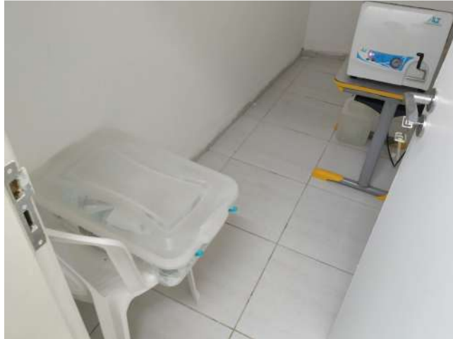
27.40. Ponto de Apoio -Esterilização sem fluxo