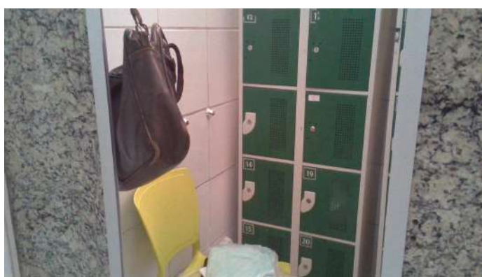
13.6. Vestiário do centro cirúrgico. Armários pequenos - não cabem as bolsas! Conta com apenas uma cadeira e há grande fluxo de pessoas.