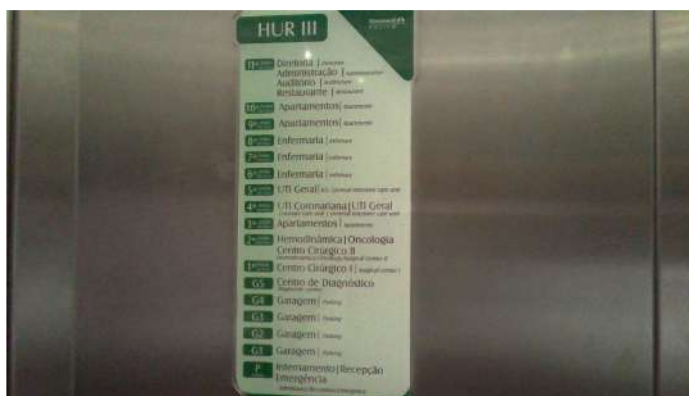
13.1. Placa de sinalização