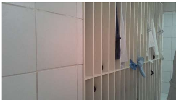
13.5. Vestiário do centro cirúrgico