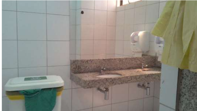
13.7. Vestiário do centro cirúrgico