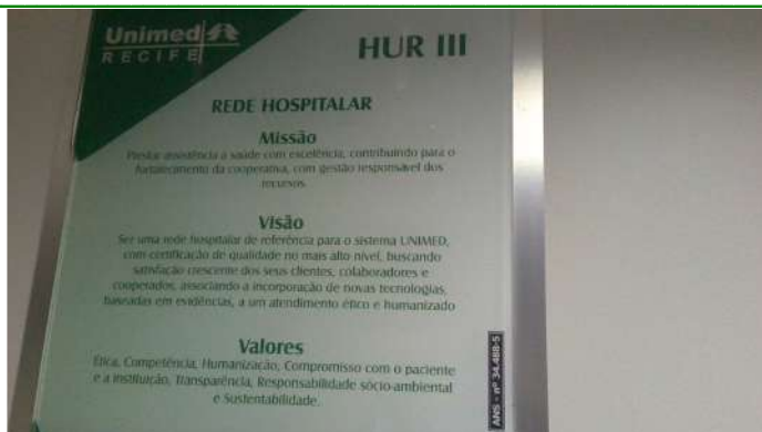
13.4. Placa de sinalização