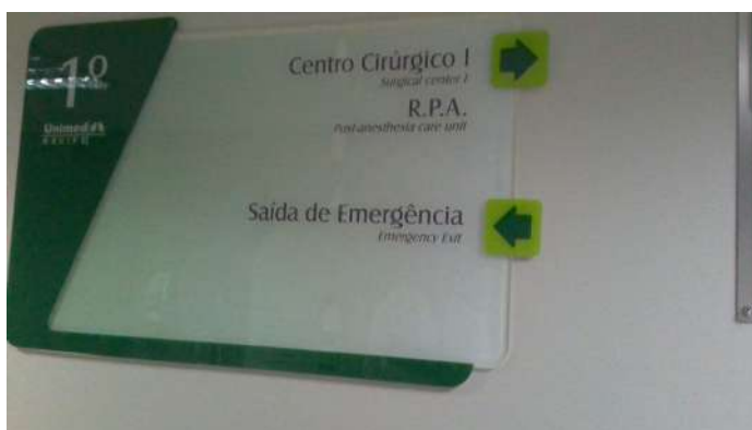
13.2. Placa de sinalização