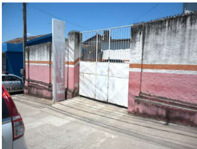
3.1. SAMU - Fachada