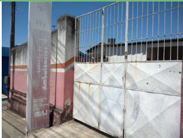
3.3. Visão geral na frente do SAMU