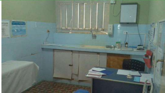
25.4. Consultório médico