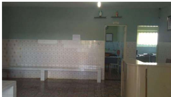
25.3. Recepção e sala de espera