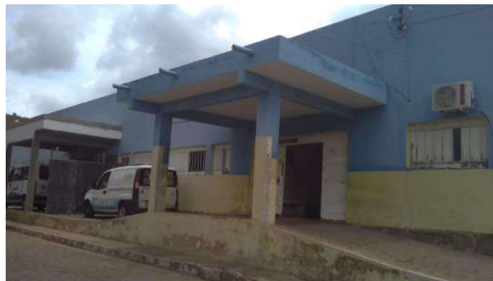
25.2. Unidade Mista Felinto Wanderley