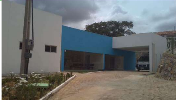
25.7. Nova sede do hospital