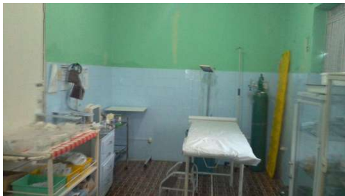
25.5. Ambiente único onde funcionam: sala vermelha, sala de medicação, sala de procedimento