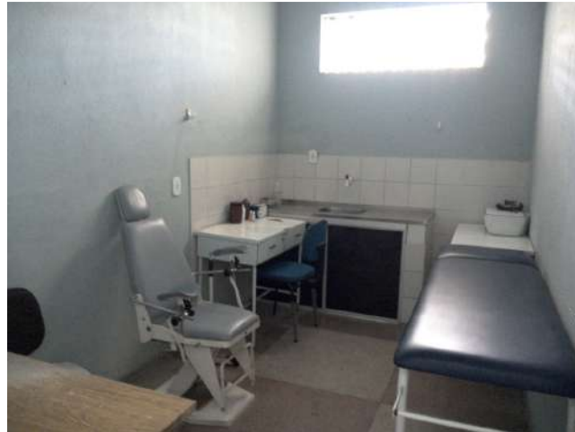
32.1. Sala de coleta