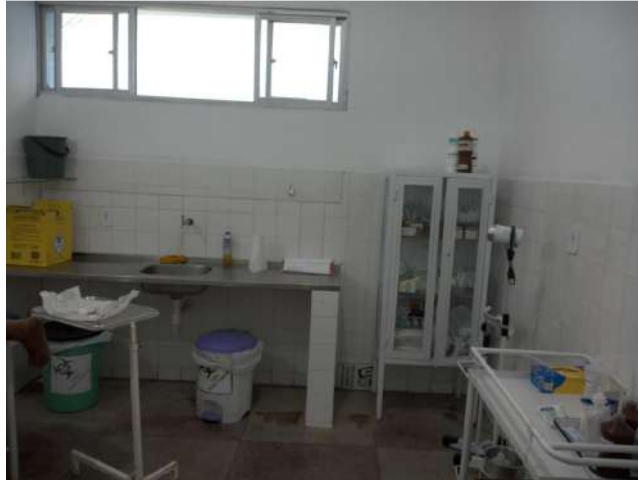
32.3. Sala de curativo