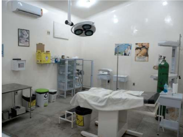
32.8. Sala de parto normal