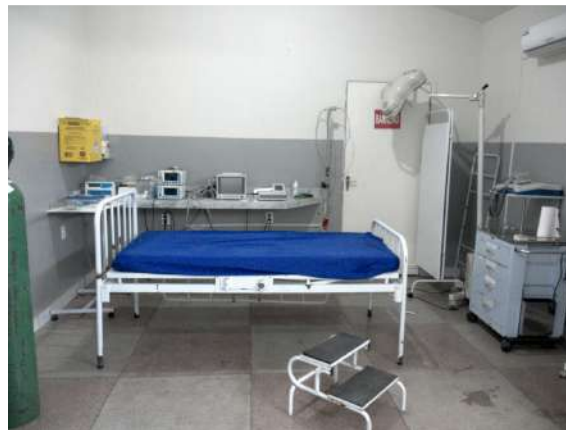
32.4. Sala vermelha