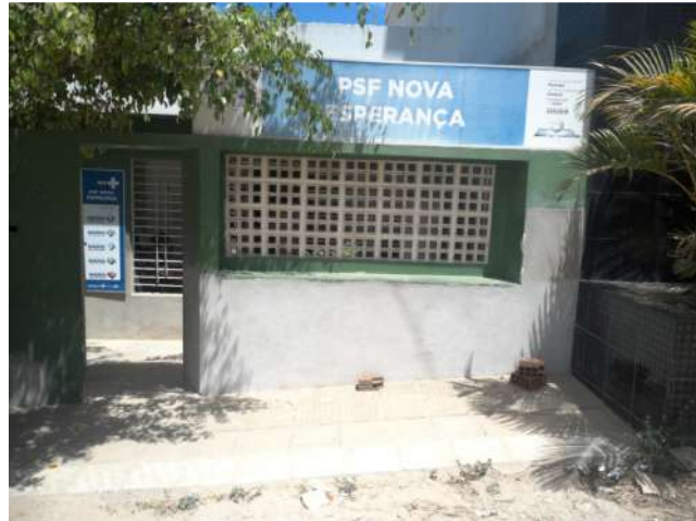
22.1. USF NOVA ESPERANÇA