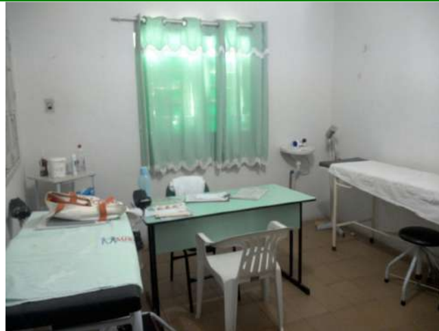
22.3. Sala de enfermagem