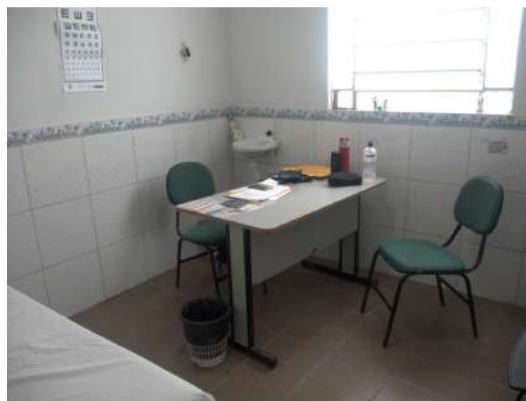
22.4. Consultório médico