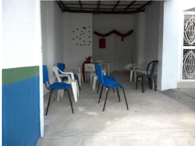
23.3. Ambiente com cadeiras - sala de espera