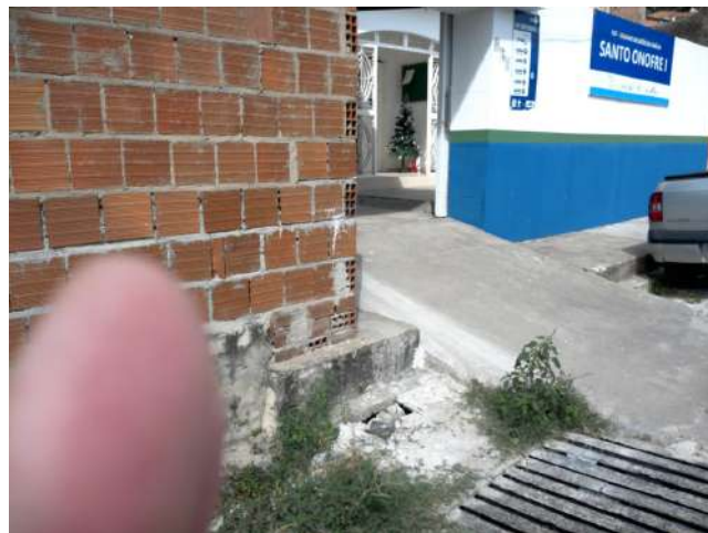
23.2. Entrada da Unidade