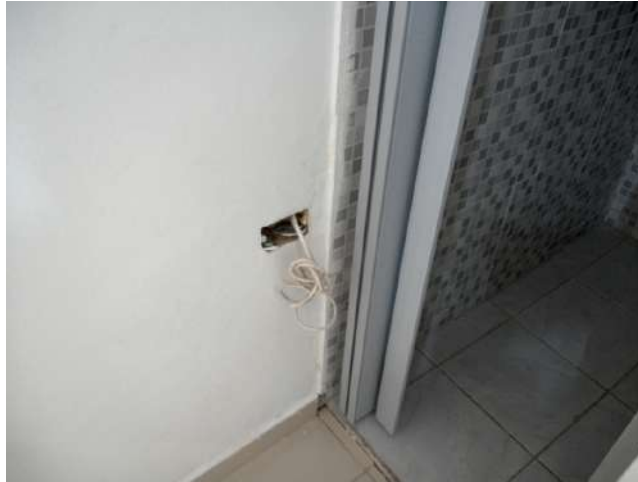
23.18. Consultório da enfermeira