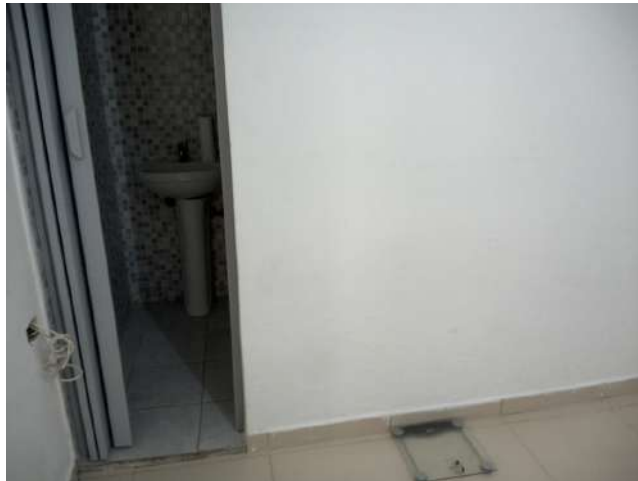
23.16. Consultório da enfermeira