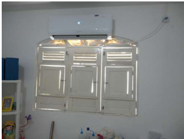
23.19. Consultório da enfermeira