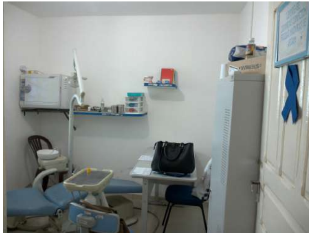
23.21. Sala da odontologia