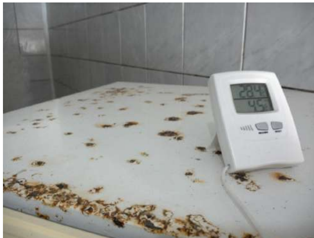
23.29. Sala de vacinas