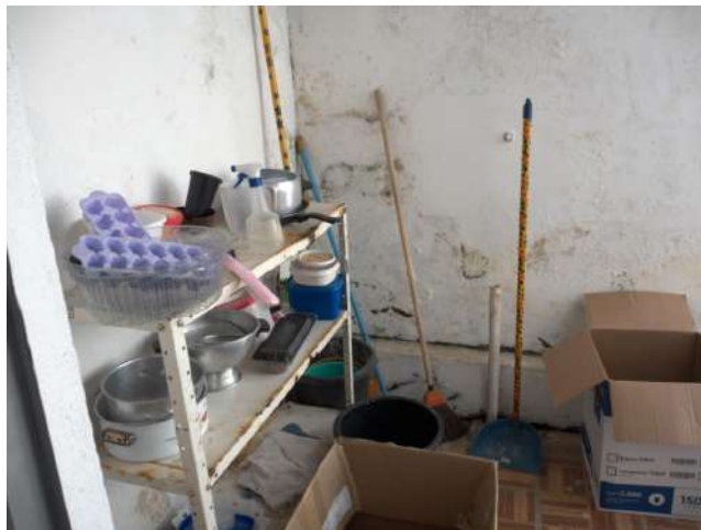
23.24. DML - Depósito de material de limpeza