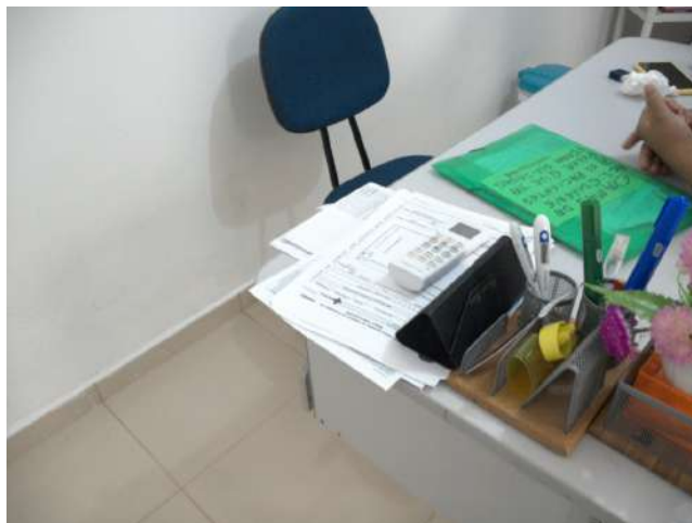
23.17. Consultório da enfermeira