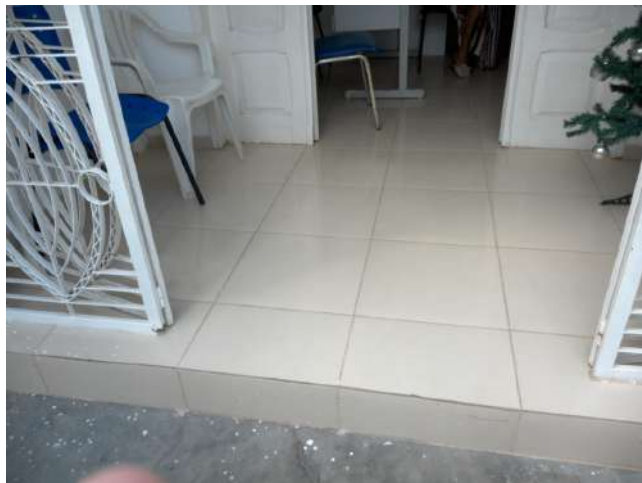
23.4. Degrau na entrada da Unidade