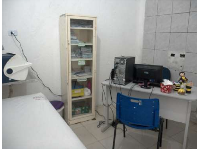
23.28. Sala de vacinas