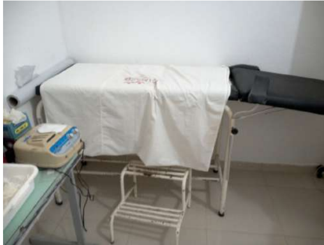
23.13. Consultório da enfermeira