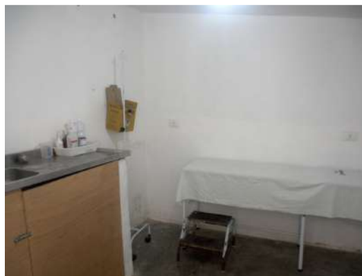
23.7. Sala de curativos