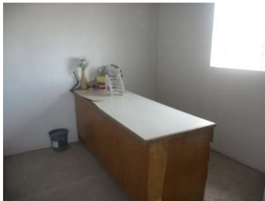
23.10. Sala dos ACS