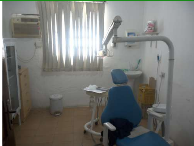
23.6. Consultório odontológico