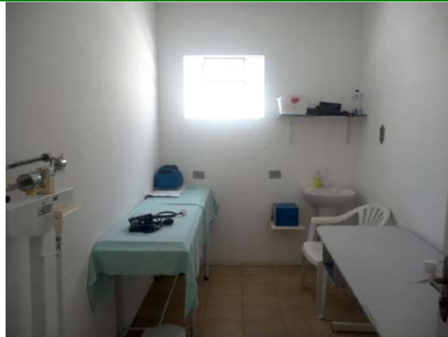
23.3. Sala de pré-consulta