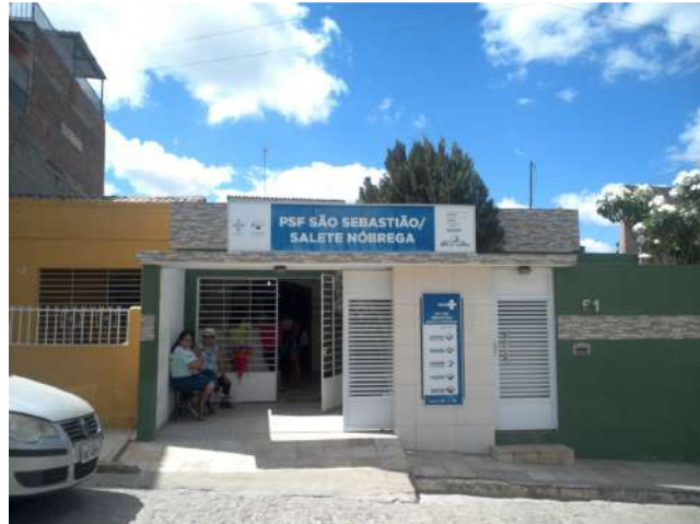
23.1. USF SÃO SEBASTIÃO