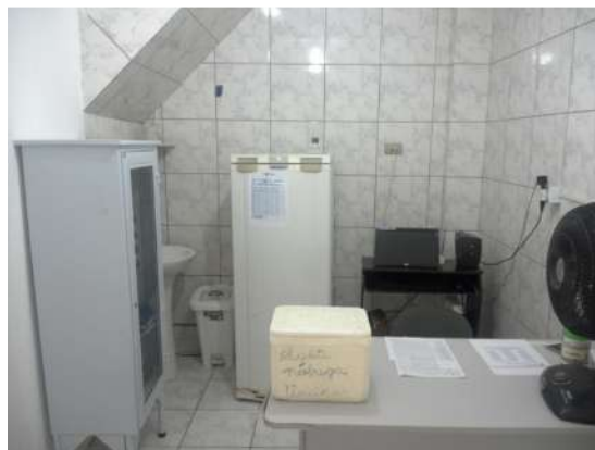
23.5. Sala de vacinas