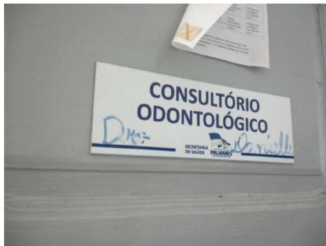
19.9. Consultório odontológico