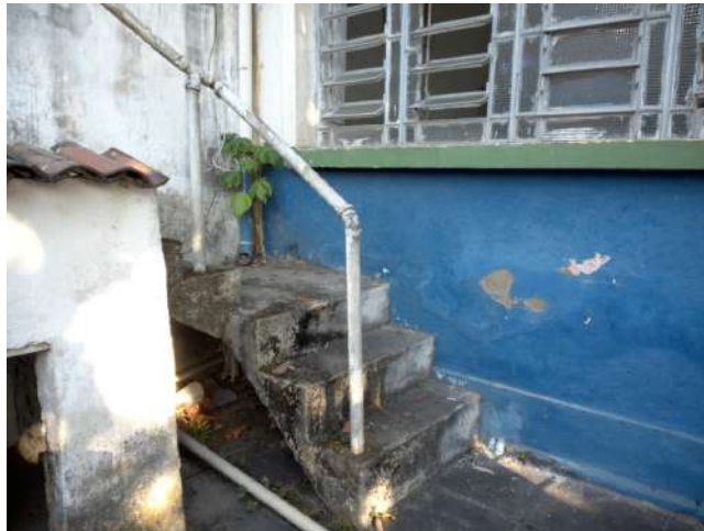
19.41. Área externa