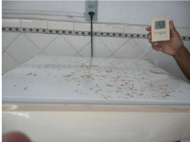
19.23. Sala de vacinas - Geladeira com termômetro e sinais de ferrugem