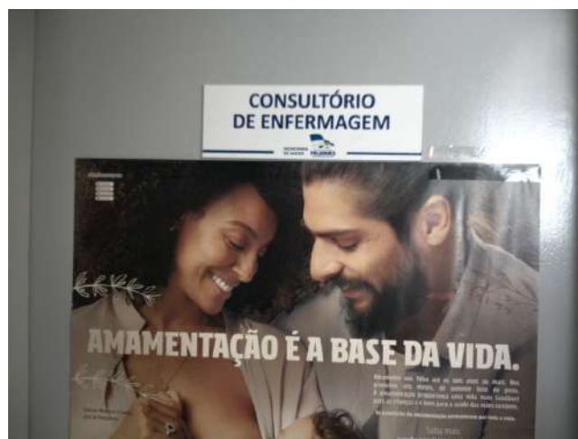
19.14. Consultório de enfermagem