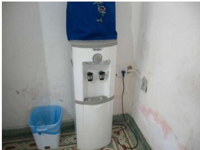
19.39. Recepção - bebedouro