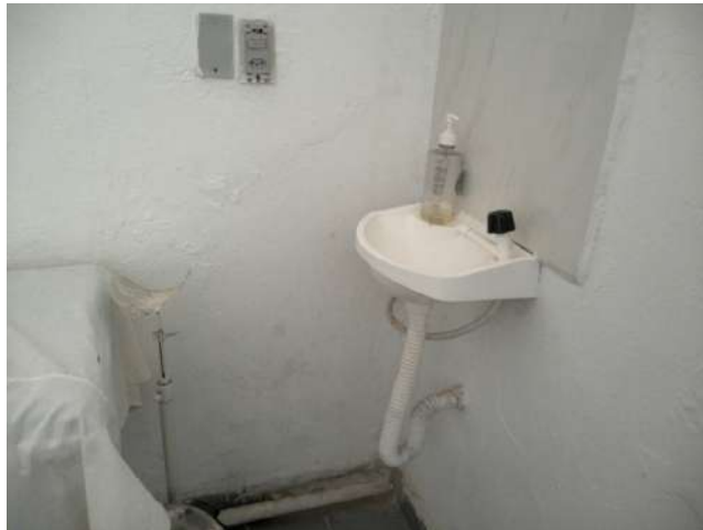
19.36. Sala de curativos - pia sem dispensador de sabão líquido e sem papel toalha