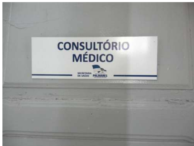
19.4. Consultório médico