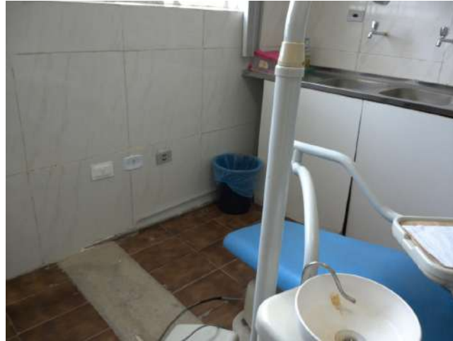
19.13. Consultório odontológico