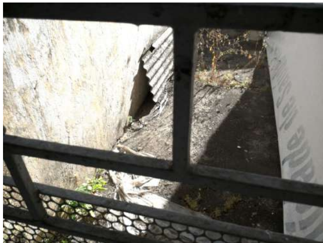
19.29. Vista de espaço ao lado da copa