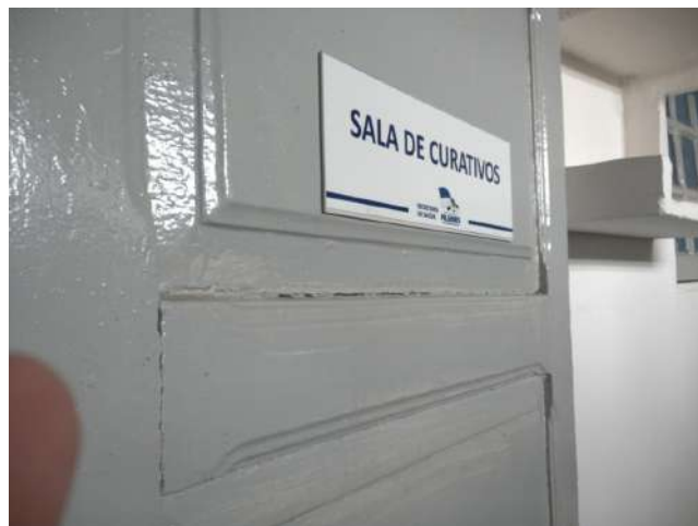
19.34. Sala de curativos