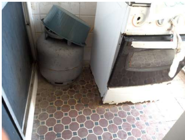
19.27. Copa - Botijão de gás interno