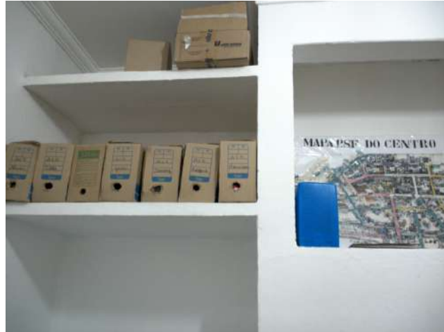
19.8. Consultório médico - Arquivo de prontuários