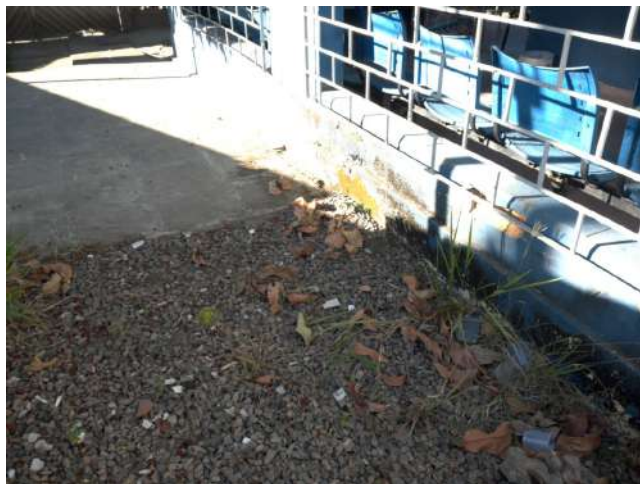
19.42. Área externa