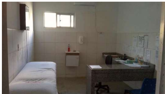
40.11. Consultório médico