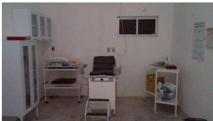
40.18. Sala de parto