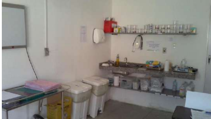
40.22. Setor covid (consultório médico-foto 1)