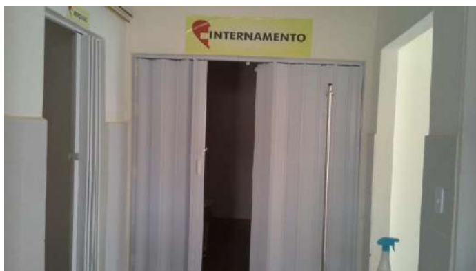
40.24. Internamento covid