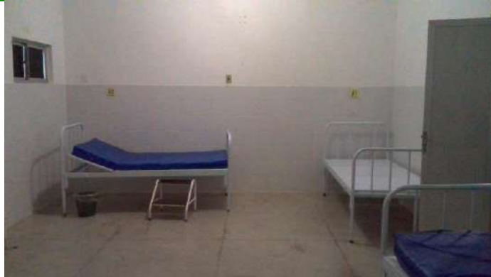
40.19. Enfermaria de clínica médica