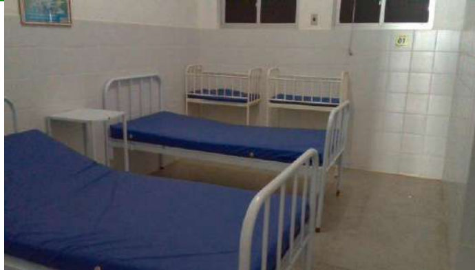
40.16. Alojamento conjunto