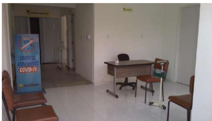
40.21. Setor covid (sala de espera)