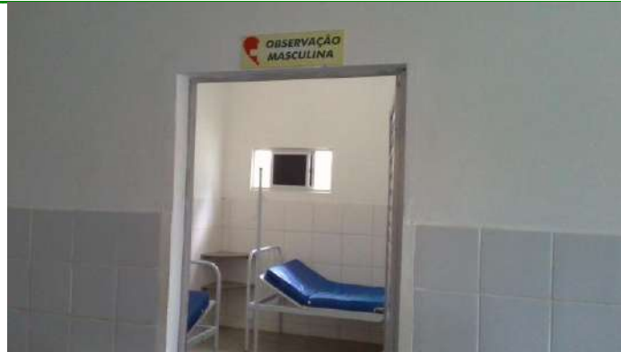
40.10. Sala de observação masculina