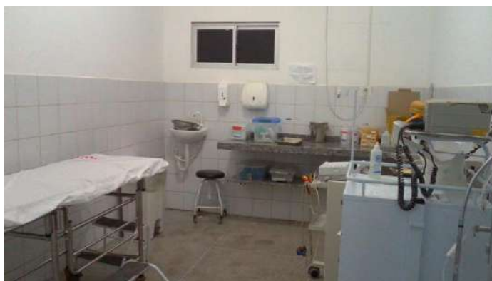
40.8. Sala vermelha (emergência geral)