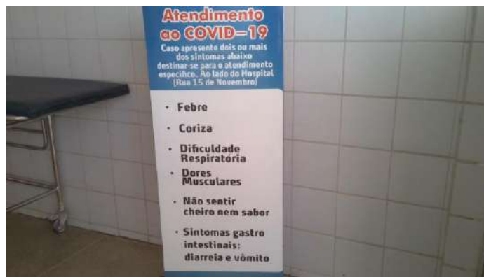
40.5. Informações sobre atendimento covid