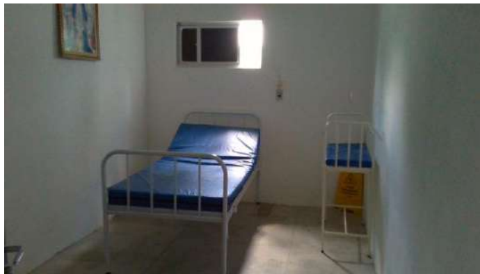
40.17. Enfermaria pediátrica