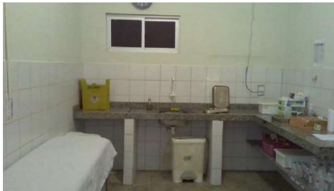
40.14. Posto de enfermagem e sala de medicação