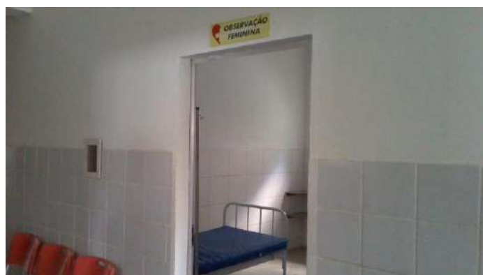
40.12. Sala de observação feminina