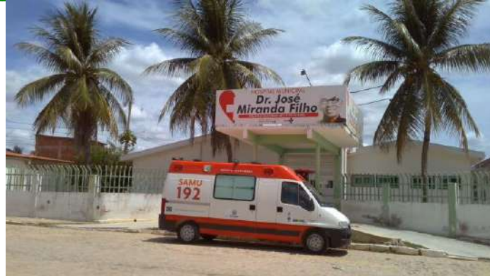
40.4. Hospital Dr. José Miranda Filho