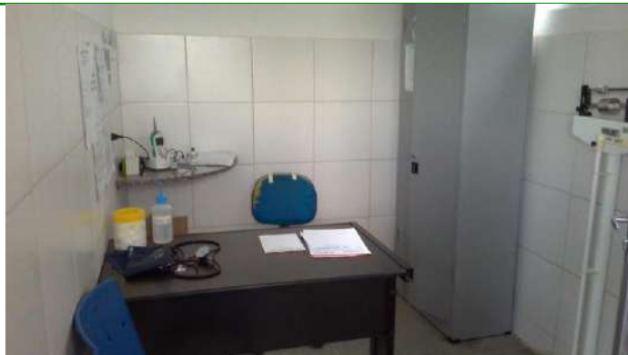
40.7. Sala de triagem da emergência geral