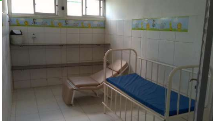
40.13. Sala de observação pediátrica