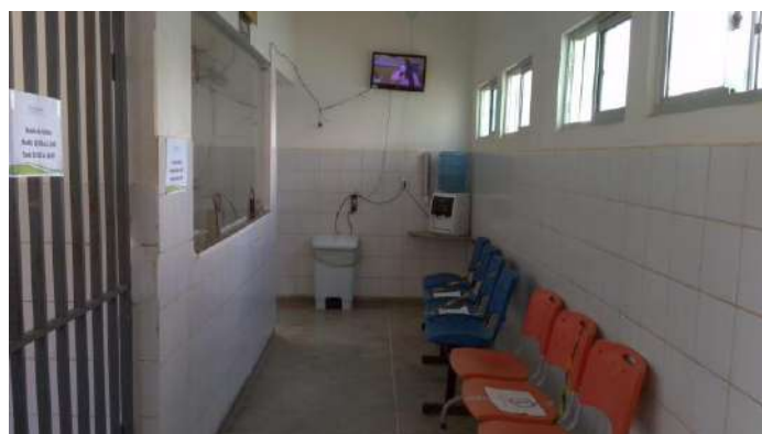
40.6. Recepção e sala de espera (emergência geral)