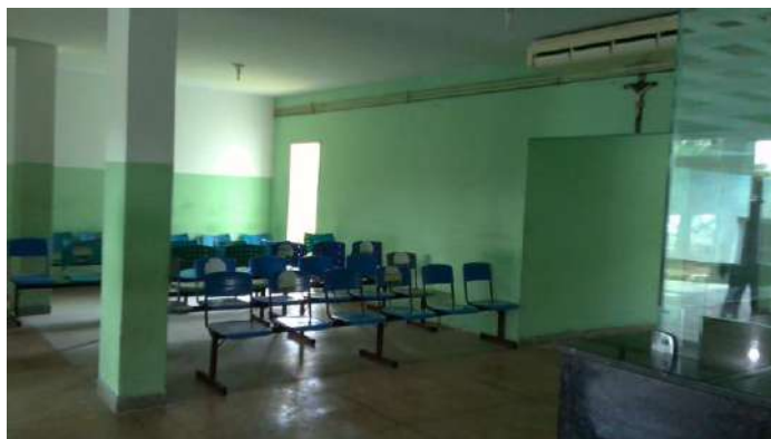
33.3. Recepção e sala de espera da emergência