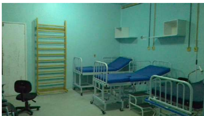
33.21. Sala de pré-parto