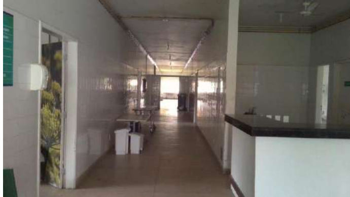
33.37. Enfermaria obstetrícia