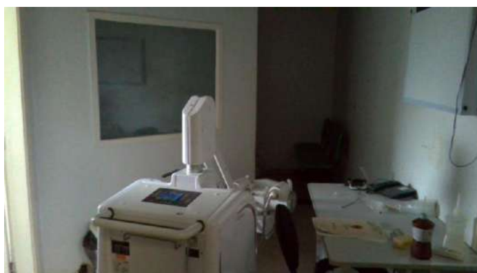
33.15. Sala de RX