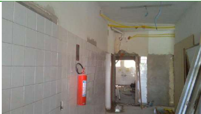
33.31. Reforma do setor covid