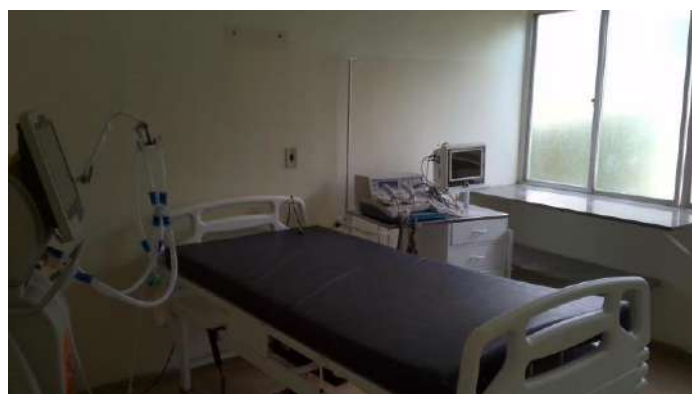
33.6. Sala amarela