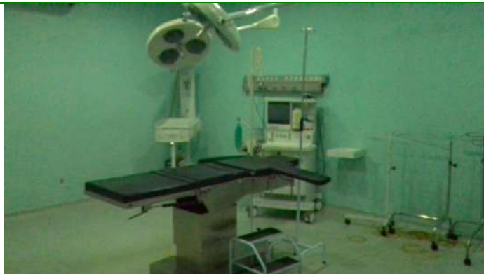
33.25. Sala cirúrgica 2