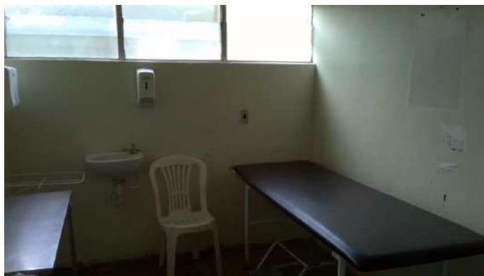
33.11. Sala de sutura