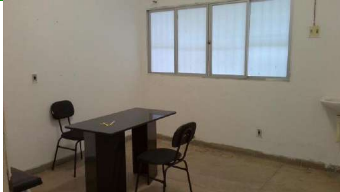
33.10. Consultório médico