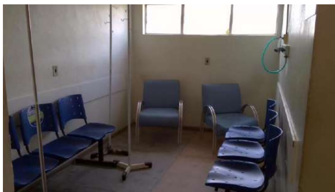
33.14. Sala de observação