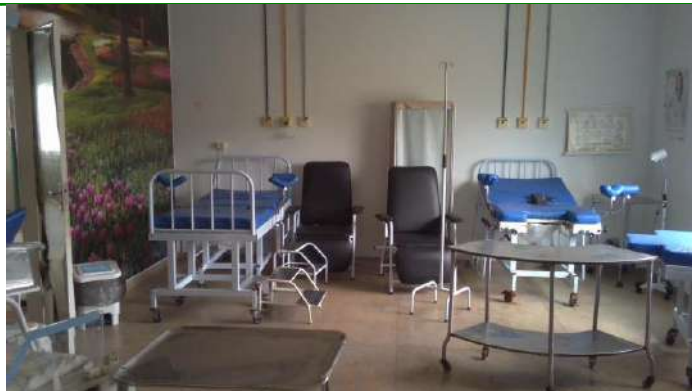
33.34. Sala PPP