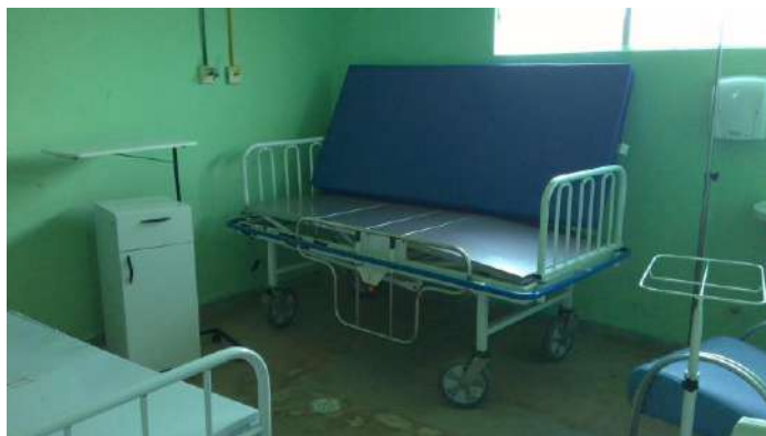
33.20. Sala amarela da obstetrícia