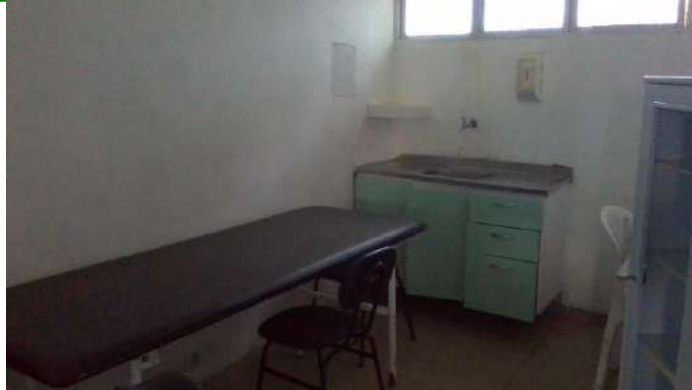
33.19. Sala de medicação da obstetrícia