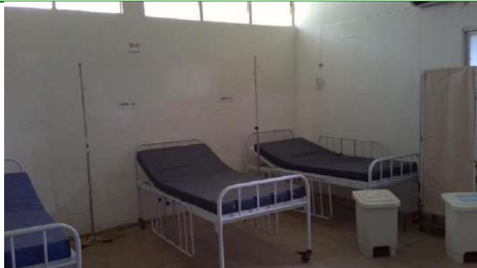
33.13. Banheiro anexo à sala amarela