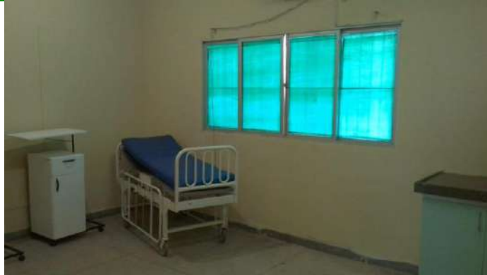
33.16. Triagem obstétrica