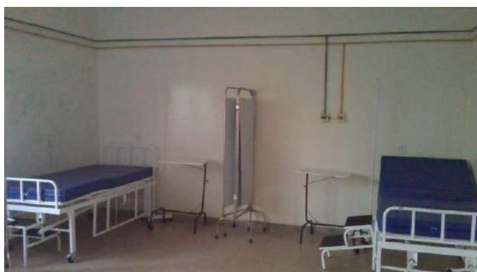
33.33. Quarto de enfermaria