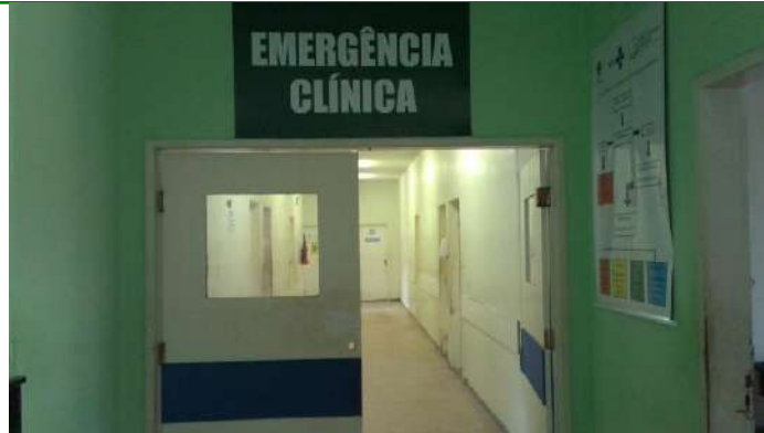
33.4. Emergência clínica