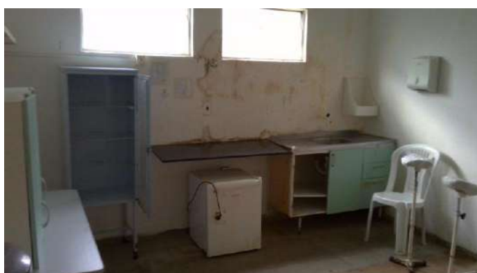
33.9. Sala de medicação