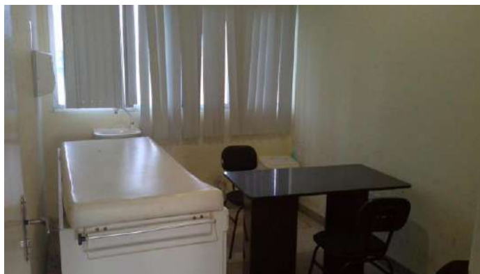
33.17. Consultório obstétrico