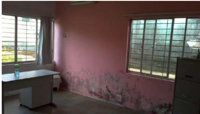
33.1. Sala utilizada previamente como almoxarifado