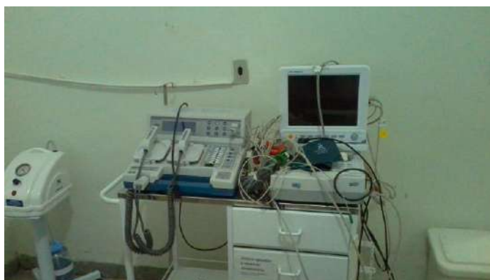
33.8. Monitor e desfibrilador da sala vermelha