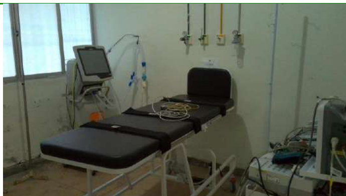
33.7. Sala vermelha