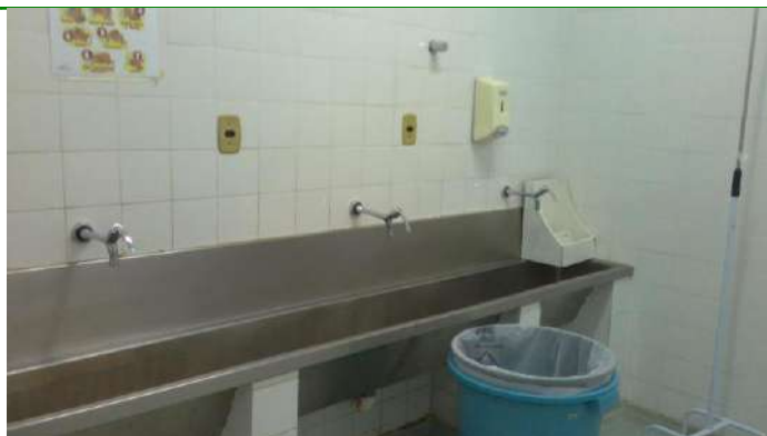
33.28. Lavabo do bloco cirúrgico