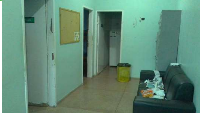
33.22. Repouso médico