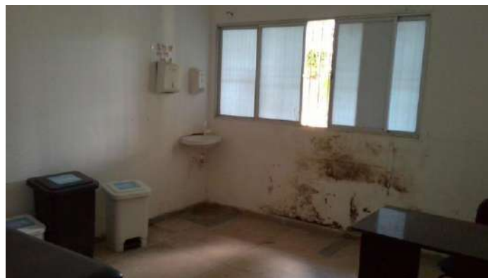
33.5. Sala de classificação de risco