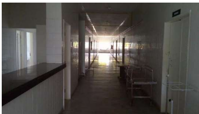
33.32. Enfermaria com 40 leitos