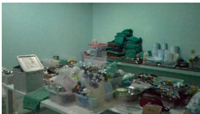
33.29. Arsenal do bloco cirúrgico