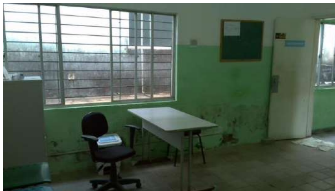
33.2. Recepção administrativa