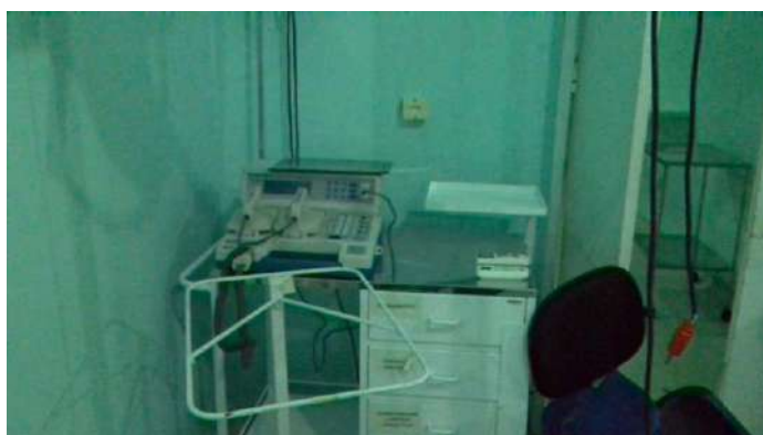
33.27. Desfibrilador e carrinho de parada do bloco cirúrgico