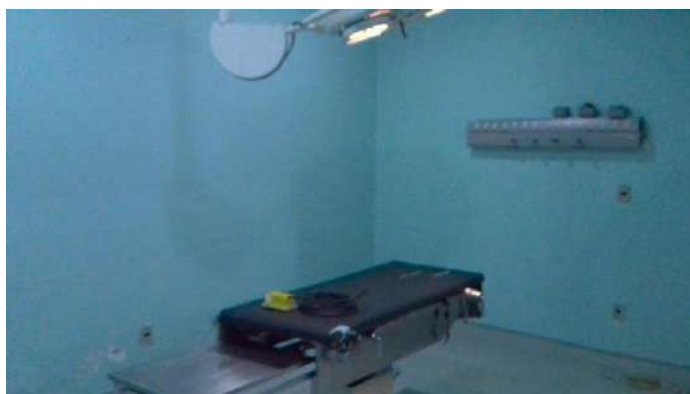
33.26. Sala de parto normal (sala cirúrgica 3)