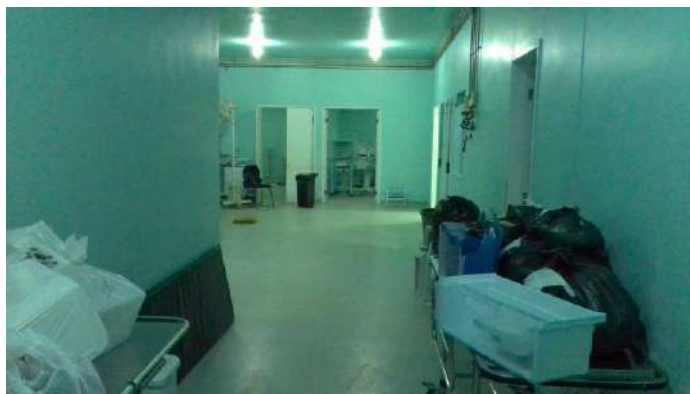
33.23. Bloco cirúrgico