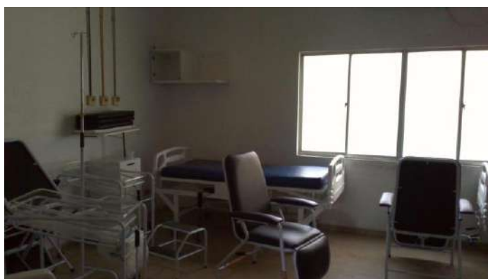
33.36. Alojamento conjunto