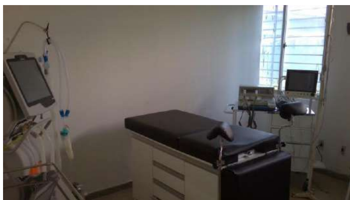
33.18. Sala vermelha da obstetrícia