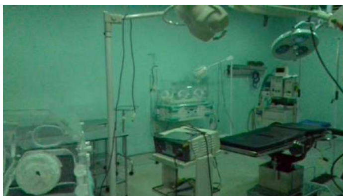
33.24. Sala cirúrgica 1