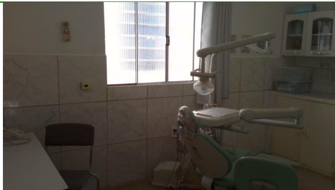
26.10. Consultório odontológico