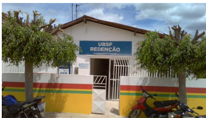
26.1. UBSF REDENÇÃO I