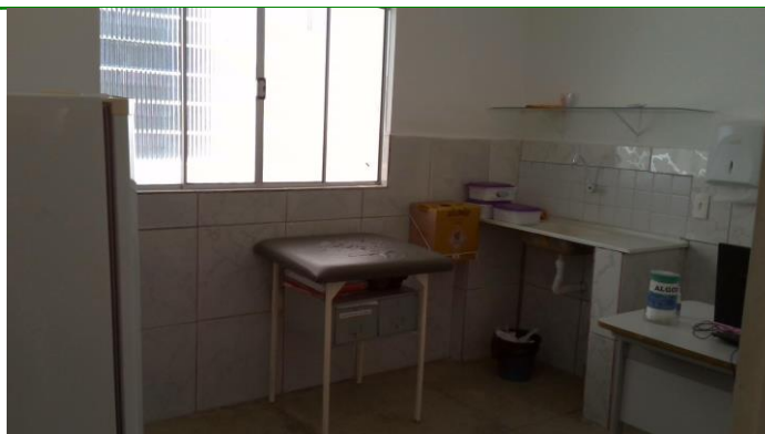
26.7. Sala de vacina