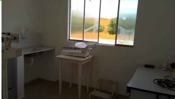
26.4. Sala de pré-consulta