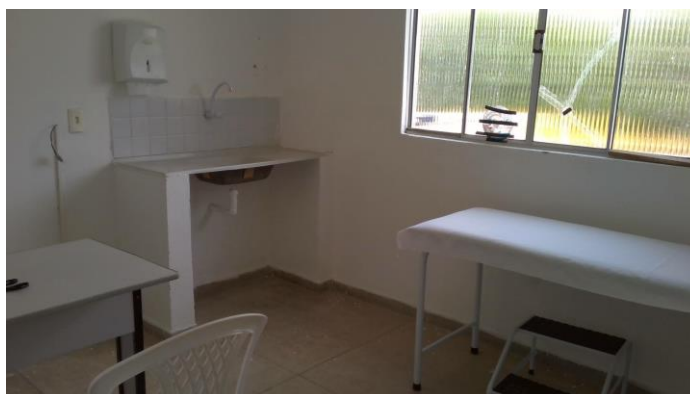
26.8. Consultório médico