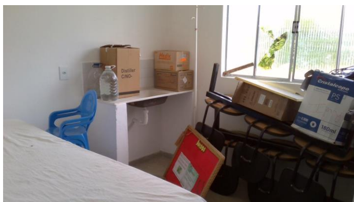
26.9. Antiga sala de esterilização foi transformada em depósito de material