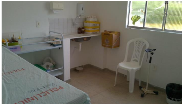
26.5. Sala de procedimento