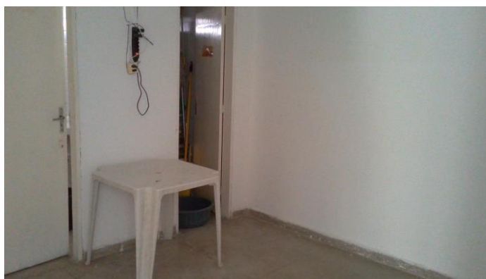
26.11. Antiga sala de reunião (desativada em virtude da reforma)