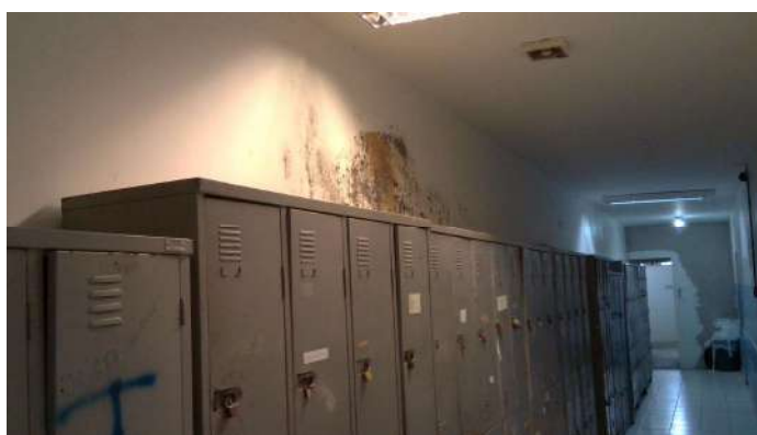
19.3. Parede com infiltração