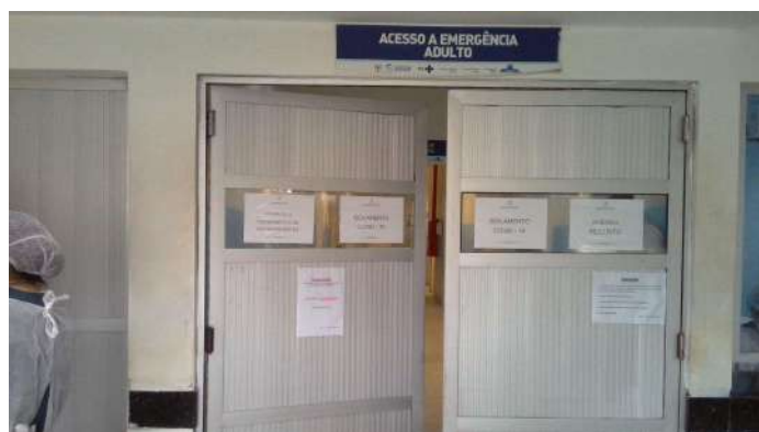
19.6. Área covid