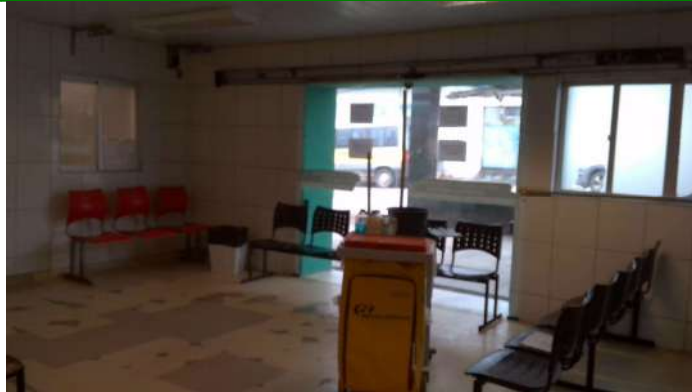
19.10. Sala de espera não covid