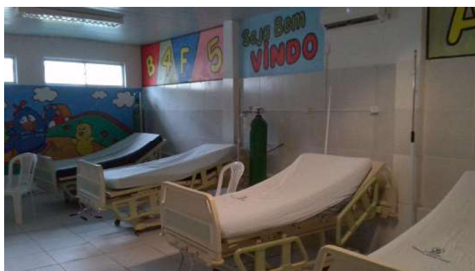
19.9. Sala de observação não covid