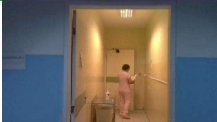
19.16. Sala de desparamentação