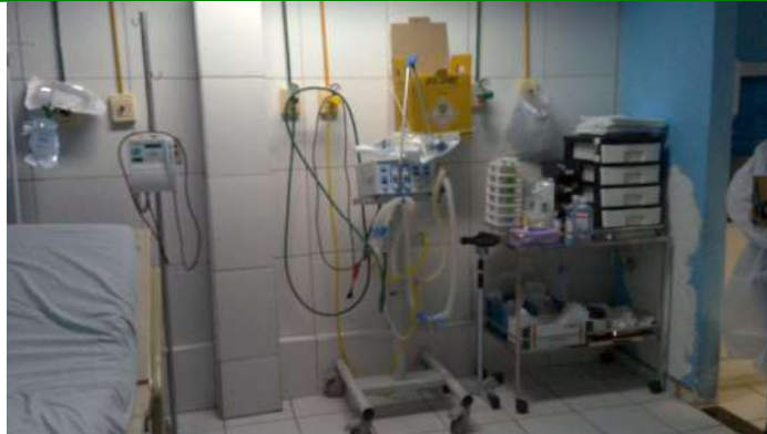
19.13. Sala vermelha 2 não covid