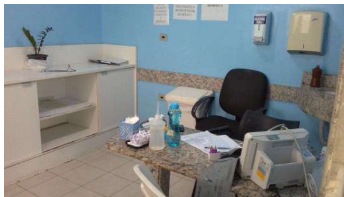
19.5. Sala de classificação de risco, única para covid e não covid