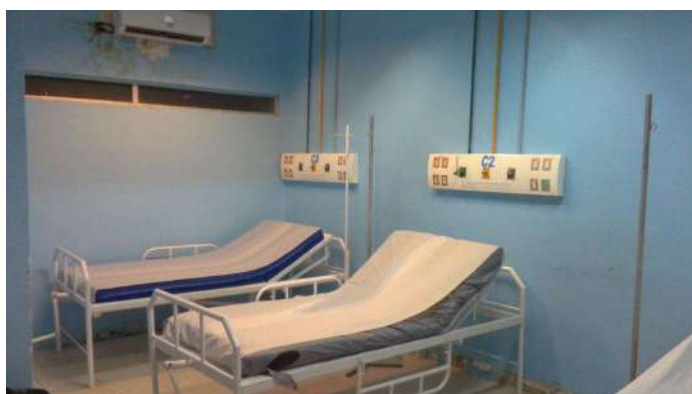
19.18. Sala de observação covid