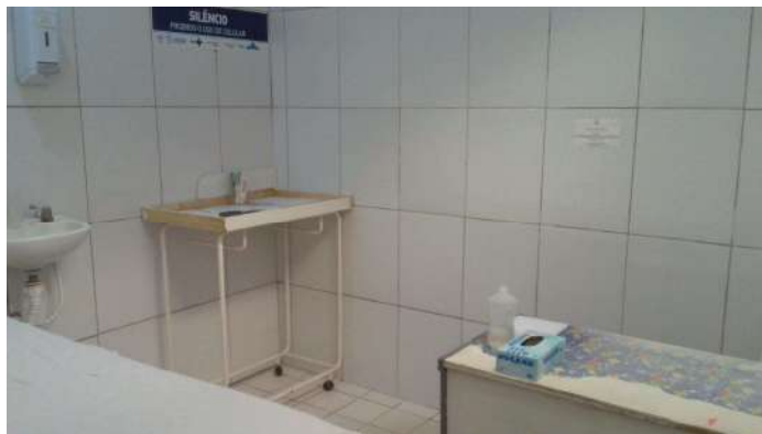
19.11. Consultório médico não covid