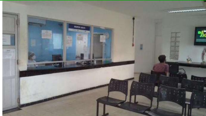
19.4. Recepção única