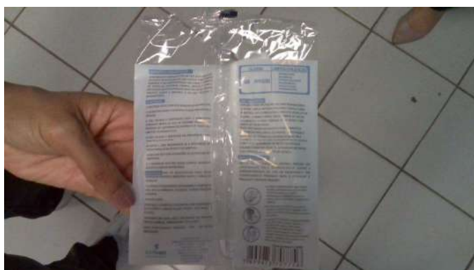
19.2. Máscara N95 sem certificação do Inmetro (foto 2)