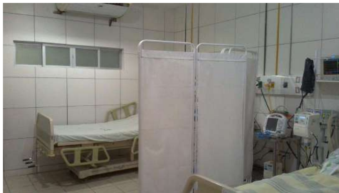
19.17. Sala vermelha covid