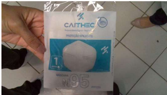
19.1. Máscara N95 sem certificação do Inmetro (foto 1)