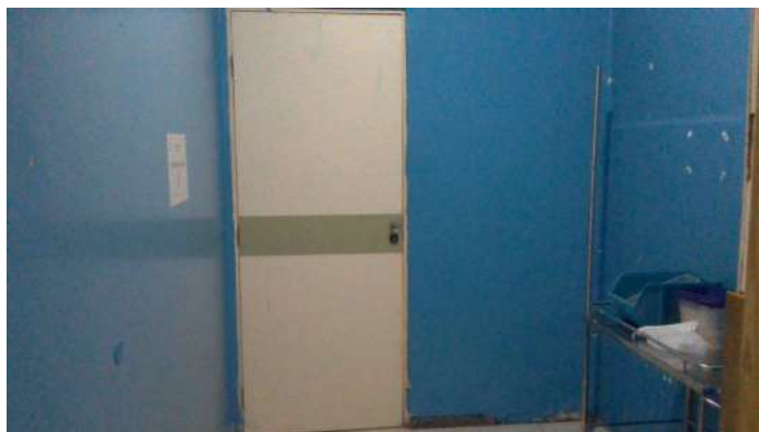
19.15. Sala de paramentação