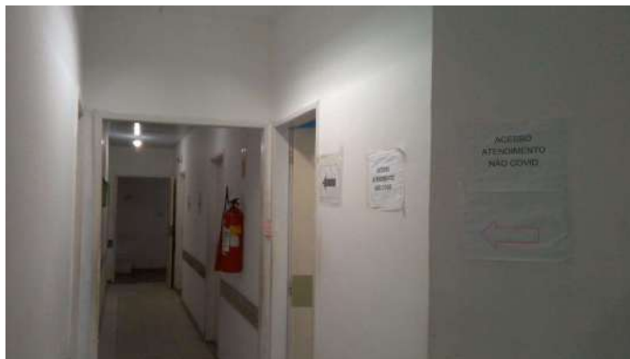
19.8. Acesso atendimento não covid