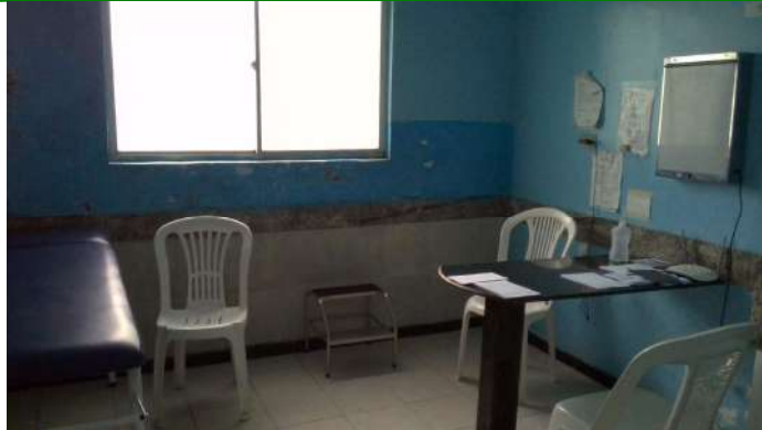
19.7. Consultório covid área verde