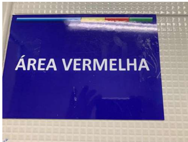
26.1. Sala Vermelha