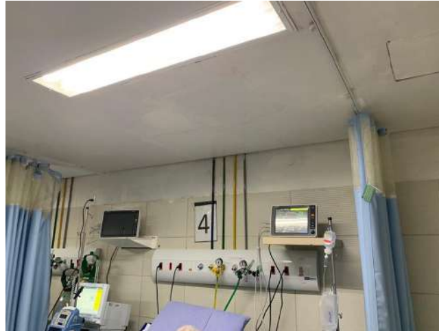
26.3. Sala Vermelha