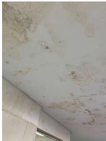
26.9. Teto Urgencia