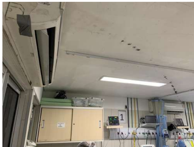
26.2. Sala Vermelha