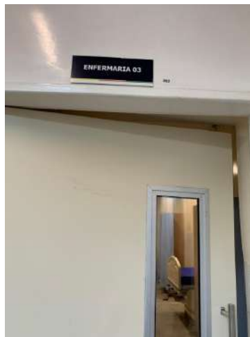
26.12. Area Covid