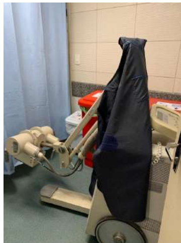
26.4. Raio X Movei