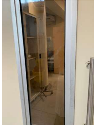
26.13. Area Covid