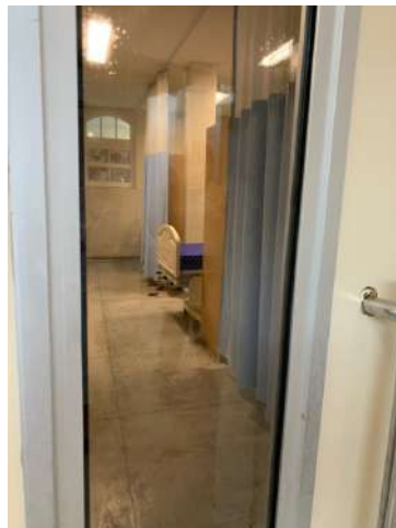
26.14. Area Covid