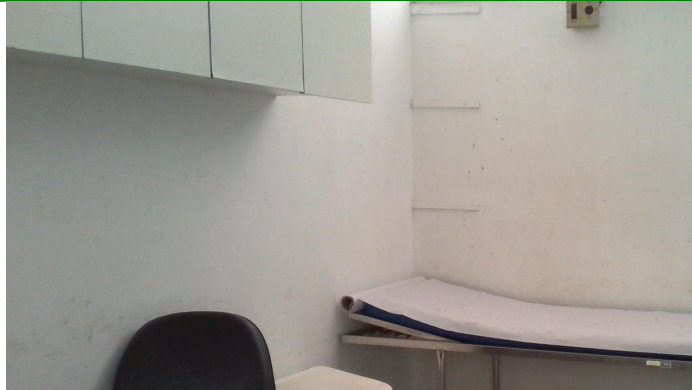
23.7. Sala de procedimentos