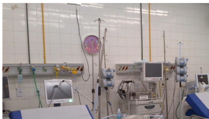
23.6. Sala vermelha adulto (não covid)