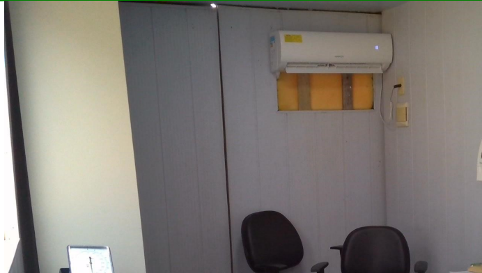
23.10. Consultório covid container (interno)