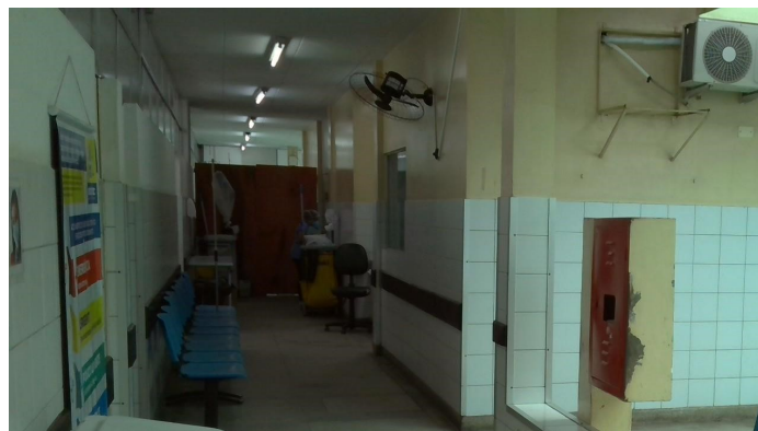
23.5. Clínica médica não covid