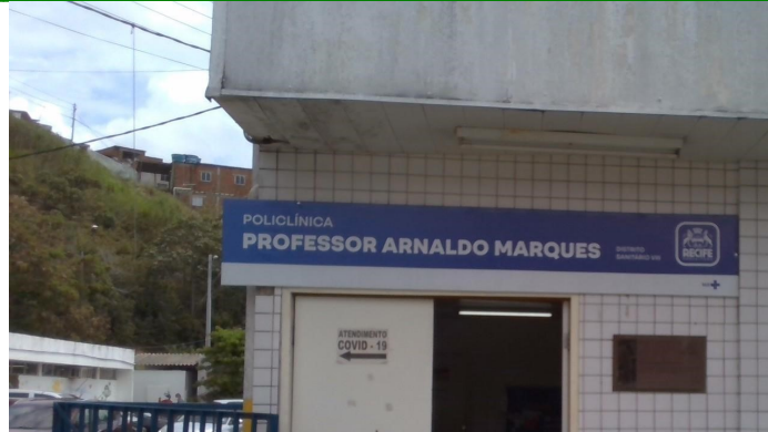
23.4. Porta de entrada não covid