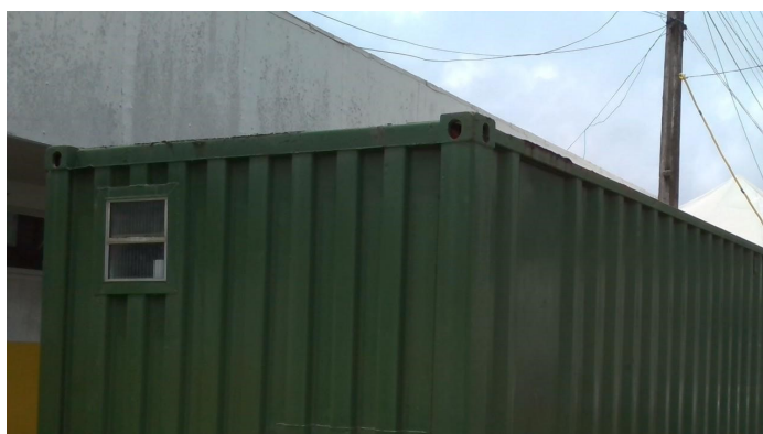
23.9. Container consultório covid