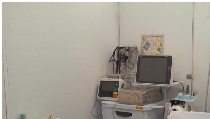
23.8. Sala vermelha da pediatria