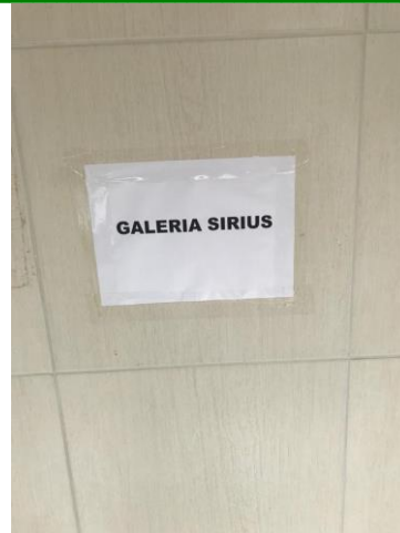
4.3. Nome da Galeria