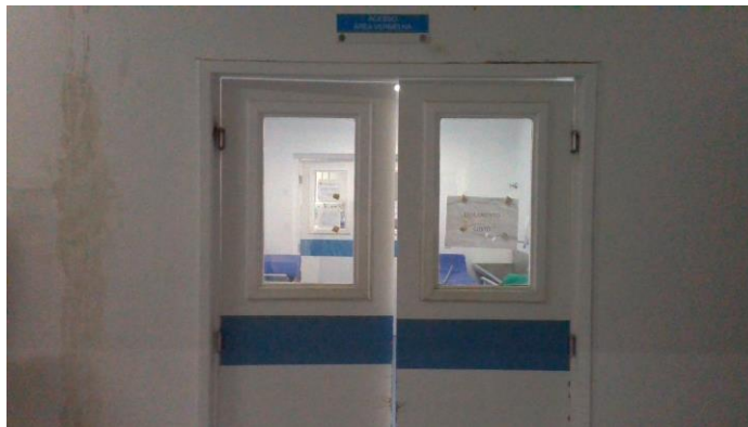
17.5. Área covid com fluxo separado da emergência não covid