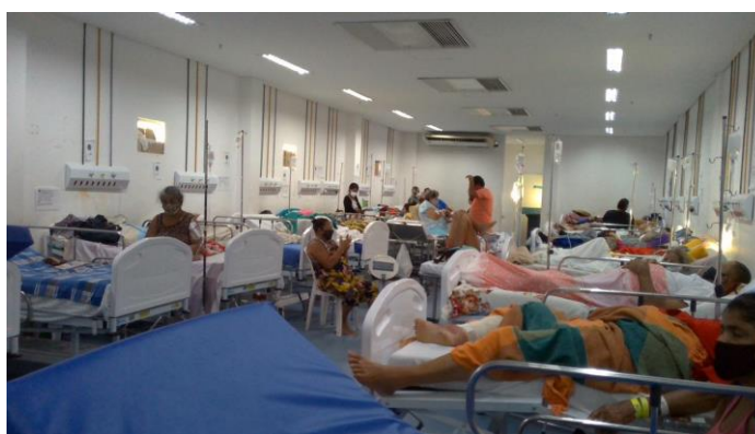
17.2. Área verde