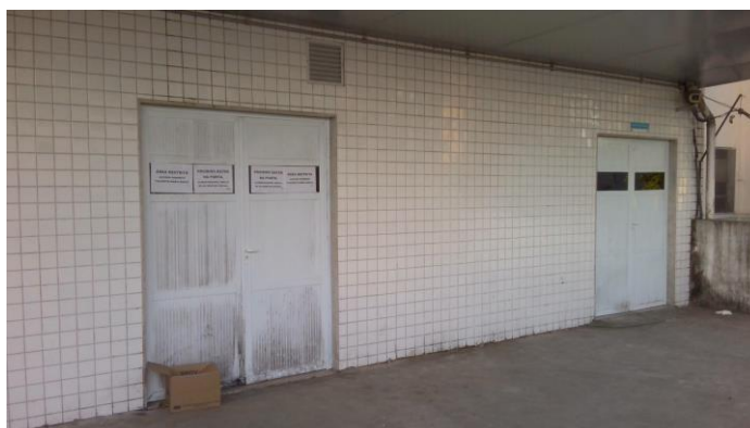
17.8. Entrada covid (porta da esquerda é a entrada dos pacientes e a da direita é a desparamentação)