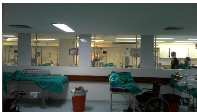
17.12. SRPA (observar da parede para lá é a srpa propriamente dita, para cá é o corredor da srpa, onde não era para ter paciente)