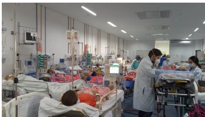
17.3. Superlotação da área vermelha