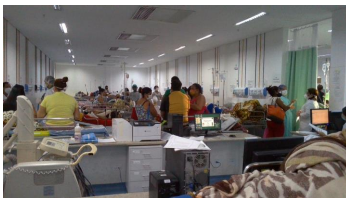
17.1. Superlotação da emergência (área verde)