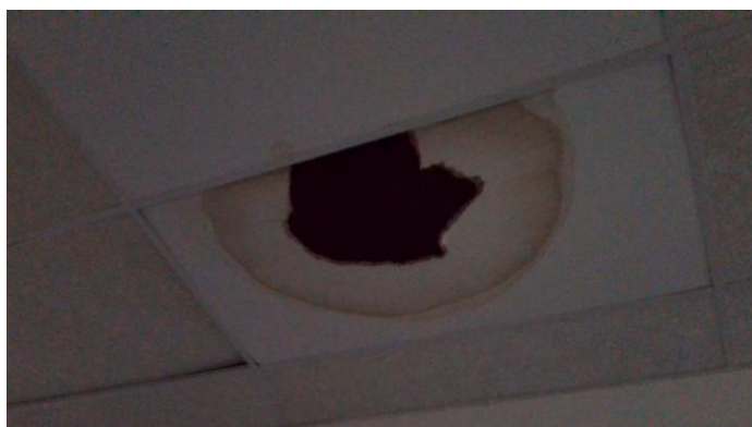
17.9. Teto danificado por infiltração após chuva (13.05.2021)