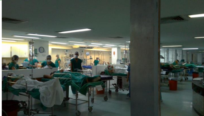
17.13. SRPA (superlotação)