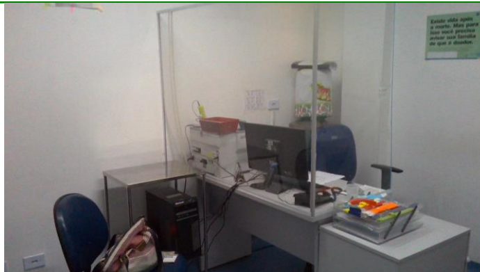
17.7. Classificação de risco