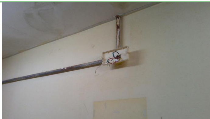
17.10. Infraestrutura precária