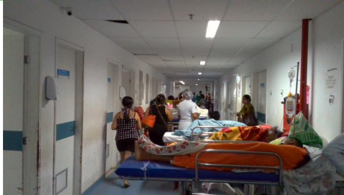
17.4. Pacientes internados no corredor