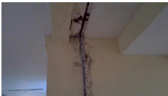
17.11. Infraestrutura precária