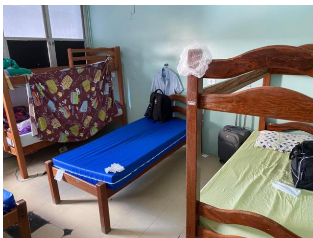
19.7. ALOJAMENTO MEDICO MISTO