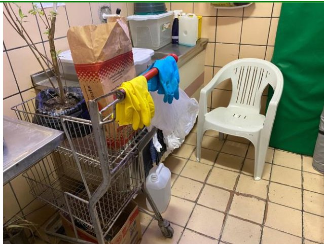
19.6. EXPURGO TRIAGEM