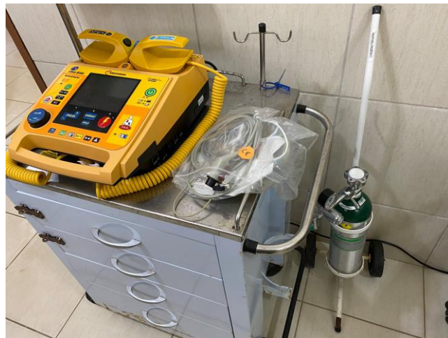
14.4. Carro de Parada