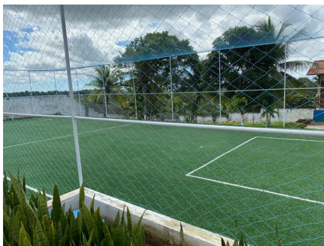
14.2. campo de futebol